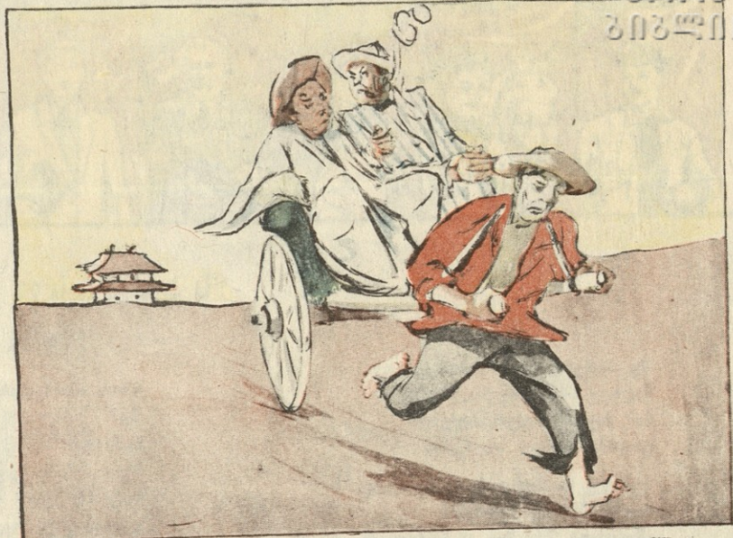
დიდ გასაჭირში იყო ნიადაგი ორი ბატონის მონა-მსახური...

განსხვავება არ არისო — ამბობს უფროსალი „ამერიკა“, ამასვე ამბობს მედიცინის დოქტორი ვილიამ მენინგერი.