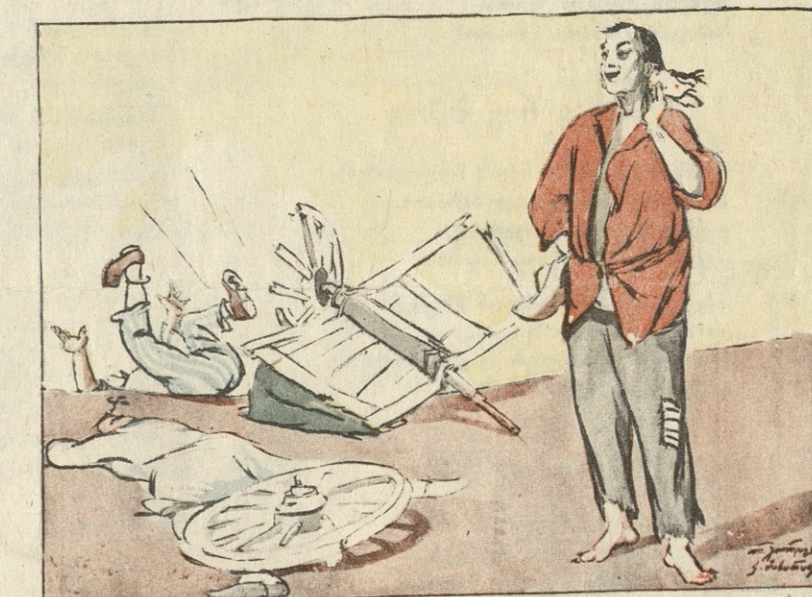
მაგრამ აქ უკვე მისი მონობის დასასრულია გამოსახული.