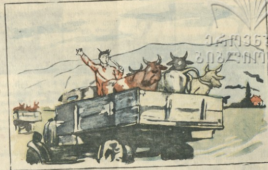
სულგუნი და ჭყინტი ყველი ამ სოფელში უნდა ნახოთ. საქონელი საგანგებოდ გალმა დაჭყაეთ საბაბაზო!