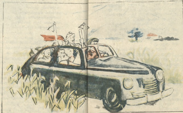
თუმცა მათი სარბიელი ახლაც ისევ სიმინდია, — მამა-პაპურ სილუსჭირის სტოლებზე და წინ მიიღიწ!