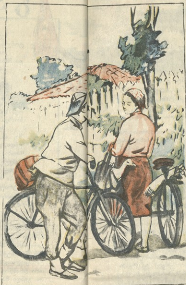
განა აქაც სპორტსმენები შევხვდით და ჭიდილია! — უცაბედი შეხვედრაა და შარაგზის იდილია...