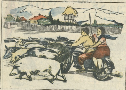
ჩვენი სოფლის სურათია: აქვე, ღიბის მთების ახლო, სახედიდან თქვენი შრომის გვიროსა სამშობლო და სამოსახლო.