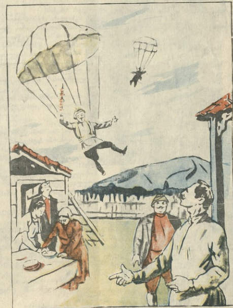
მაცე მოვა შემოვლომა, გაჩაღებმა ქორწილები, გოგონებც ფრთებს აშლიან, შინ რომ სხედან შორჩილებით...