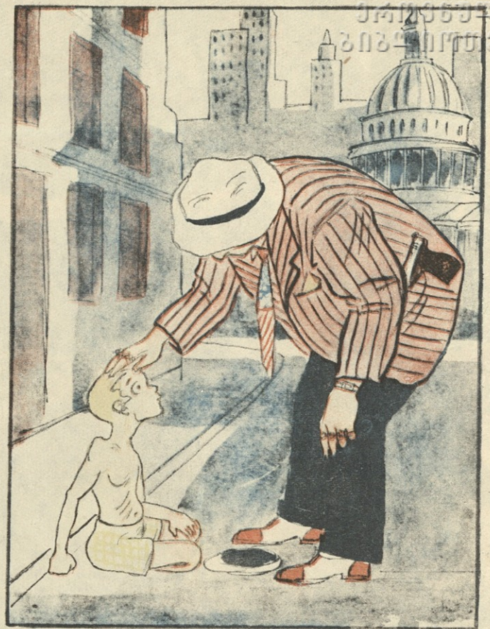
2. ამერიკელი ძია—არა გრცხვენია, ამოდენა ბიჭი ხარ და მათხოვრობ, —დროა ბანდიტობას მოჰკიდო ხელი.