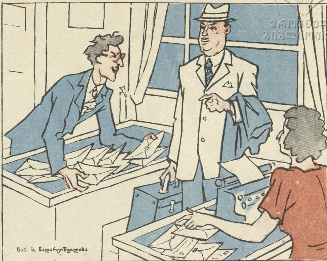
ნახ. ს. ნადარეიშვილისა

— სასწრაფოდ უპასუხეთ... მე კი დღეიდან უკვე შევებულებაში ვრთვები, ბოლოს და ბოლოს, მეც ხომ უნდა დავისვენო, დამლაღა ამდენმა მიწერ-მოწერამ!