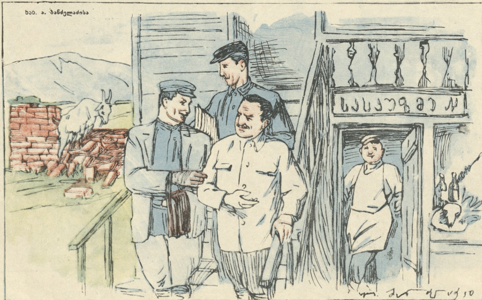
ნახ. ა. ბანძელაძისა

ამხ. კ. ჩარკვიანის მოხსენებიდან საქართველოს კ. პ. (ბ) ცენტრალური კომიტეტის პლენუმზე