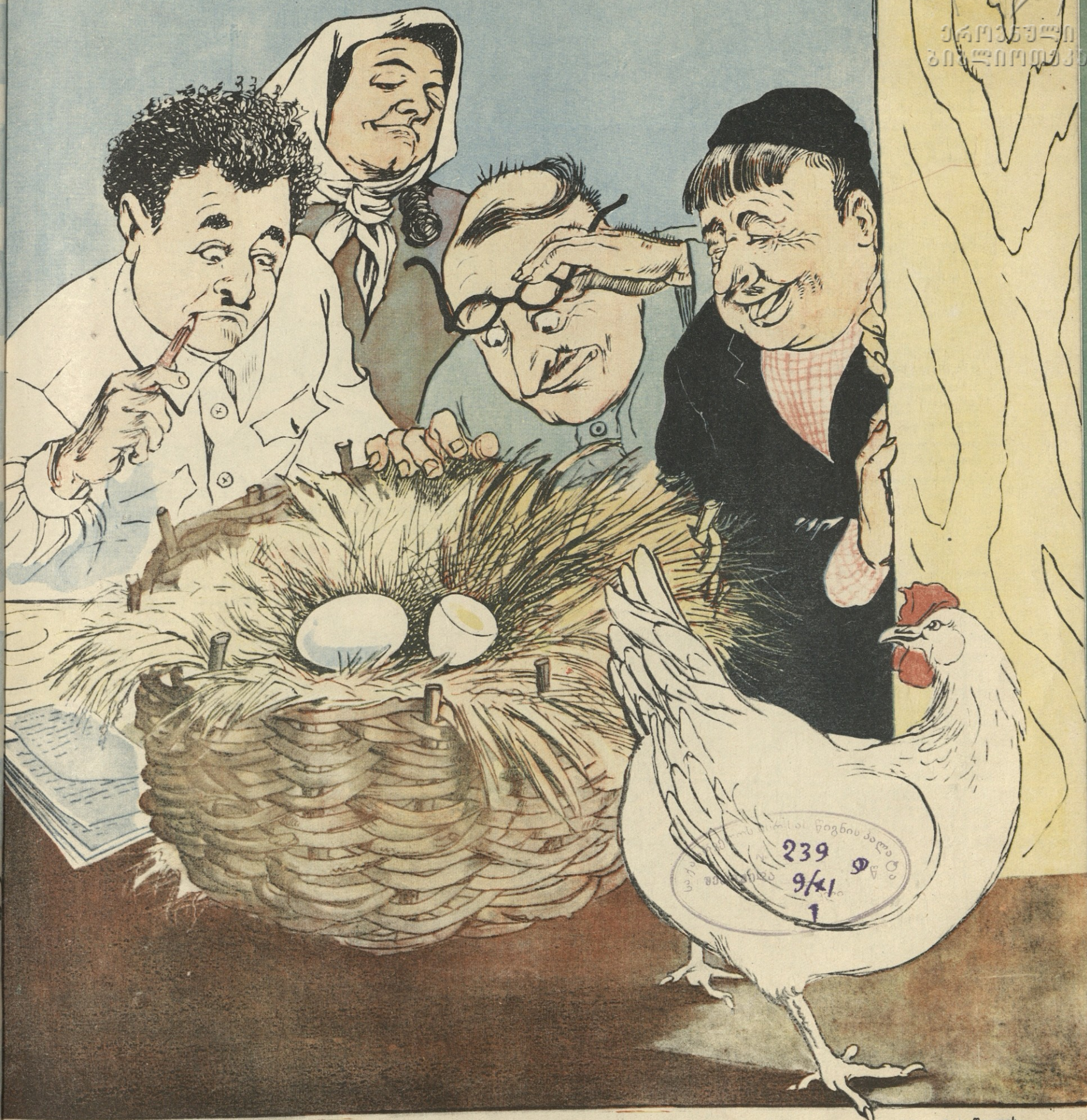
ნახ. ი. ქოქიაშვილისა