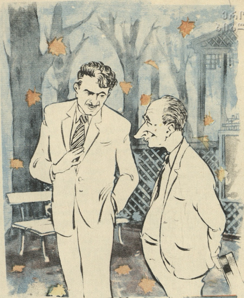
— ჩემო ვანო, დაგვიზამთრდა, იქნებ ახლა მაინც დავჯდეთ და ვიფიქროთ ჩვენი ესტრადის რეპერტუარის განახლებისათვის.

გოგის გამოეღვიძა. — რა ამბავია? — ლოგინიდანვე იკითხა მან, მაგრამ ჩემს პასუხს ვიღამ დაუცადა, „ხანძარი, ხანძარი“,