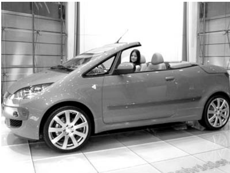
მიცუბისი კოლტ კაბრიო

როცა "ნესიზე" მუშაობდნენ, "მიცუბისის" კონსტრუქტორთა მიზანი იყო უზოობის ისეთი ავტომობილის შექმნა, რომელსაც წარმომადგენლობითი ავტომობილის შესაბამისი კომფორტულობა ექნებოდა და არც გამოწვავილიყო აირებით დაბინძურებდა გარემოს. სწორედ ამიტომ იქნა არჩეული წყალგაძლევი ფიჭური ელემენტების გამოყენება. ავტომობილს