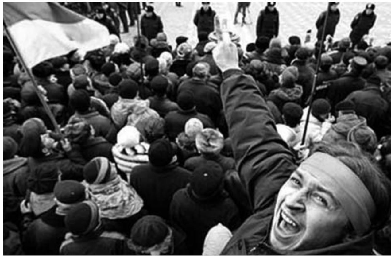
ნარინჯისფერი რევოლუციისგან მოტივილი იმედების ასრულებას აგვიანდება.