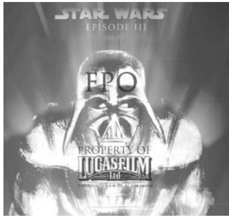
დღეს თბილისში მსოფლიო პრემიერა

"რუსთაველი" ქართული "ვარსკვლავების ომები" იწყება