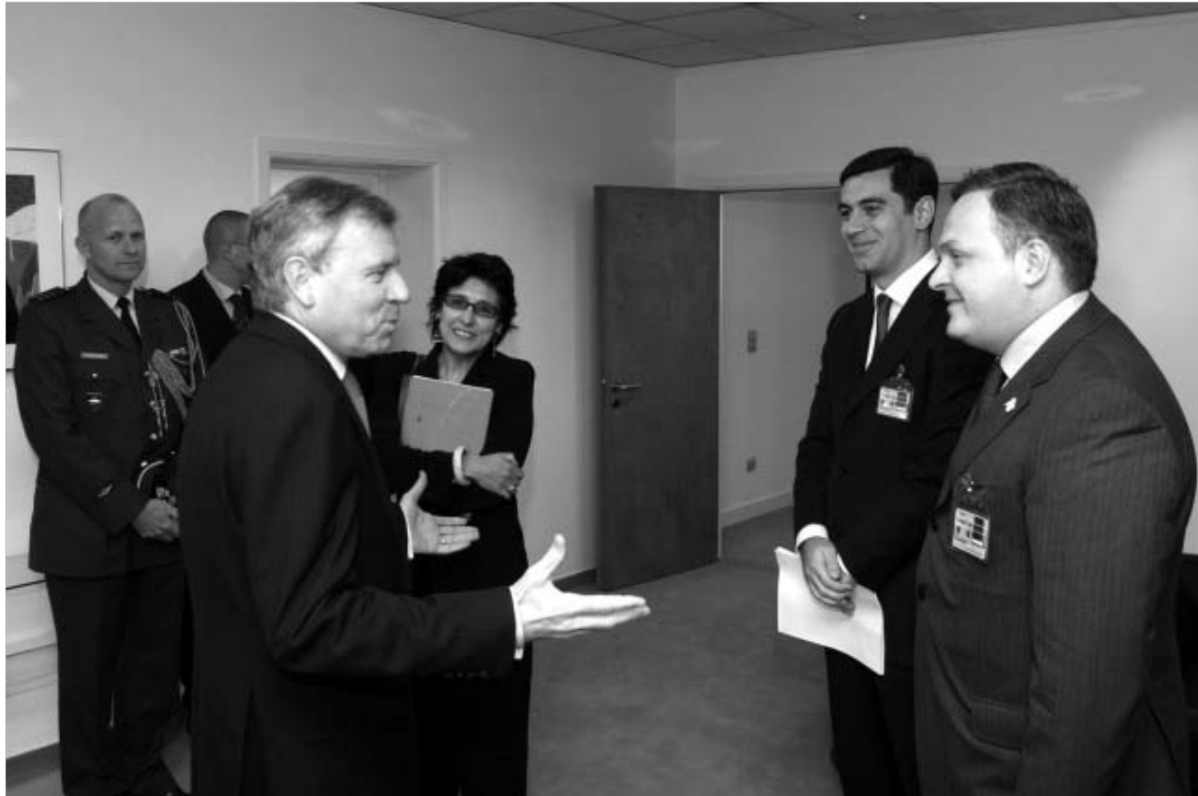
ჩრდილოატლანტიკური ალიანსის წევრი ქვეყნები დაინტერესებულნი არიან, საქართველომ წარმატებით შესრულოს IPAP-ის პროგრამა. - ასე ამხნევებდა იაპ ზუპ სხეფერი ქართული დელეგაციის წევრებს.

ნატო-ს შტაბბინაში საქართველოს მიერ "საშინაო დავების" შესრულებას განიხილვენ