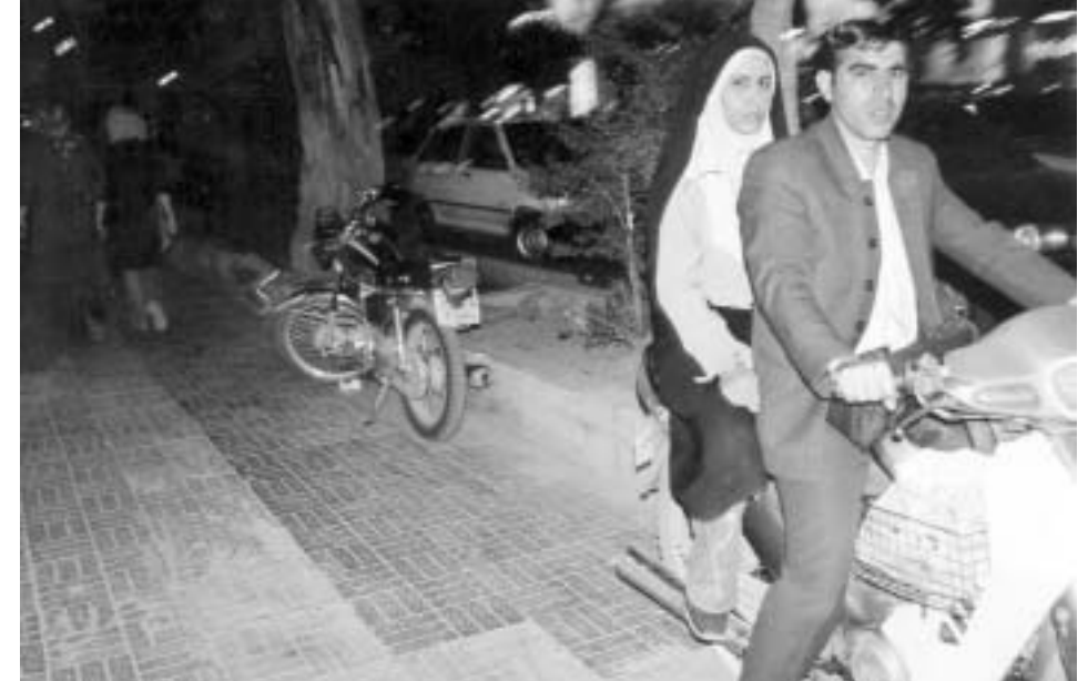
მოტოციკლით თეირანში გადაადგილების ყველაზე პოპულარული საშუალება