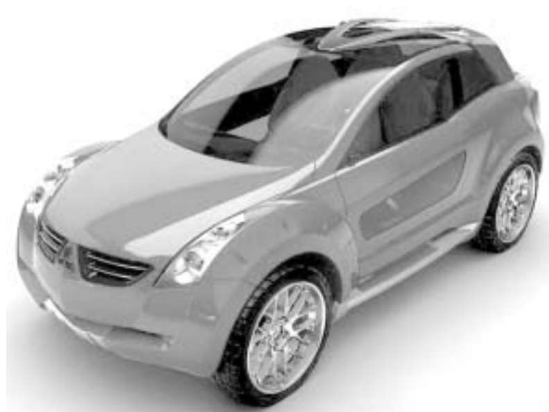
იტალიანი მიცუბისი ნესი

იმის ხაზგასახმელად, რომ ეს არის უგზობის ავტომობილი, "ნესი" აღჭურვილია უზარმაზარი