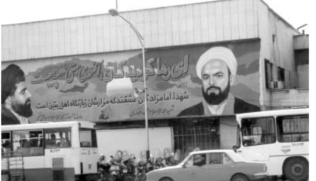
თეირანის ტაბური პეიზაჟი