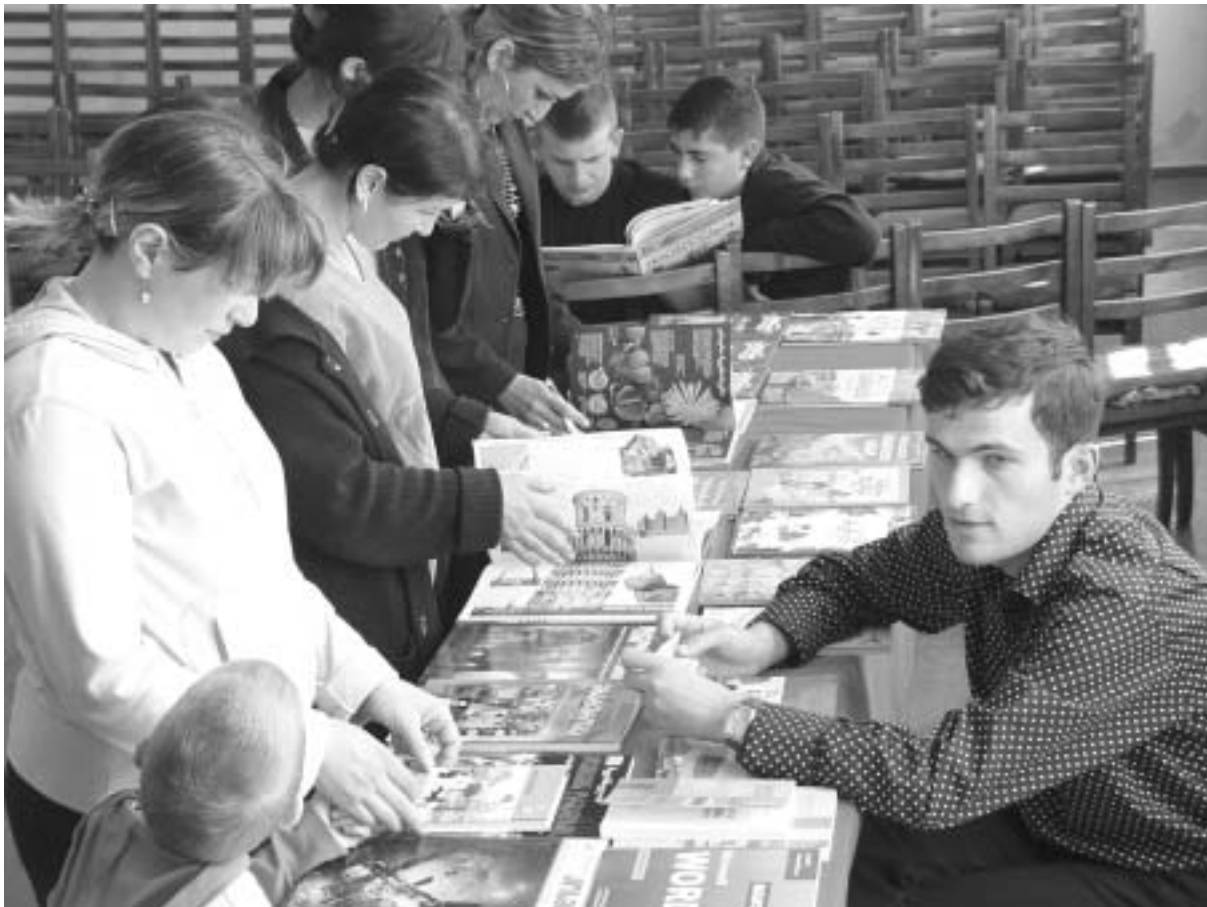
ბავშვები ინტერესით ათვალეობენ წიგნებს

სკოლის ბიბლიოთეკარი ერთ-ერთი თაყვანისმცემელი მკითხველი პატარა მკითხველების სიმცირეს არ უჩივის. პრობლემა მხოლოდ ის არის, რომ 90-იანი წლების დასაწყისამდე სკოლა რუსულენოვანი იყო და, შესაბამისად, ბიბლიოთეკაც რუსული ლიტერატურით მარაგდებოდა. დღეს აქ მხოლოდ 660 ქართული წიგნია. ისინი სკოლას პედაგოგებმა და ბავშვებმა შეესწორეს. რიგის განახლდა ბიბლიოთეკის ფონდი კაპიტალურად, არავის ახსოვს. თუმცა, შარშან, მსოფლიო ბანკ-