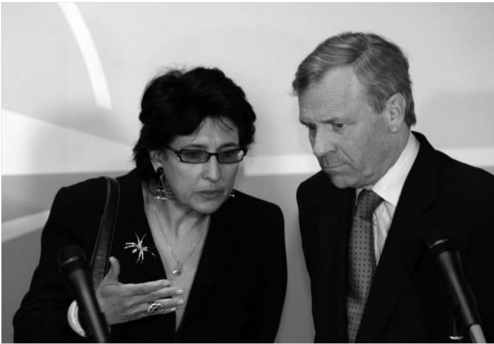
ნატო-ს გენერალური მდივანი სამხედრო ბაზების გაყვანისთან დაკავშირებით მიმდინარე მოლაპარაკებების შესახებ ინფორმაციას უშუალოდ სალომე ზურაბიშვილისგან იღებდა.