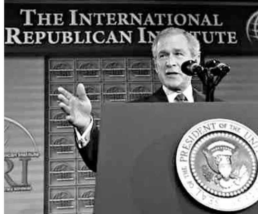
მოელი მსოფლიოს ტრანსპარენტობის გაზრდის მიზნით „თავისუფლების ჭილის მხარდობა“.