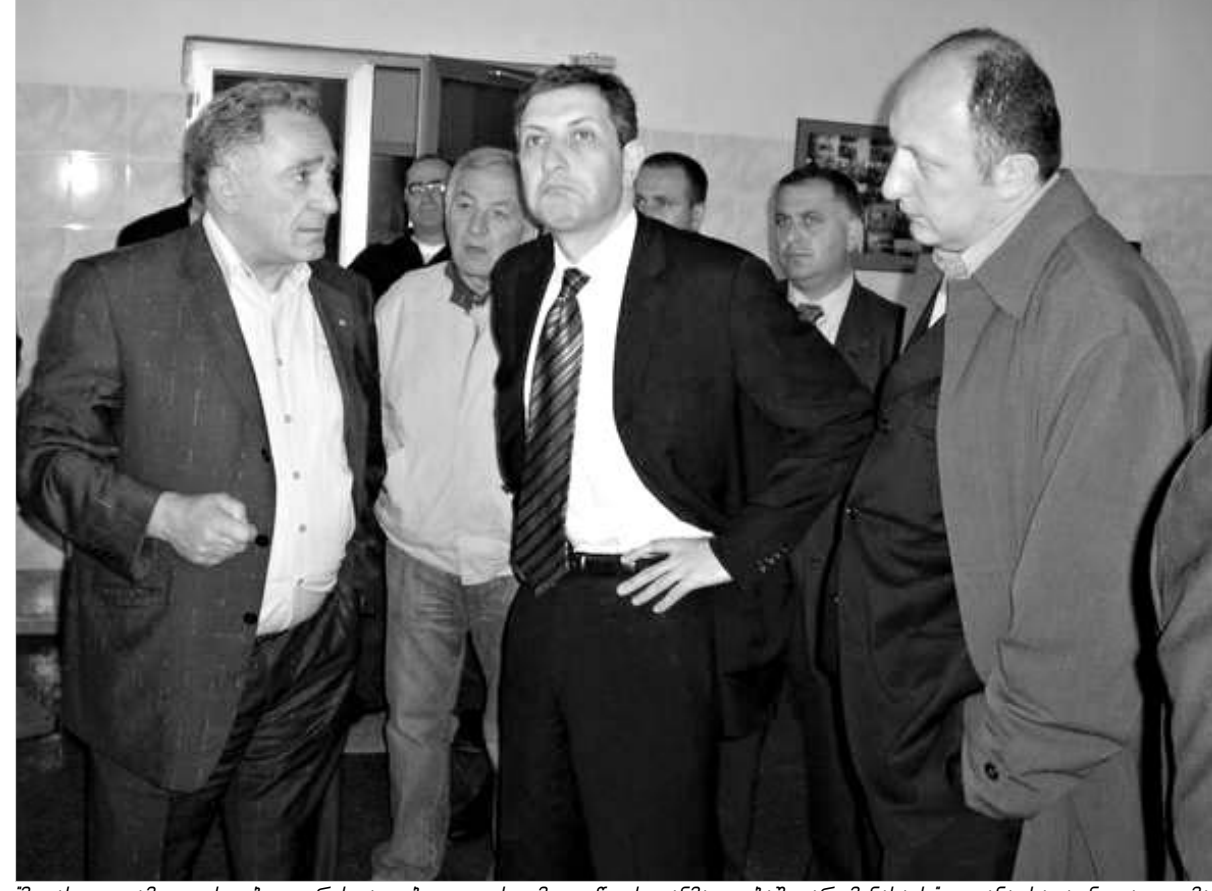
შეკრები გამორეკლებული რუსთაველი ბოლო თხოუთიტი წლის განმავლობაში არ მინახავს.“ - განაცხადა ნოღაიდელმა.