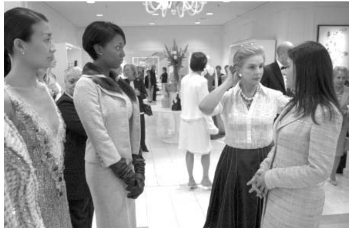
კაროლინა ჰერერა (მარჯვნივ) თვის მოდელბთან ერთად

"კაროლინა ჰერერა: მოდის დედოფლის პორტრეტი" - ეს ერთ-ერთი ბოლოა იმ დიდი ფორმატის უხვად ილუსტრირებულ ნიგნებს შორის, რომელთაც ამერიკულ საგამომცემლო საქმეში ასე უწოდებენ: "ყავის მაგიდის ნიგნები".