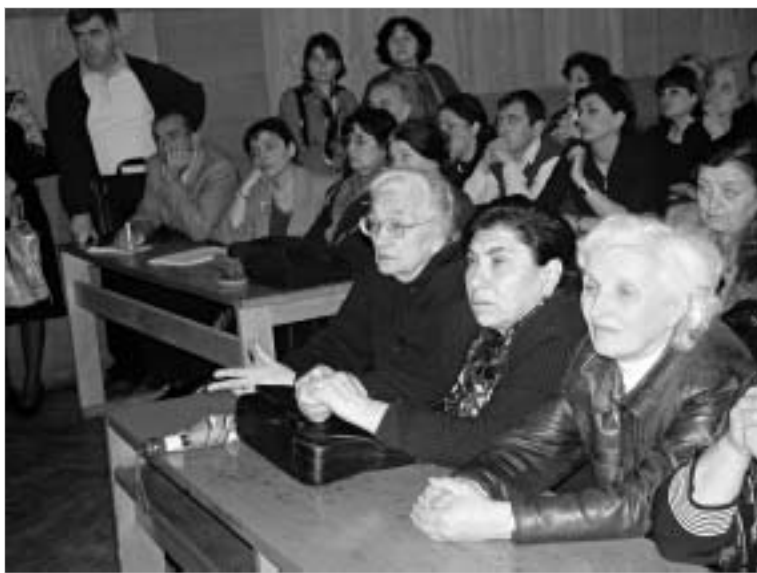
საუნივერსიტეტო „ძელო“ პროფესორ ახალი ხელმძღვანელობის კურსს „საუნივერსიტეტო დარბაზის“ შექმნით ასახეობს.

„საუნივერსიტეტო დარბაზი“ მიზნებს აყალიბებს