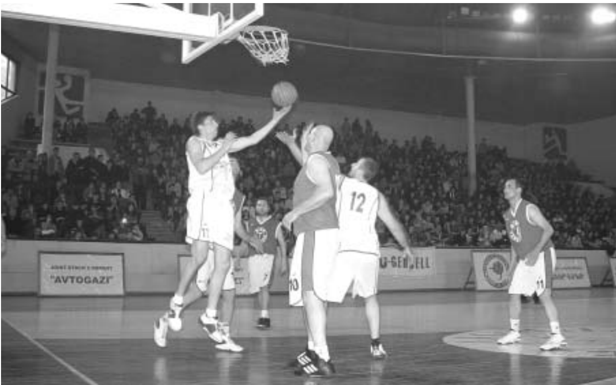
ფინალის გადაწყვეტი მე-5 შეხვედრა სამშაბათს გაიმართება