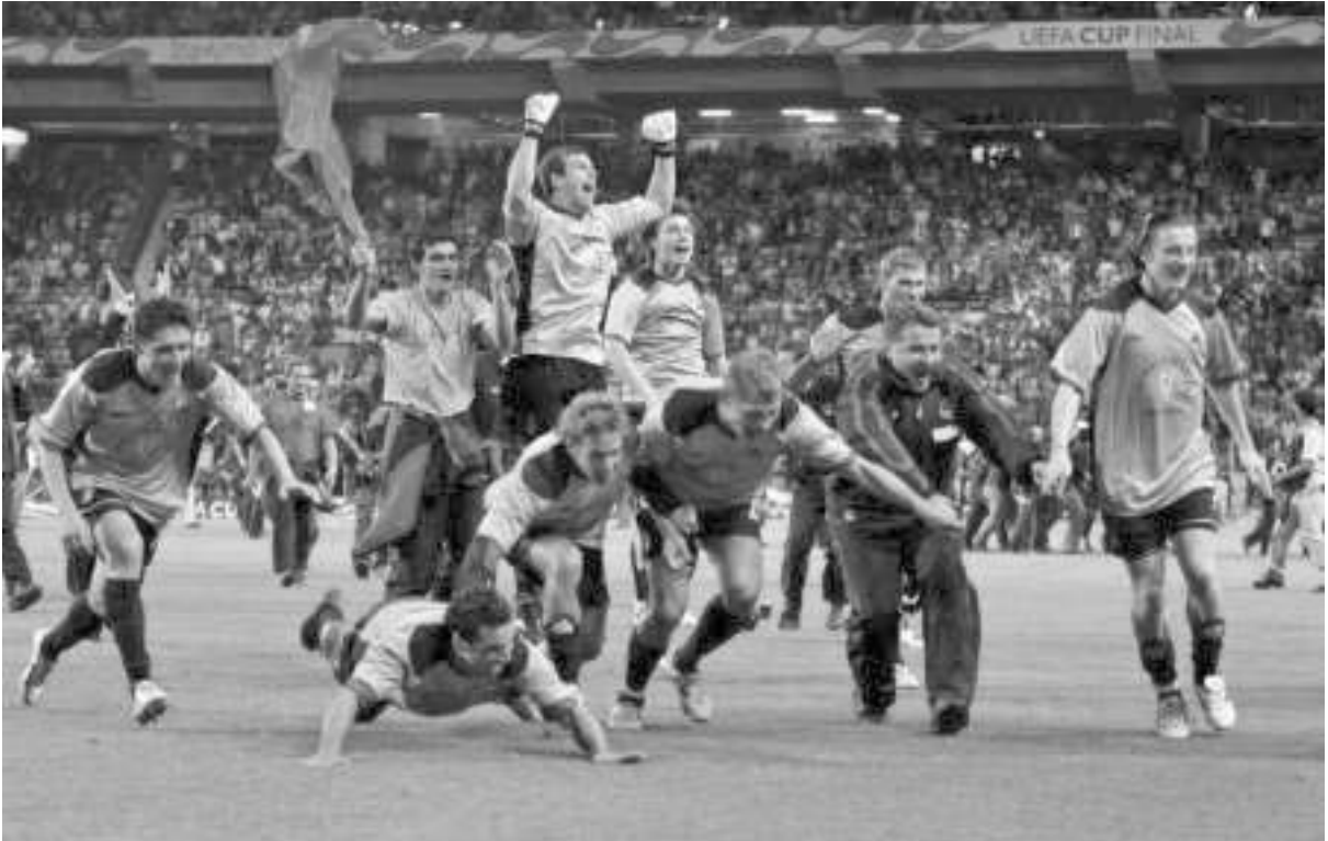
ცსკა-მ რუსეთისთვის ისტორიული გამარჯვება მოიპოვა

ფტი" წლიურად 10 მილიონი გირვანკა სტერლინგით აფინანსებს, პირველ რაიონულ კლუბში გახდა, რომელმაც ვერბოული ჯგუფი მოიგო. შეიძლება ითქვას, რომ ეს გამარჯვება მოგონის დონის დეგრადაციას უფრო ადსურებ, ვიდრე რუსული ფეხბურთის განვითარების კომპანია "სიზნე-