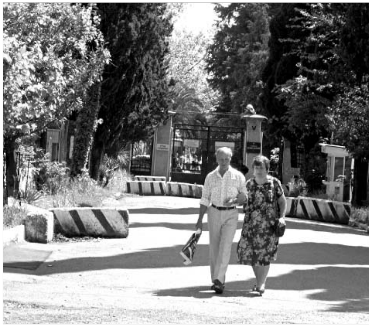
რუსები აფხაზური კურორტებიდან ადგილობრივ მოსახლეობას ერეკებიან. ახლა აფხაზური კურორტები სამხედრო ბლოკ-პოსტებს უფრო ჰგავს. ვიდრე დასასვენებელ სახლებს.