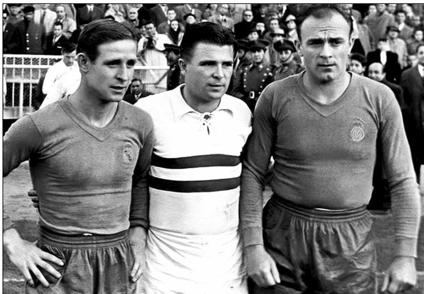
რაიმონ კობა (რეალი), ფერენც პუშკაში (ჰონვედი) და ალფრედო დი სტეფანო (რეალი)