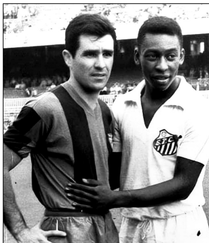
ევარისტო (ბარსელონა) და პელე (სანტოსი)