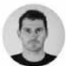
Iker Casillas @IkerCasillas

Espero que me respeten: soy gay. #felizdomingo