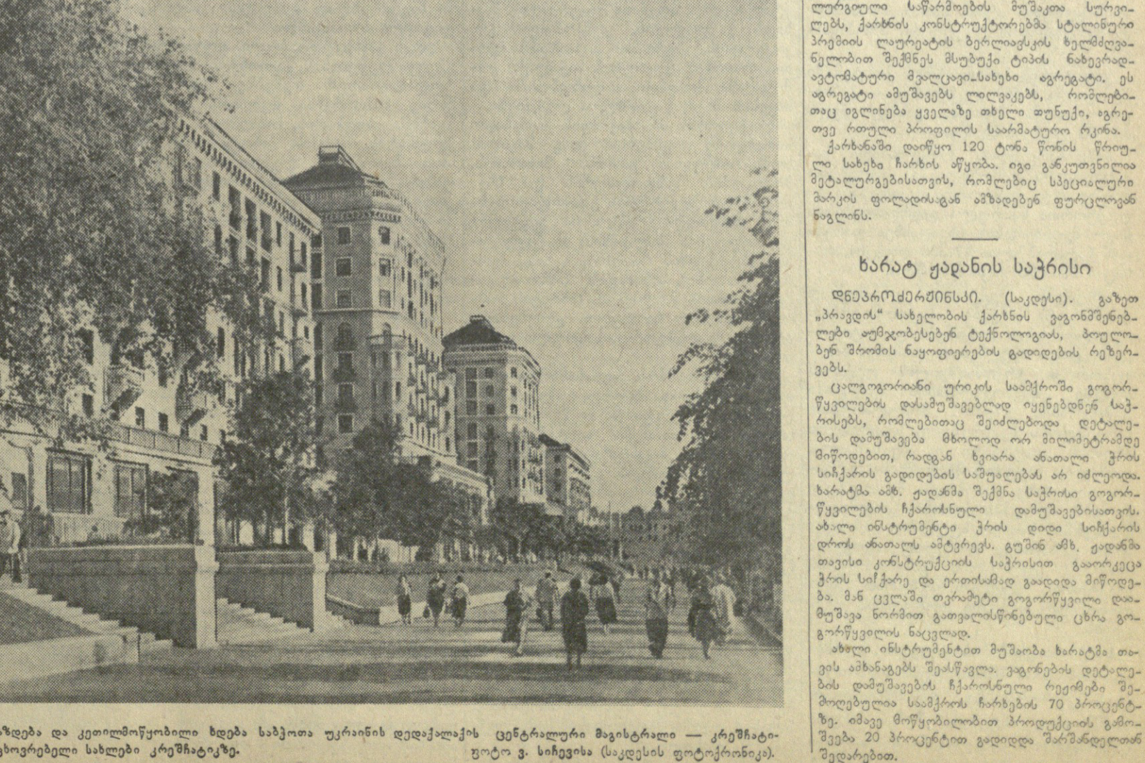
დიდი ოქტომბრის 37-ე წლისთავის აღსანიშნავად