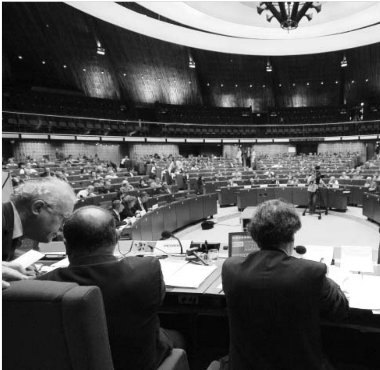
სტრასბურგში გუშინ ევროპის საბჭოს ადგილობრივი და რეგიონული ხელისუფალთა კონგრესის მეთორმეტე პლენარულ სესიონზე 46 სახელმწიფოს წარმომადგენლები. საქართველოში ადგილობრივი დემოკრატიის მდგომარეობაზე მსჯელობდნენ.