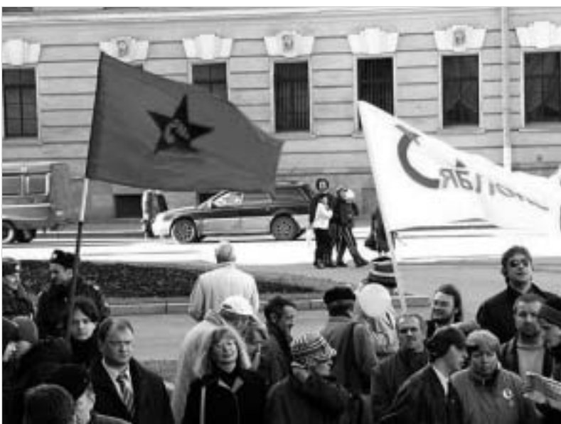
რა საერთო აქვთ ლიბერალურ "ახლოკოს"-სა და ნაციონალ-ბოლშევიკებს?

მართლაც, არ არსებობს პრაგმატული მიზეზი, რომელიც შეიძლება აიხსნას რუსეთის ხელისუფლების სისტემის კრიზისი (თუმცა, ასეთი მიზეზები შეიძლება გამოჩნდეს ეკონომიკური დაღმავლობის დროს). მაგრამ არსებობს კიდევ ერთი, არანაკლებ მნიშვნელოვანი