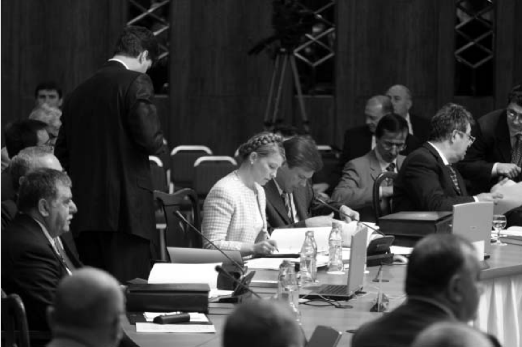
უკრაინაში ისევ როგორც საქართველომ მხოლოდ დოკუმენტების მცირე ნაწილს მოახერხა ხელი.

დღეს მთავრობების მეთაურთა გუშინდელი სამიტის ოფიციალური ნაწილი, რომელიც სასტუმრო "შერატონ მეტეხი პალასში" მიმდინარეობდა, რეკორდულად სწრაფი ტემპით წარიმართა და, დაახლოებით, ორ საათში დასრულდა, რის შემდეგაც დელეგაციათა თავკაცებმა მომზადებული დოკუმენტების მოწოდება დაიწყო. ე.წ. პრემიერ-სამიტზე, ძირითადად, ეკონომიკური თანამშრომლობის საკითხები იხილებოდა. ამის მიუხედავად, გუშინ ერთსულსა და სამხრეთ-დასავლეთის რეგიონებში, სტუმრების და მასპინძლების იძულებული გახდნენ, ხმაალა განეცხადებინათ, რომ დამოუკიდებელ სახელმწიფოთა თანამშრომლობის საკმარისი და კოორდინაცია დასახეურ და ვასაუფლებლებელია და ერთმანეთს უკეთესი მომავლის იმედით დამოკიდებულნი.