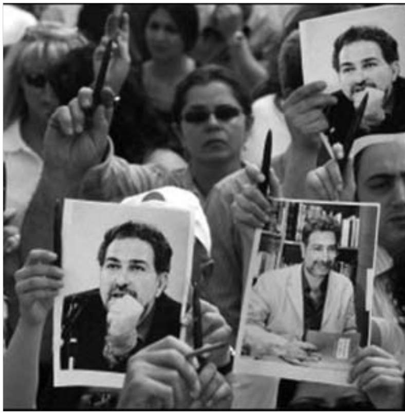
ლიბანელი ჟურნალისტის მკვლელობის ოპოზიციონერთა საპროტესტო აქციები მოჰყვა.

ოპოზიციის ლიდერებმა ლიბანის უშიშროების სამსახურებს მკვლელობაში მონაწილეობაში დასდეს ბრალი და მათ, ისევე, როგორც ხელისუფლების სხვა წარმომადგენლებს, კასირის დაკრძალვაზე დასწრება არ ურჩიეს.