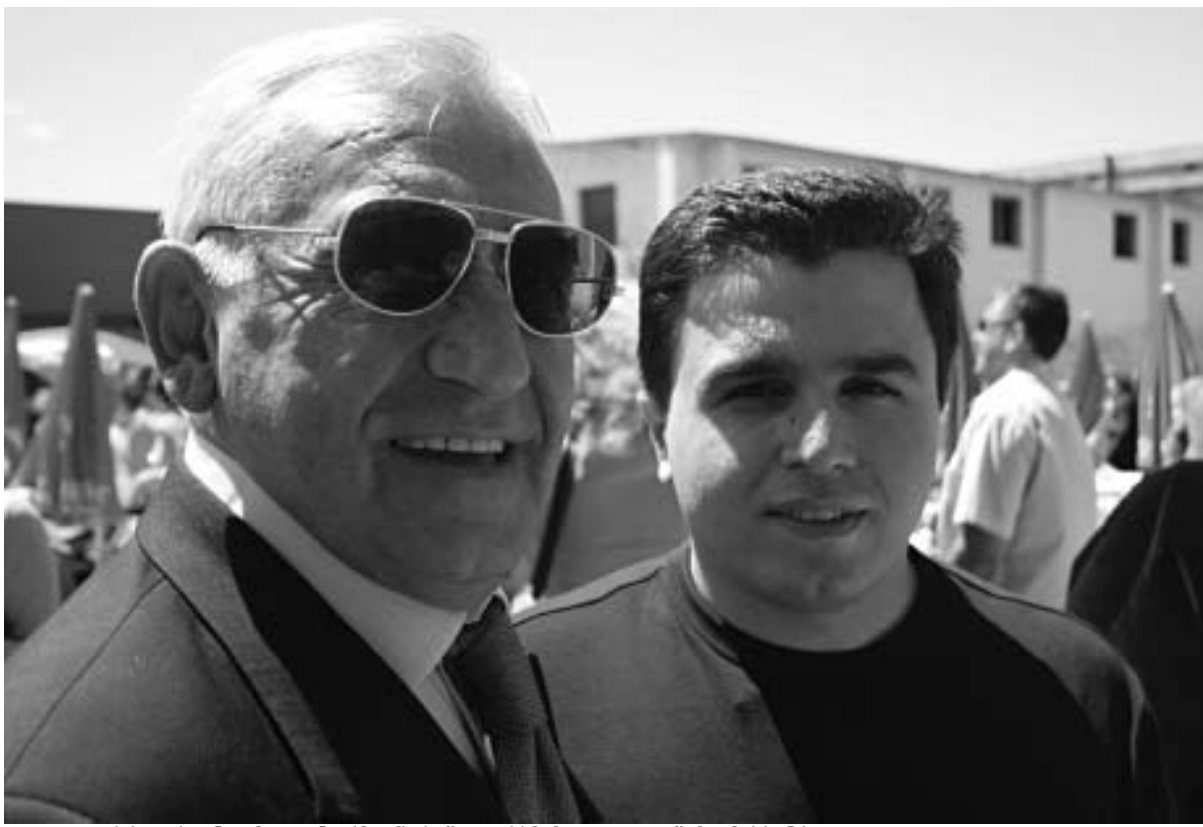
ფოლკლორის ეროვნულმა ცენტრმა “სუბივილებს” “კოკა-კოლაში” უმასპინძლა.