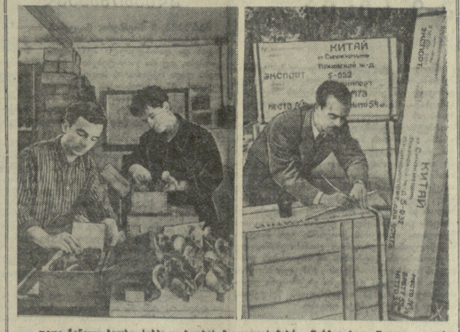
დღი ჩინელი ხალხი, საბჭოთა ხალხის მავალითაშურ, წარმატებით შედეგა თავისი ქვეყნის მდინარეთა მდინარე რესურსების გამოყენების საინჟინერო, ნაოსნობის განვითარებაში...