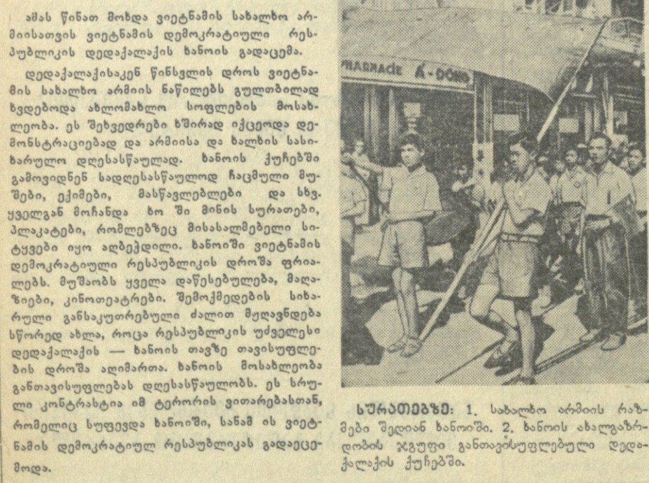
სწრაფმობა: 1. სახალხო არმიის რაზმი შედის ხანოში. 2. ხანოს ახალგაზრდობის გუნდი განათარბული დღე-ქალაქის ქუჩებში.