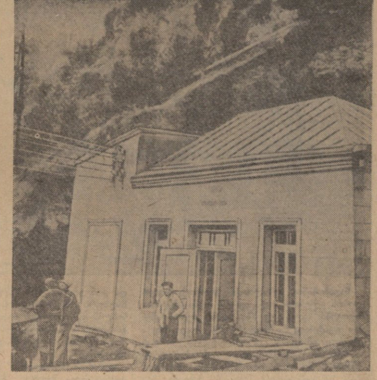
სწრაფი ტემპით ვითარდება საბჭოთა აჭარის მრეწველობა და სოფლის მეურნეობა. სწრაფი ტემპით ვითარდება საბჭოთა აჭარის მრეწველობა და სოფლის მეურნეობა. სწრაფი ტემპით ვითარდება საბჭოთა აჭარის მრეწველობა და სოფლის მეურნეობა. სწრაფი ტემპით ვითარდება საბჭოთა აჭარის მრეწველობა და სოფლის მეურნეობა.