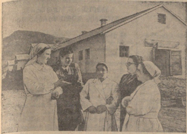
უკრაინელი სტუმრები ესაუბრებიან ბათუმის რაიონის კოლმეურნეობის მეცხოველეობის ფერმის მუშაებს.

ჩვენი რესპუბლიკის მშრომლები უდავლა აღფრთოვანებით შეხვდნენ საბჭოთა კავშირის კომუნისტური პარტიის ცენტრალური კომიტეტის იანვრის პლენუმის და სსრ კავშირის უმაღლესი საბჭოს მორეზინის ისტორიულ დაჯილდოებას. განსაკუთრებით დიდი ამოცანაა დასახული საზოგადოებრივი მეცხოველეობის აღმაშენებლის, უახლესი წლების განმავლობაში უნდა მივაღწიოთ მეცხოველეობის განვითარების ისეთ დონეს, რომელიც საშუალებას მოგვცემს უზრუნველყოთ ყველას პროდუქტზე მოხალისობისა და ნედლეულზე მრავალფეროვნების მართონების დამკვიდრება.