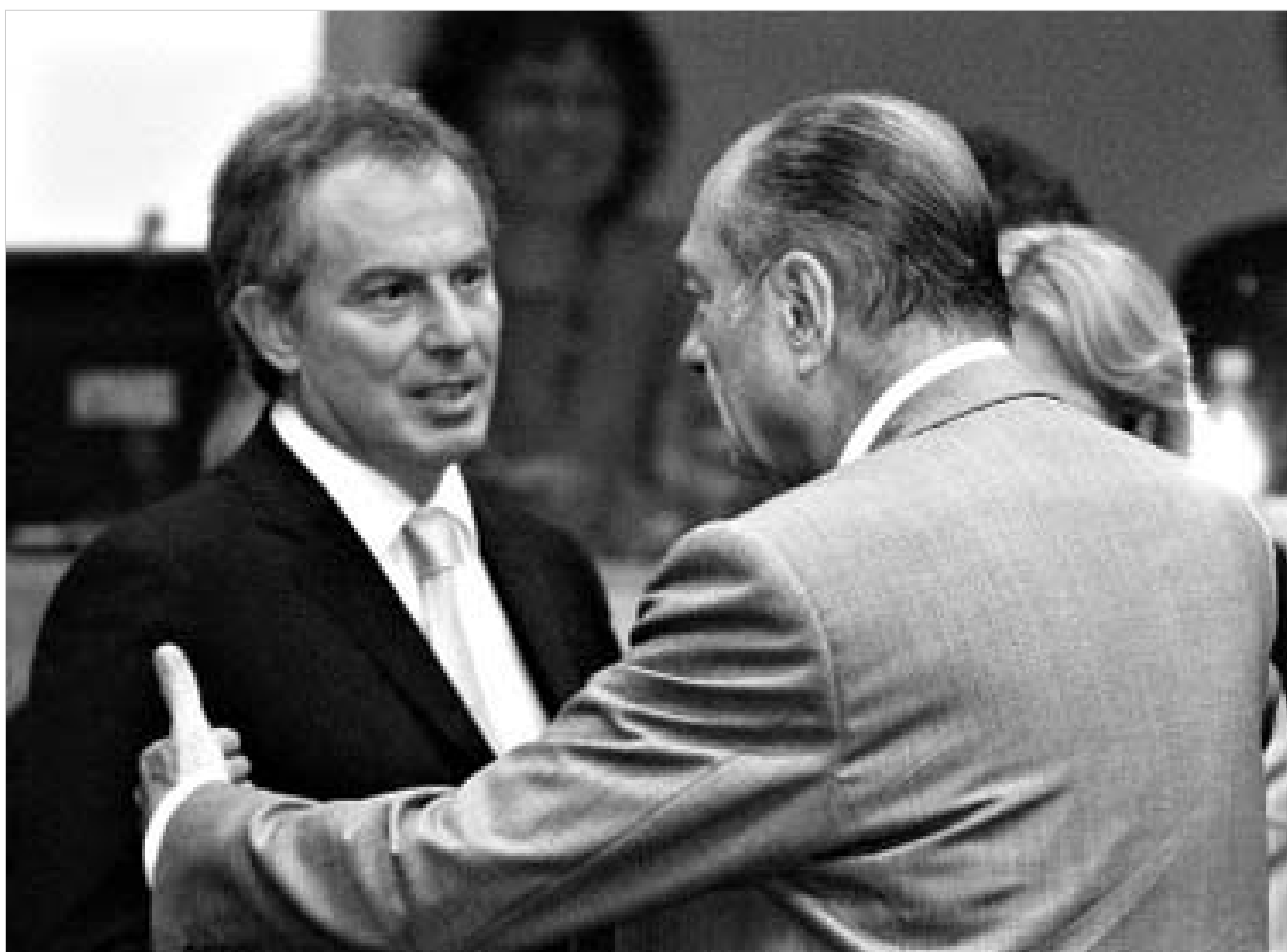
ყველაზე მძიმე საუბარი, საგარეო დოკუმენტის მომზადება და ტონის ბერის შორის შედეგა.