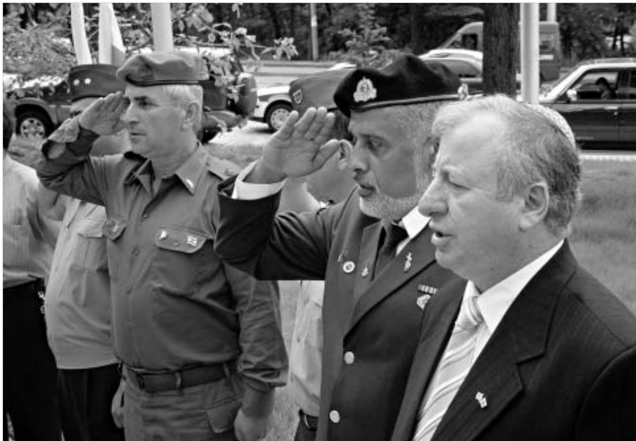
ებრაელი სამხედროები პატივს მიაგებენ საქართველოს მთლიანობისთვის დაღუპულ მემორიალს.