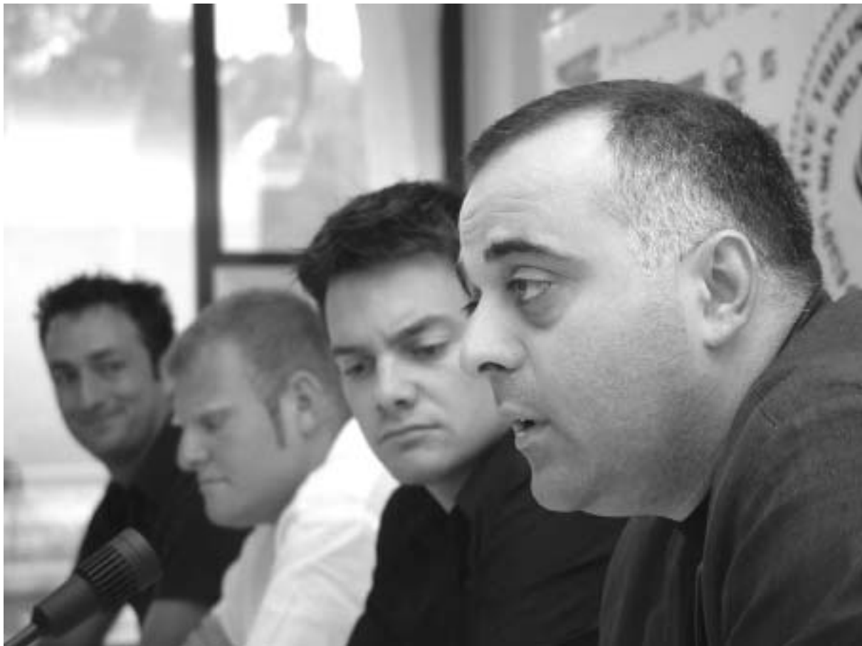
"ლოკომოტივა" ბარსელონასთან მჭიდრო ურთიერთობა დაამყარა.

"ჩემი კლუბი მთელ მსოფლიოში ეძებს საფეხბურთო ტალანტებს. ბავშვთა სკოლა გვაქვს გახსნილი ესპანეთის სხვადასხვა რეგიონში, მექსიკაში, მალაიზიაში... საქართველო "ბარსელონას" ტალანტების მოძიების პროგრამაში სექტემბრიდან ჩაერთვება. ურთიერთობა გვექნება საფეხბურთო კლუბ "ლოკომოტივთან" და მასთან არსებულ დავით ყიფიანის სახელობის სპორტსკოლასთან, რომელიც დაიწყო მუშაობა.