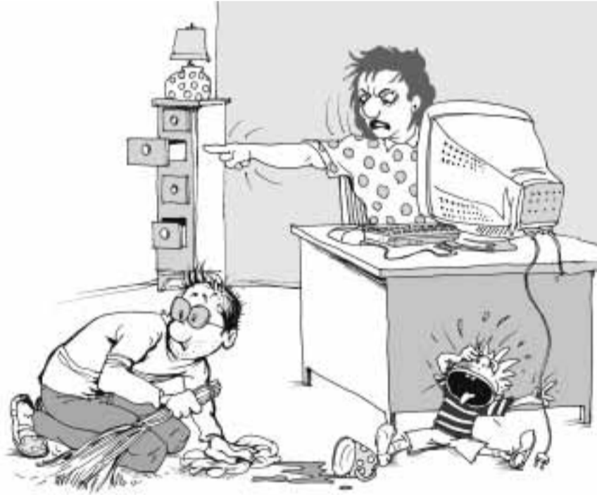
ბაგას აპოლიანოვიჩი ნახატი

იმას, რასაც ინფორმაციის სხვა საშუალებები: ელიტურ ჭორებს - ვის, ვინ, სად, რას, როგორ, რატომ... ინფორმაციას მალაზიების შესახებ, კულინარულ რეცეპტებს და ყველაზე მთავარ რეცეპტებს: როგორ გაიარონ უმოკლესი გზა მანქანების გულისკენ; როგორ შეინარჩუნონ ახალგაზრდობა, როგორ ჩაიცვან, რომ არ დაგეყნოთ ასაკი, როგორ მიასხერონ, რომ იყვენენ მუდამ თანამედროვე, საინტერესო, მიმზიდველი; როგორი სიყვარული იცოდნენ ადრე კაცებმა და როგორ დაუკარგეს მათ აღმადგენა თანამედროვე ქალებმა... ერთი სიტყვით, ინტერნეტში ყველაფერია, თუ როგორ უნდა იცხოვრონ ქალებმა და რა ზომის და ფერის კოჭები უგორონ კაცებს.