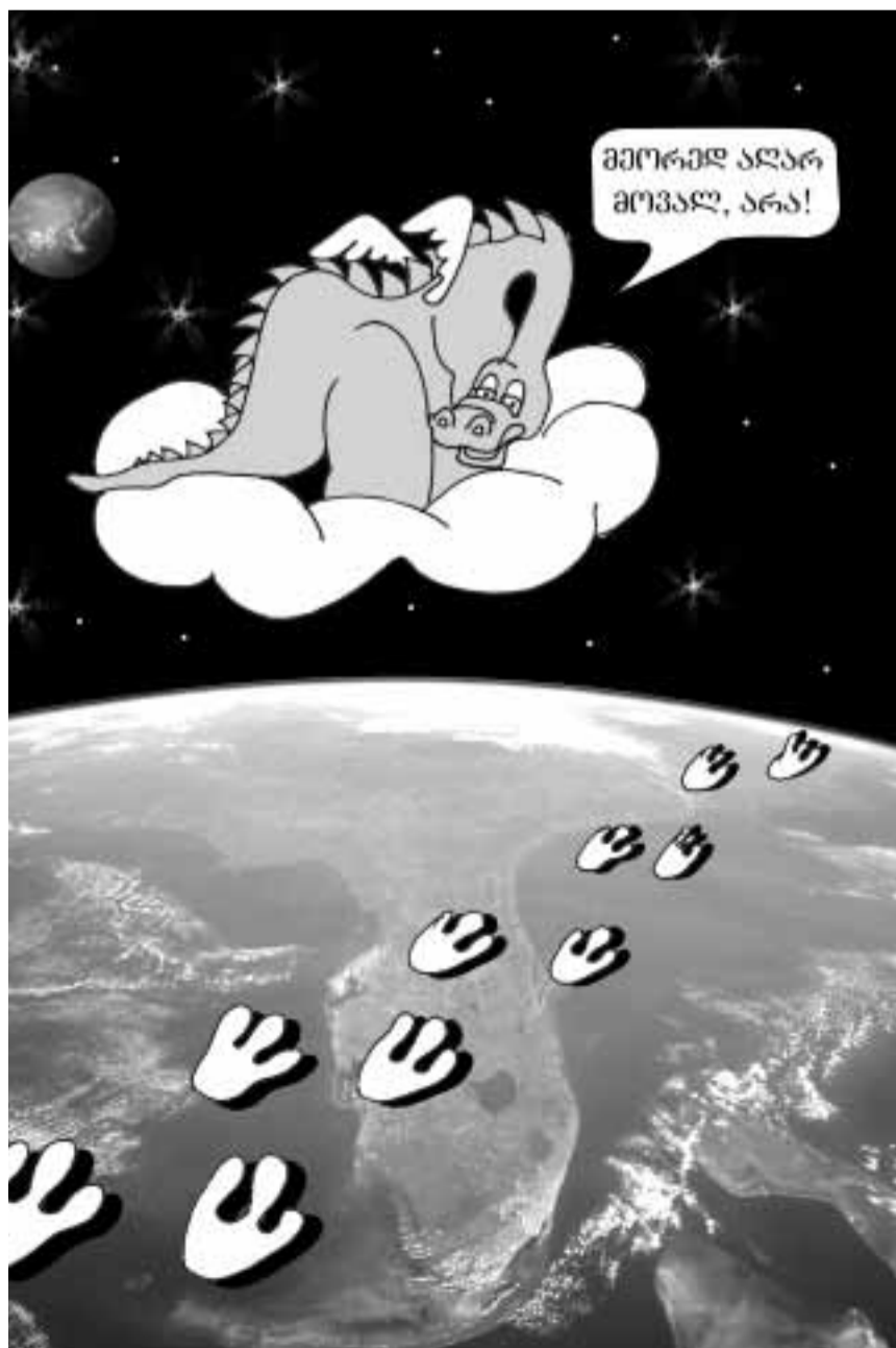
ბაგას აპოლიანოვიჩი ნახატი

უნიკალური აღმოჩენა, რომლითაც ქართველი მეცნიერები ათეულობით წელია ამავობენ, შესაძლოა, განადგურდეს