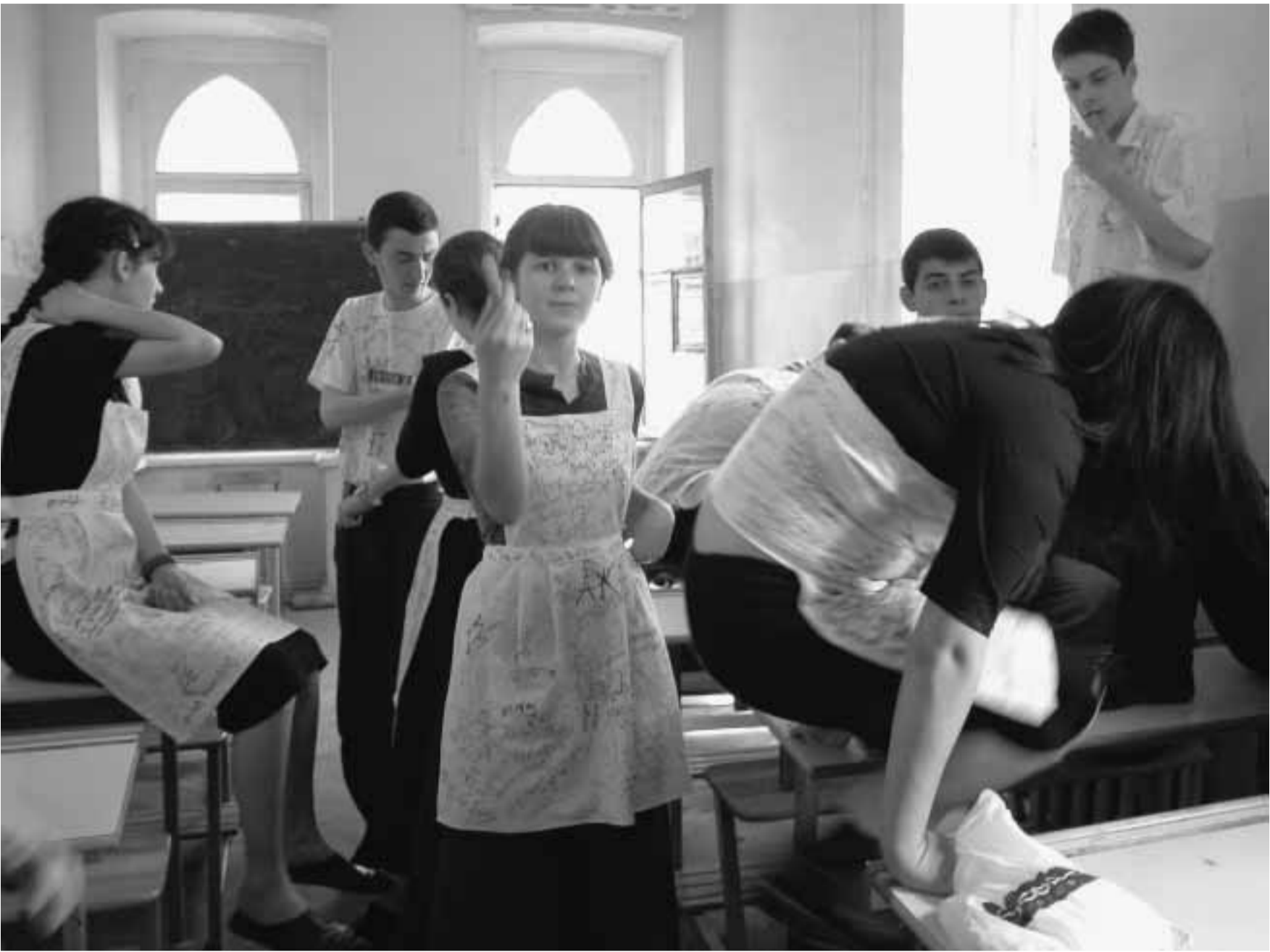
ახლა კი ისინი თანაურად მიკრობასს

ახალი გამოკვლევები ე.წ. არამომავლენებითი შეიარაღების შემუშავების დიდი პროგრამის ფარგლებში ხორციელდება. სწორედ, ამ პროგრამით ფინანსდება ვალუის შემცველი ქიმიური იარაღის გამოგონება. საბოლოო პრეპარატი ადამიანის ფსიქიკაზე იმოქმედებს და მას წინააღმდეგობის გაწევის უნარს დაუკარგავს. მართალია, ამერიკელებთან მჭიდროდ თანამშრომლობენ ბრიტანელები, მაგრამ ისინი ფრთხილდებიან. ქიმიური და ბაქტერიოლოგიური იარაღის გამოყენებას ხომ 1991 წლის კონვენცია კრძალავს.