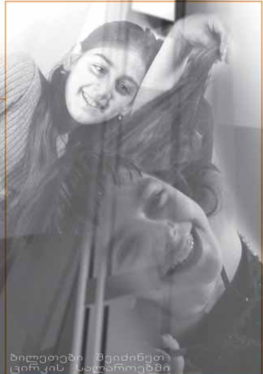
ბილეთები შეიძინეთ ცირკის საბავშვო