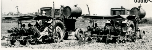
მაკანის მანქანების აგება

ხეთნაღის პიკავე წელს მაკანაღის ეთარაუთუკანთა ქარხანა-საგჭოთა მუკანაღის კოლექცივი გარეამუკავეს 1.500 შონაზე მუკ გეანს, 400 შონა აკანის მენაენა მესას, 37 შონა კანანლიქარ პარს.