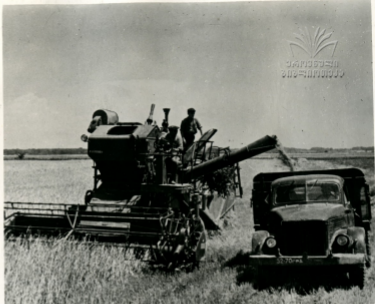
ქარს აღება სოფელ ჰობანში

აღსკუბილიაში ქარის შაჲ ჰიკავილი ღიჩყეს სიღნაღის აგიონის სოფელ ზიგბანის შხომელაგბე. მის ჰიკავილი ღიჩს შხიჩი განღა ახალგაზრდა მუჲანიზაციი გივი ღათიგაშვილი.