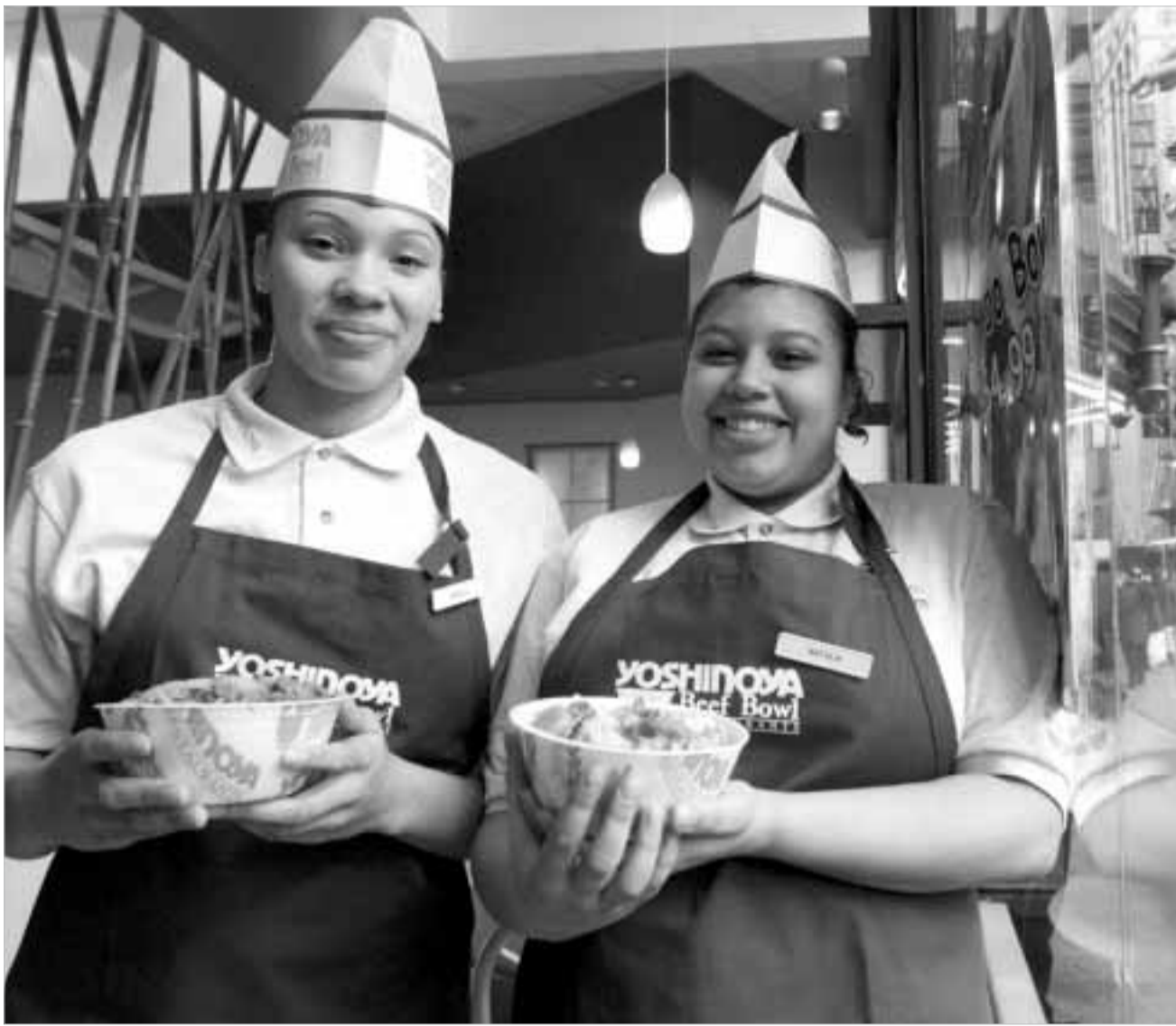
სადარ ჰაჰადა და მიხარო ორიტი

მატიას დაწყებამდე ჯერ კიდევ დრო გვაქვს, სადილობას მოვასწარმოოთ. „სუში ისაუდა“, „საკა გურა“, „კურუმა ზუში“ და კიდევ ათასი სხვა დასახელება აქამდე შესაძლოა, გსმენიათ კიდევ. მაგრამ დღეს მაინც განსაკუთრებული სადილი გვლით – იაპონური სამზარეულო იაპონიაში. ეს სულ სხვა გარემოა, რომელიც არაფრით ჰგავს ამერიკულ ან ევროპულ კონტექსტში გადასხვავებულ იაპონურ რესტორანს. არა უშავს, თუ საჩემპიონატოდ ტოკიოში ჩასულს, წესები ბოლომდე არ გესმით. სახელდახელო გაკვეთილი და დაუნერული წესები თქვენთვის: ყოველი იაპონელი გურმანი და კერძის მომზადების პროცესი მისთვის წმინდა რიტუალს ჰგავს. საუკუნეების წინ ბუდისტების მიერ ხორციელებულ დაწესებულება „სანძიციაში“ იაპონური სამზარეულო სიროზე აგებული, ვეგეტარიანული კერძებით გააშვილდა. თუმცა, ის „შონაისავა“ სამზარეულოებისგან არა იმდენად გემოთი, არამედ გარეგნობით განსხვავდება. სულ ერთია რა იქნება ეს, საკე თუ თქვენთვის უფრო „შობოლოური“ მანგოს წვენი – როცა საზოგადოებრივი