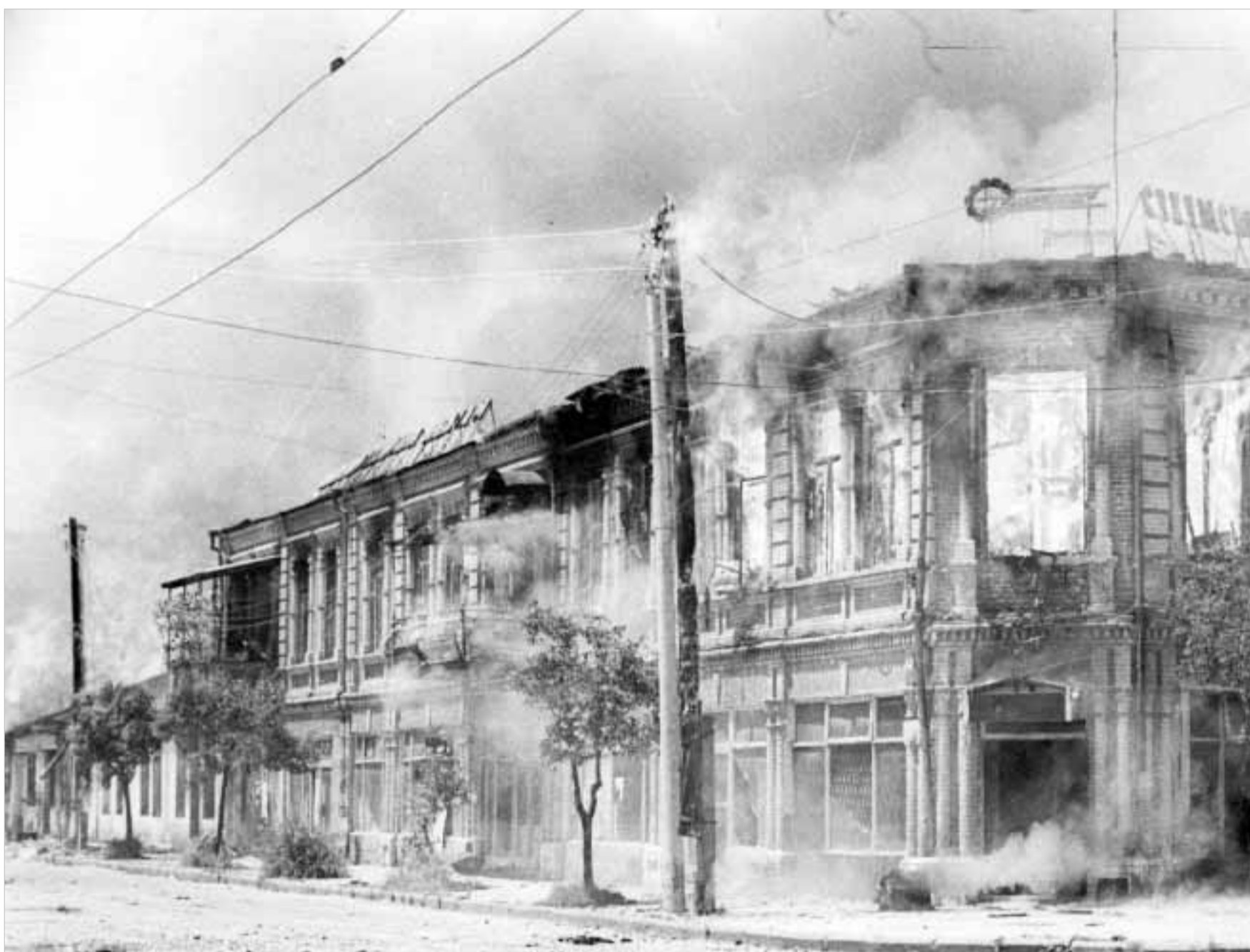
სოხუმი, 1998 წელი. რუსები ამ პერიოდში ყოველს ვერ რისკავენ