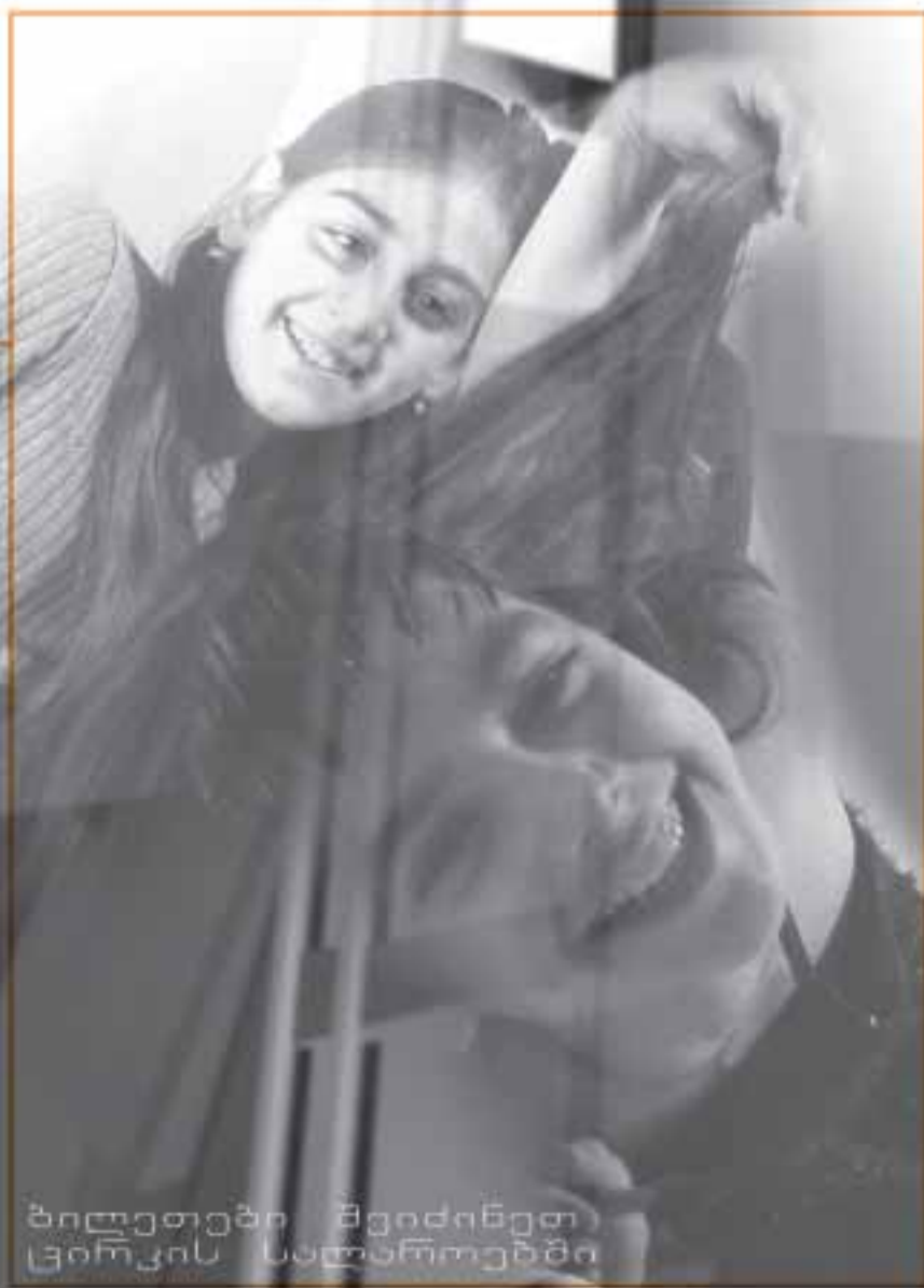
ბილეთები შეიძინეთ ცირკის საბაროებში