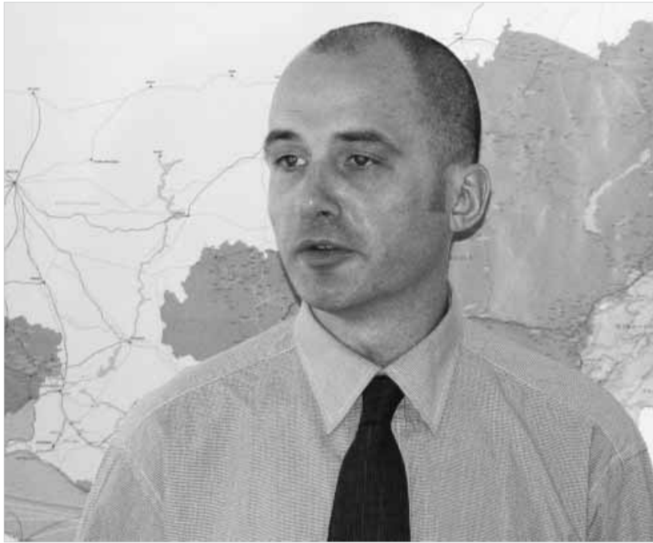
ჯორჯ მაკდონელი: „ტასისის“ წინასწარ ინვესტიციური კვლევებს დააფინანსებს.

საბჭოთა პერიოდის ინდუსტრიალიზაციამ მიმედი დალი დასავსა ამ ქვეყნის გარემოს. მისი დაბინძურება საბჭოთა კავშირის დაშლის შემდეგაც არ შეწყვეტილა. ევროპული ექსპერტების შეფასებით, აღმოსავლეთ ევროპის ქვეყნებში გარემოს დაბინძურებასთან დაკავშირებული პრობლემების მოგვარებას, დაახლოებით, 122 მლრდ. ევრო სჭირდება, დას-ს ქვეყნებში კი, გაცილებით მეტი. სამუხარობა, მაგრამ ფაქტია, რომ ეკოლოგიური პრობლემების მოსაგვარებლად გამოხსნილი ინვესტიციები ამ ქვეყნებში ძალიან მცირე მოცულობით შემოდის. მაკდონელის თქმით, ამ დანაკლისის შეესაბამება დას-ს ქვეყნებს, მათ შორის საქართველოსაც, ნაწილობრივ გრანტების, ნაწილობრივ კი, საკმაოდ „ძვირი“ კომერციული კაპიტალის მეშვეობით მოუწევს. ევროკავშირი და მისი ტექნიკური დახმარების პროგრამა „ტასისის“ ამ ქვეყნებს ერთობლივი გარემოსდაცვითი პროგრამის JEP მეშვეობით ეხმარებიან გარემოს გაჯანსაღების კენ მმართული პროექტებისთვის აუცილებელი მოსამზადებელი კვლევების გახორციელებაში, რაც, შემდგომ ამ პროექტების მსხვილი დონორებისთვის წარდგენის საშუალებას