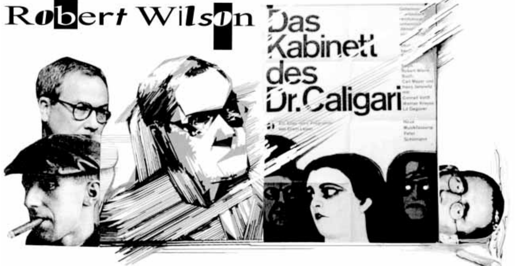
ილია კარბალიანი კოლაჟი

ამ კითხვებს, ალბათ, თავად ვილსონიც ვერ უპასუხებდა, რადგან მის-