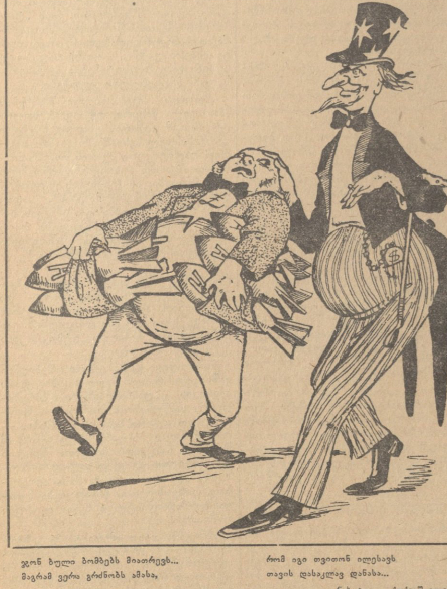
გონ ბული ბობილის მიათრებს... მაგრამ ვერა გრანობის ამხა...

ასახლი ფიგურები. ასახლი ფიგურები ასახლი ფიგურები ასახლი ფიგურები.