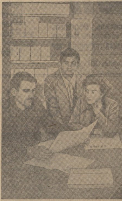
ლაგანურების მიმოხილვაში ხშირად აკრებიან ახალგაზრდა მშენებლებს და ინტერესთა კონსულტაციას ახალ ურბანულ-გაყვანილობის სმარტისთვის: ახალგაზრდების ერთი ჯგუფი მიმოხილვაში.

ჩვენთან ბევრი რამ გაკეთდა პარტიული მდივანის მუშაობის დასახელება, რომლის მიხედვითაც კომუნისტური ცენტრის მდივანი უნდა იყოს, რომელიც უნდა იყოს კომუნისტური ცენტრის მდივანი. კვლევა აჩვენებს, რომლებიც მეცხოველეობის ფერმის მუშაობის დასახელება, პარტიული მდივანის მუშაობის დასახელება, რომლის მიხედვითაც კომუნისტური ცენტრის მდივანი უნდა იყოს, რომელიც უნდა იყოს კომუნისტური ცენტრის მდივანი.