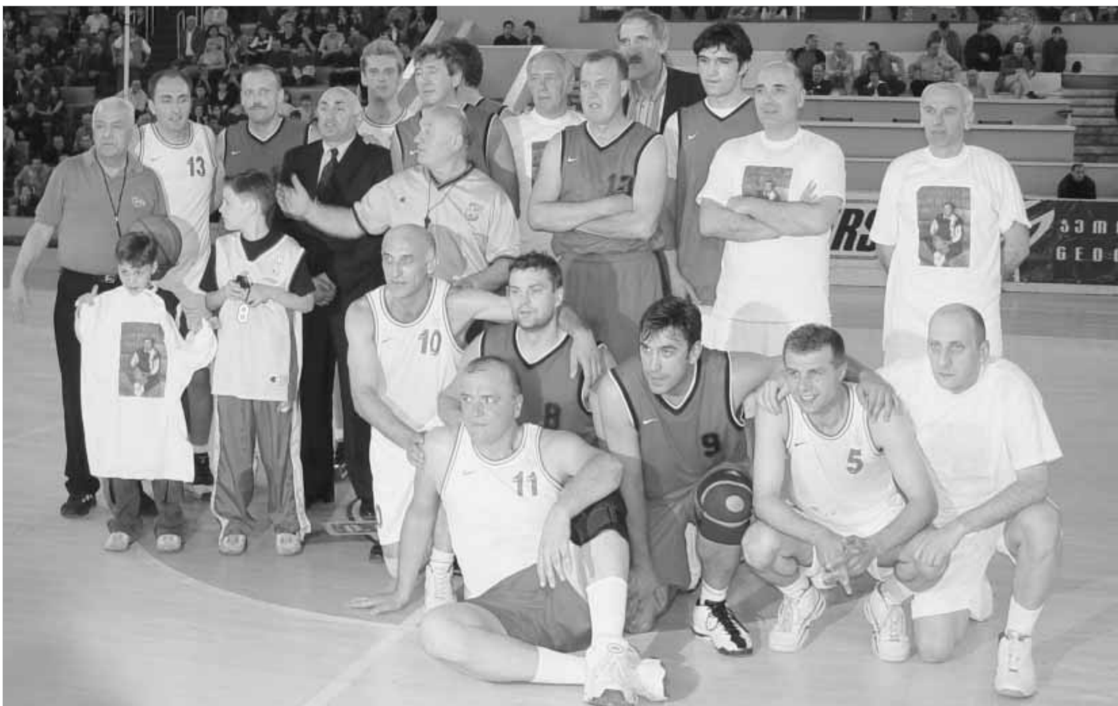
მონიშნა აბაშიანი ფოტო

თბილისის სპორტის სასახლეში შეკრებილმა ოთხი ათასამდე ადამიანმა სპორტიდან გაცილა ქართველი კალათბურთელი, მსოფლიოს ჩემპიონი ნიკოლოზ დერიუგინი. საღამო, რომელიც ქართველმა მომღერლებმაც და-