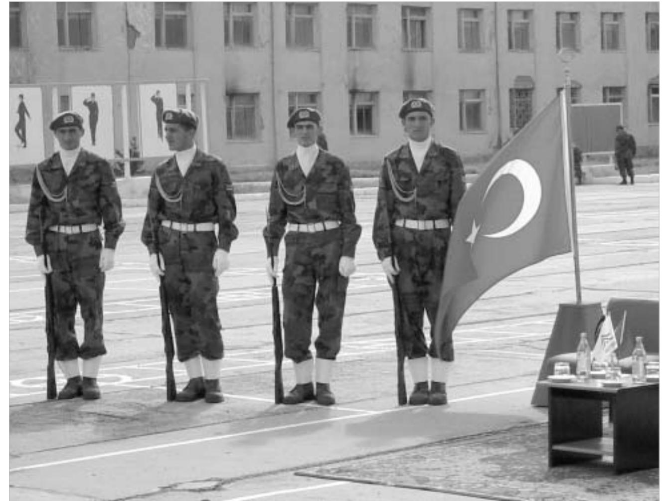
ვაზიანის ახლადგარემონტებული ბაზა

მთავარია, რომ თურქეთს წლიდან წლამდე არ უქრება საქართველოში ფულის ხარჯვის სურვილი. ჩვენ კი, ცხადია, კვლავაც მზად ვართ, ავითვისოთ ნებისმიერი თანხა, რომელსაც "გვიფეშაშებენ". არც ვალში დავგრებით - ორდენები ყველას ეყოფა.