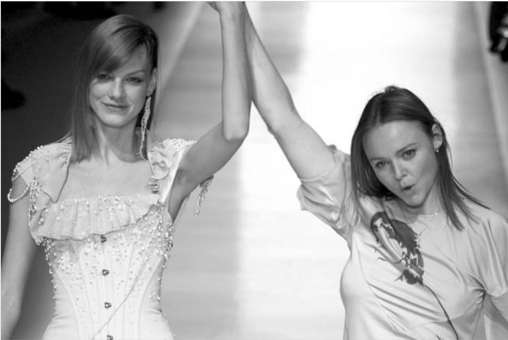
გუშინ შედგა პოლ მაკარტნისა და ჰითერ მილზის ქორწილი. მიუხედავად იმისა, რომ ჰითერის გერი, 30 წლის სტელა მაკარტნი მალაღი მოდის სამყაროში მიღებული სახელია, პატარაძალ ცერემონიაზე მის მიერ შექმნილი კაბა არ ეცემა. პოლ მაკარტნის განმარტებით, ეს სულაც არ ნიშნავს, რომ მის შვილსა და ცოლს შორის დამოკიდებულება დაძაბულია: "ჰითერს, უბრალოდ, თავისი დიზაინერები ჰყავს".