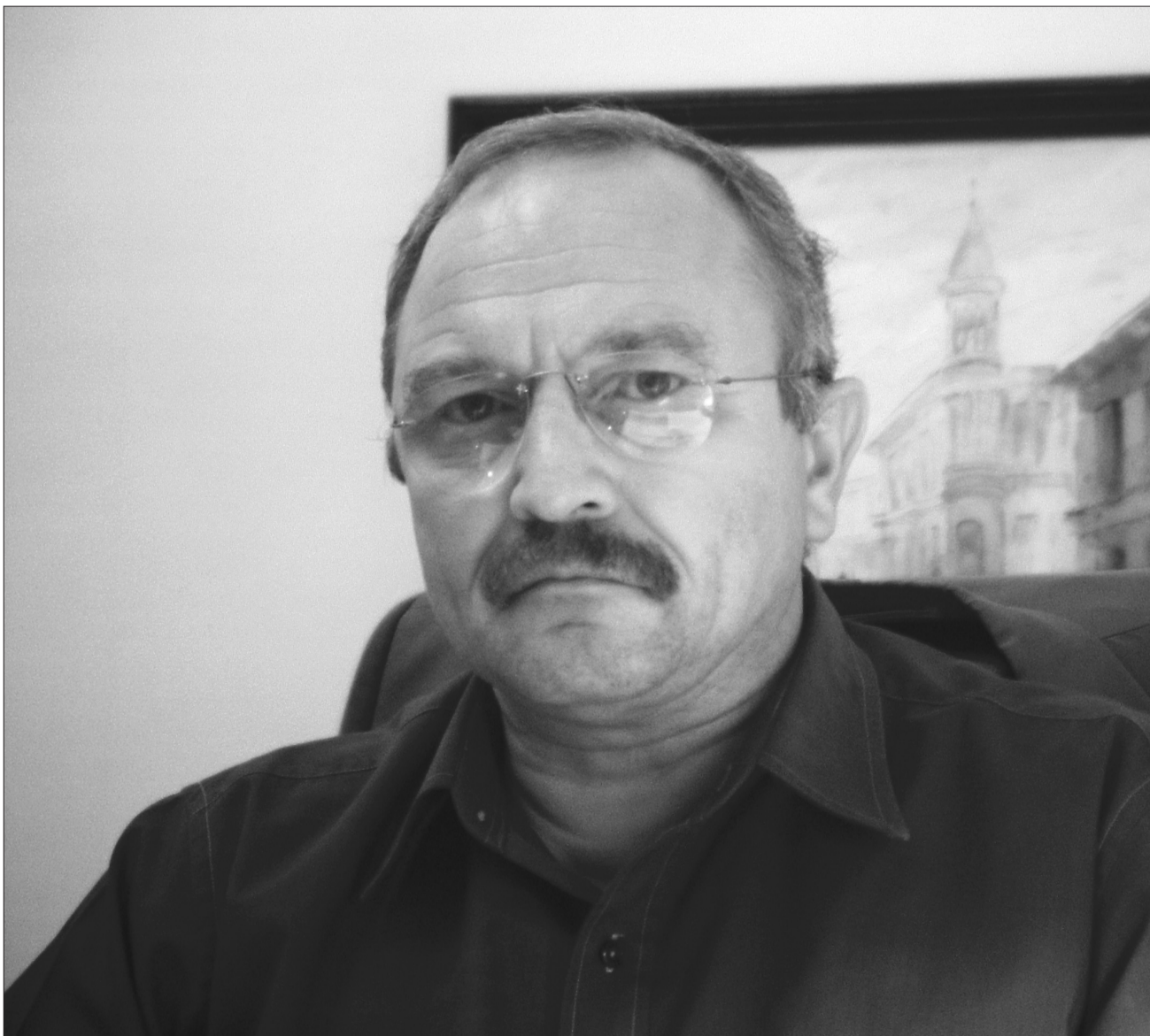
მამია ადამიასთან ერთად

მიუხედავად იმისა, რომ რევან ადამია ზურაბ ჟვანიას გუნდის წევრად მოიაზრება, ამ გუნდს კი ბოლო პერიოდში პოლიტიკურ ასპარეზზე მრავალი პრობლემა შეექმნა, თითქმის ყველა - მომხრეებზე და ოპონენტებზე - ხაზგასმით აღინიშნება ელჩობის კანდიდატის დადებითი პიროვნული თვისებები, საქმის ცოდნა და მისი კეთების უნარი, მაღალ კვალიფიკაცია ... და მაინც, შეიძლება ვიგარაუდოთ, რომ პარლამენტში წარმოდგენილი ზოგიერთი ძალა ყოველნაირად შეეცდება, ხელი შეუშალოს ნიუ-იორკში რევან ადამიას გამგზავრებას.