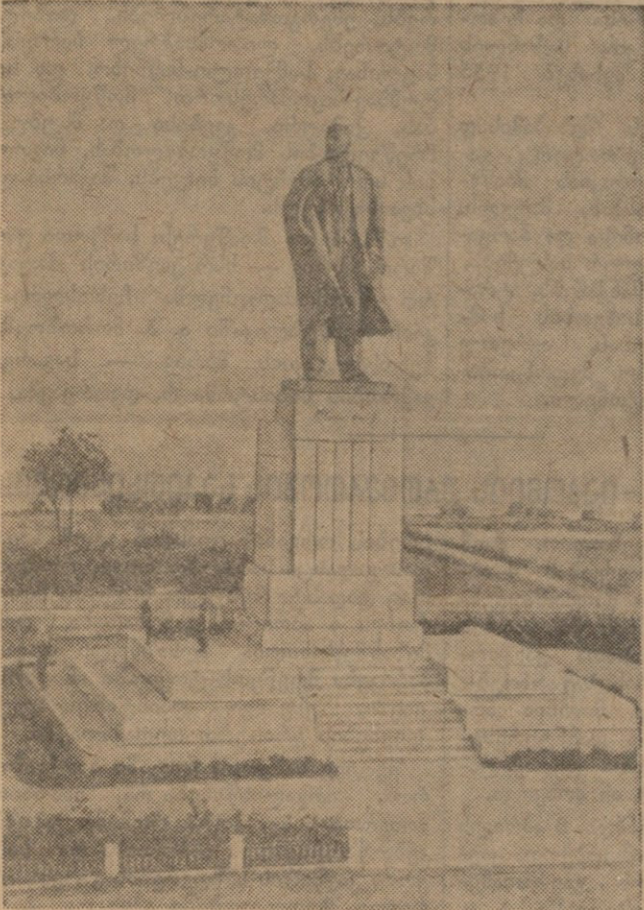
ვ. ი. ლენინის ძველი ულიანოვსკი ლენინის მოედანზე.