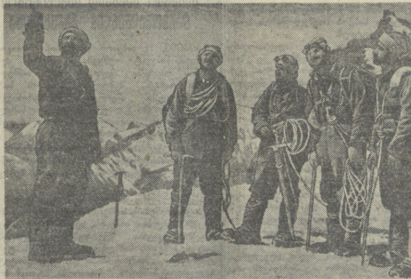
თბილისის ლენინის ოლქის კინონარკვევი მამაც ალბინისტებზე. მამაც ალბინისტების კინონარკვევი...