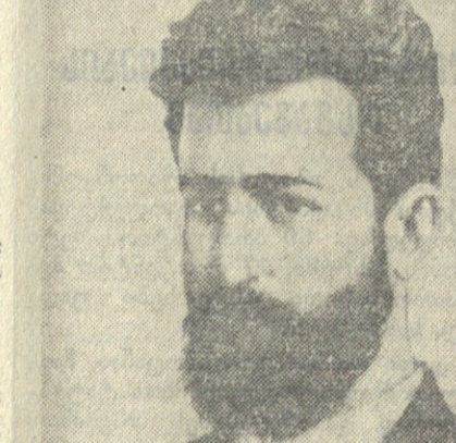
ლაღი კაცობის დასახელები არ კარგავს დროს...