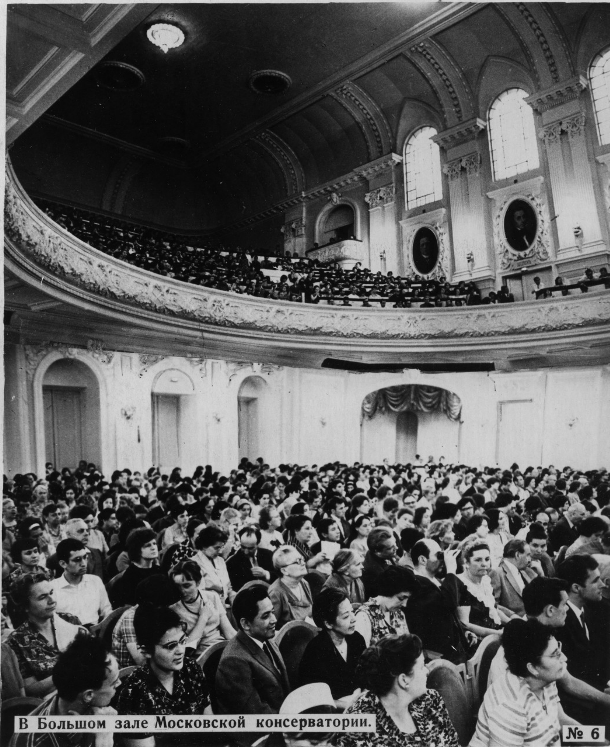
В Большом зале Московской консерватории.

Великий Октябрь открыл широкие возможности для подъема жизненного уровня народа. Трудящиеся получили право на труд, на образование, на отдых.