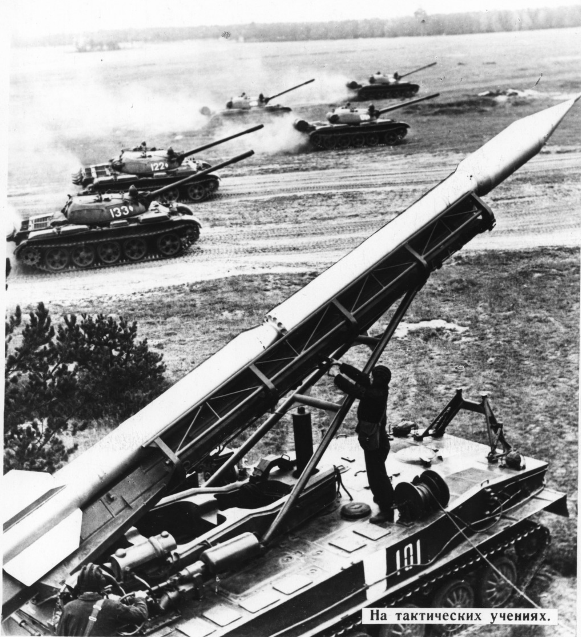
На тактических учениях.

Вот уже почти полвека Советские Вооруженные Силы зорко стоят на страже нашей Родины.