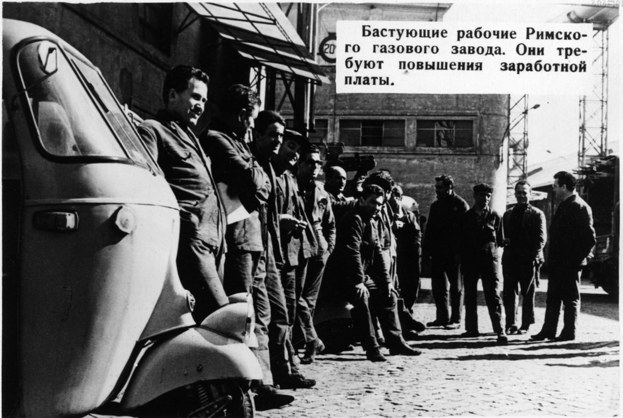
Бастующие рабочие Римско-го газового завода. Они требуют повышения заработной платы.