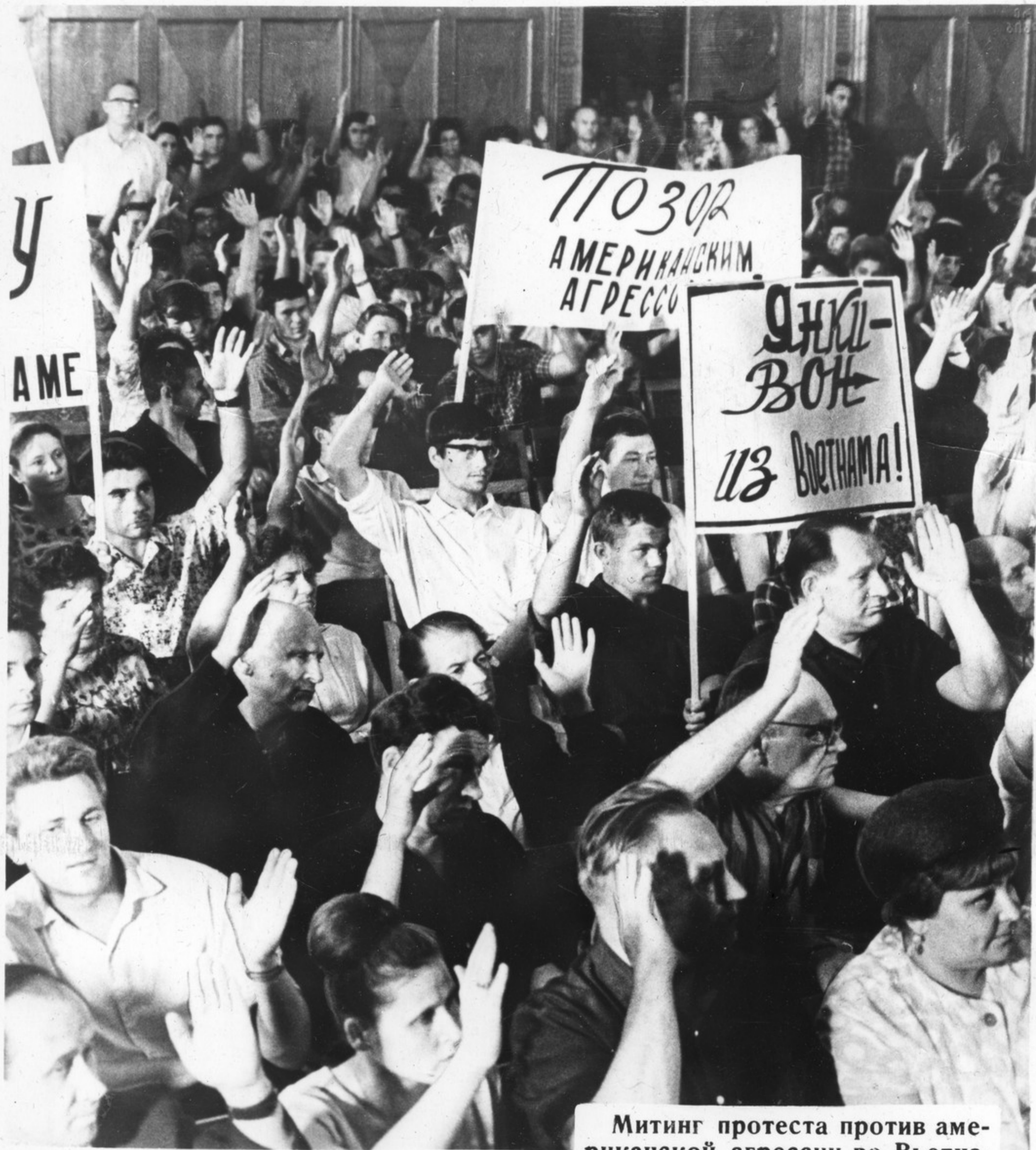
Митинг протеста против американской агрессии во Вьетнаме в Институте металлургии Академии наук СССР.

Советский народ ведет активную борьбу против агрессивных действий империалистов США.