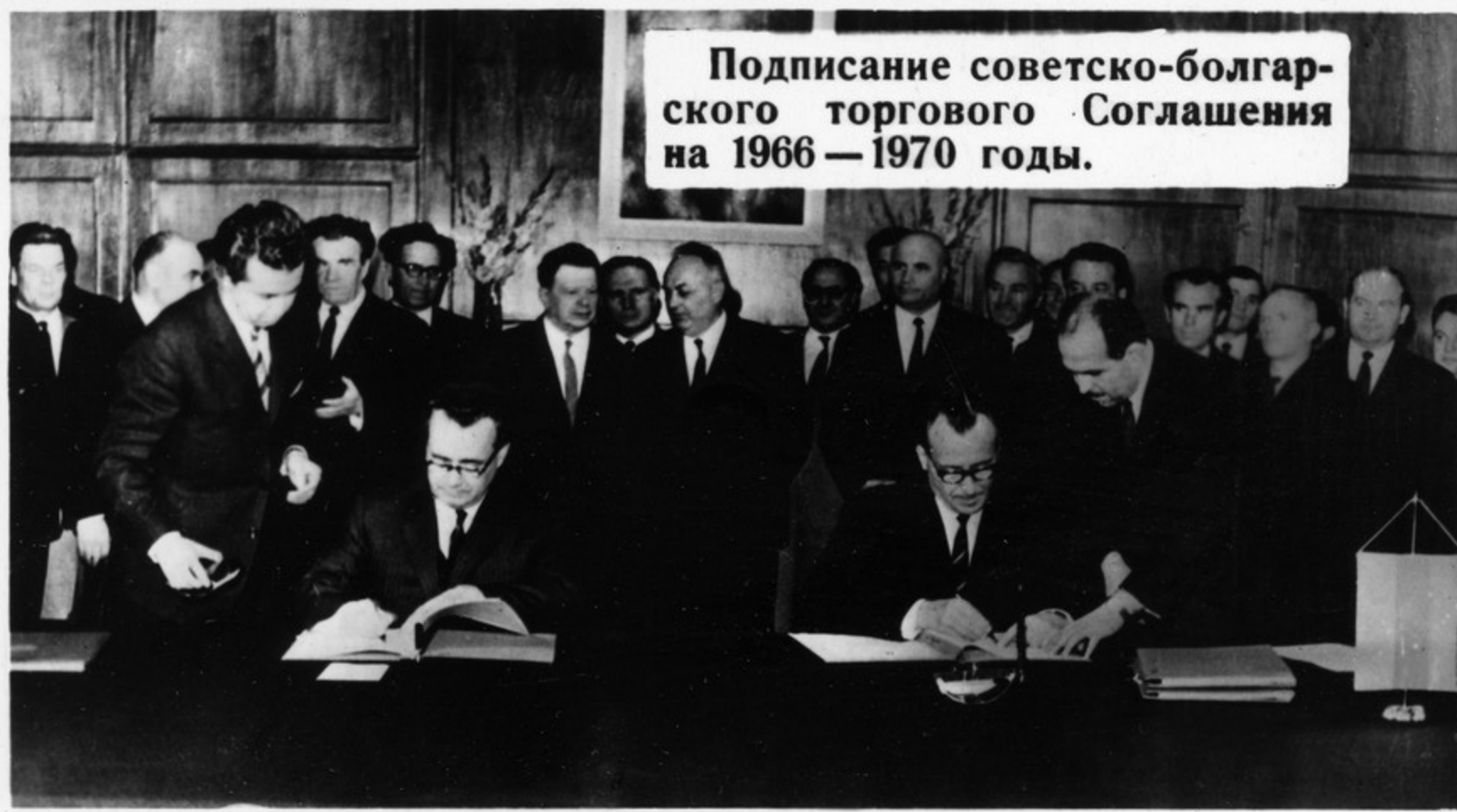
Подписание советско-болгарского торгового Соглашения на 1966—1970 годы.