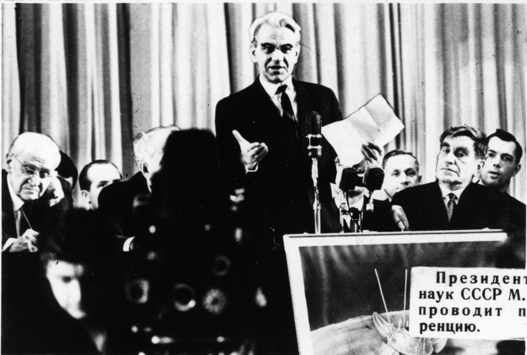
Президент Академии наук СССР М. В. Келдыш проводит прессконференцию.

Деятельно готовятся к 50-летию Октября работники советской науки и культуры, вся наша интеллигенция.