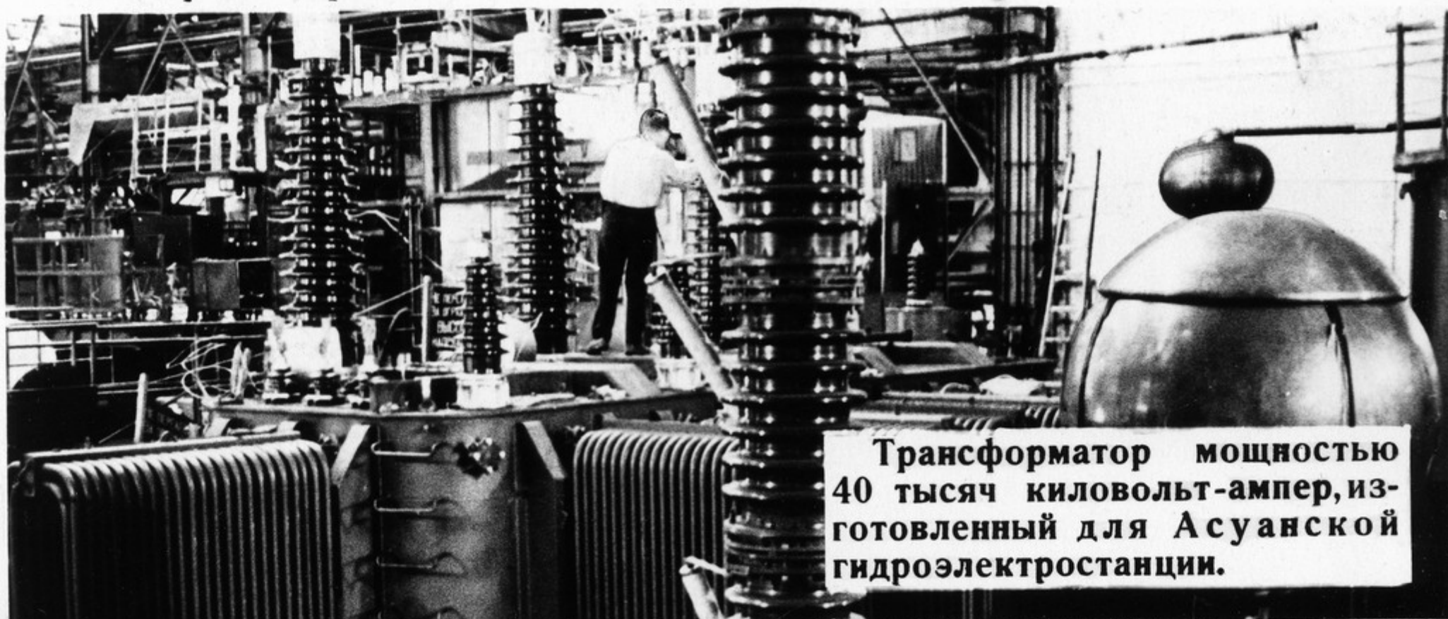
Трансформатор мощностью 40 тысяч киловольт-ампер, изготовленный для Асуанской гидроэлектростанции.

Советские люди рассматривают строительство коммунализма, как великую интернациональную задачу, отвечающую интересам мировой социалистической системы, международного пролетариата и всего прогрессивного человечества.