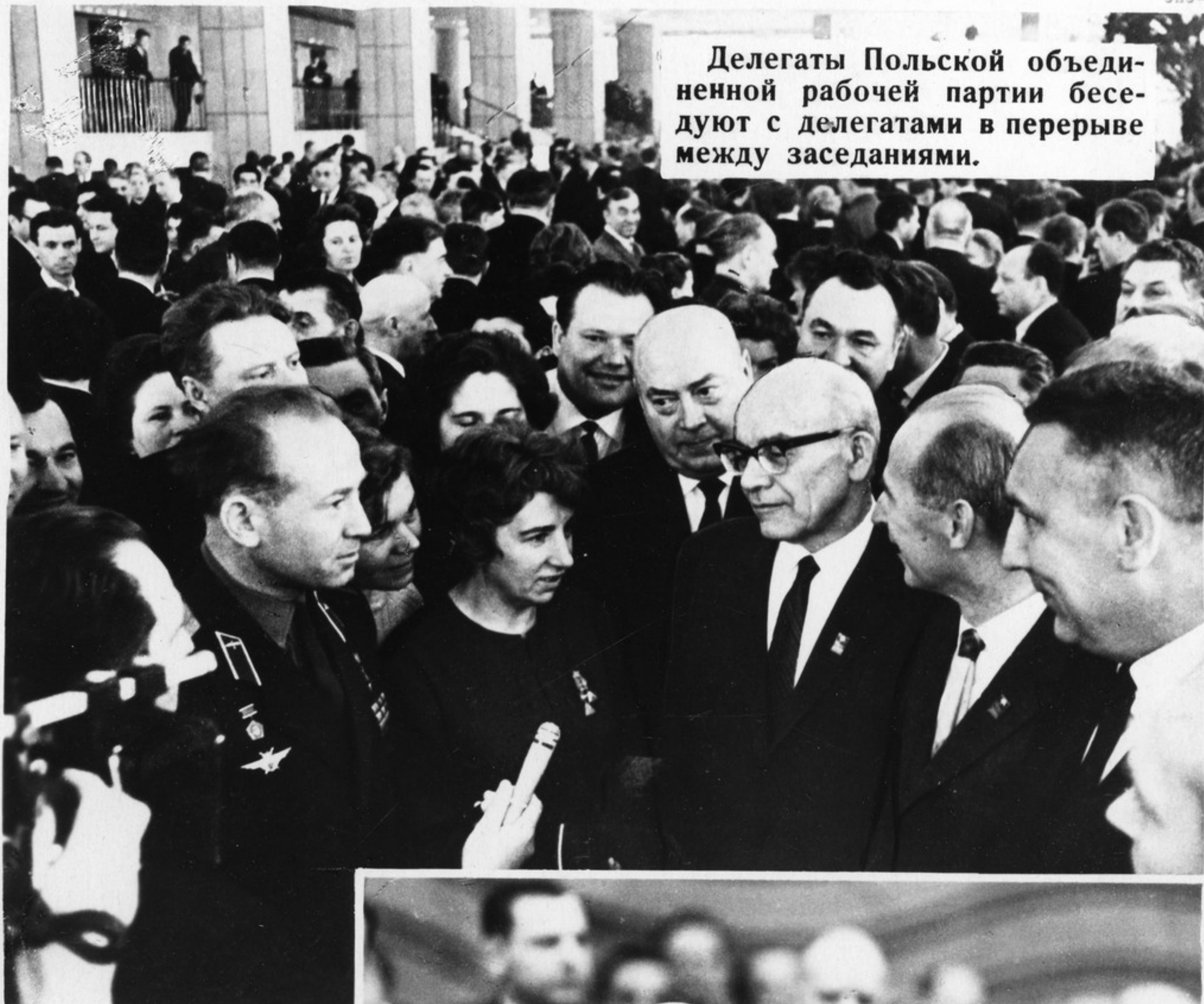
Делегаты Польской объединенной рабочей партии беседуют с делегатами в перерыве между заседаниями.