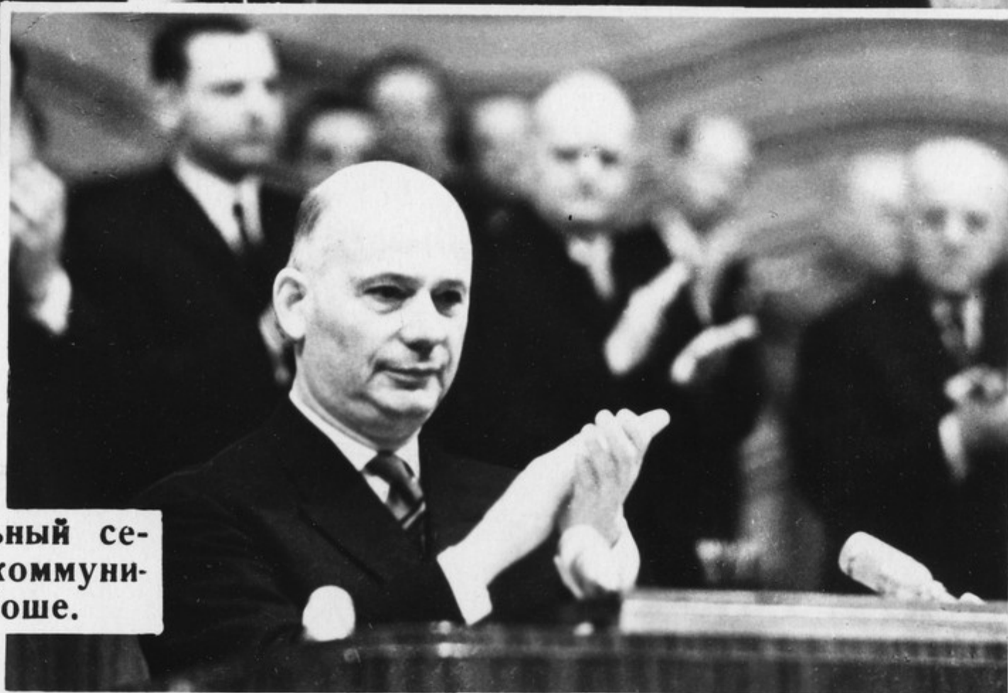
Выступает Генеральный секретарь Французской коммунистической партии В. Роше.

Огромный вклад в расширение связей и укрепление единства международного коммунистического движения внес XXIII съезд КПСС, на котором присутствовали делегаты 86 коммунистических, национально-демократических и левосоциалистических партий.