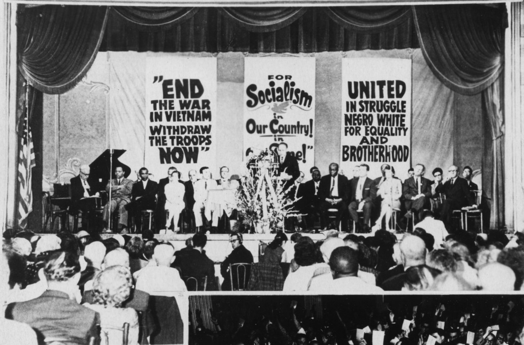
Нью-Йорк. XVIII съезд Коммунистической партии США.

Голосование делега- тов Первого съезда Со- циалистической Единой партии Германии (Запад- ный Берлин).