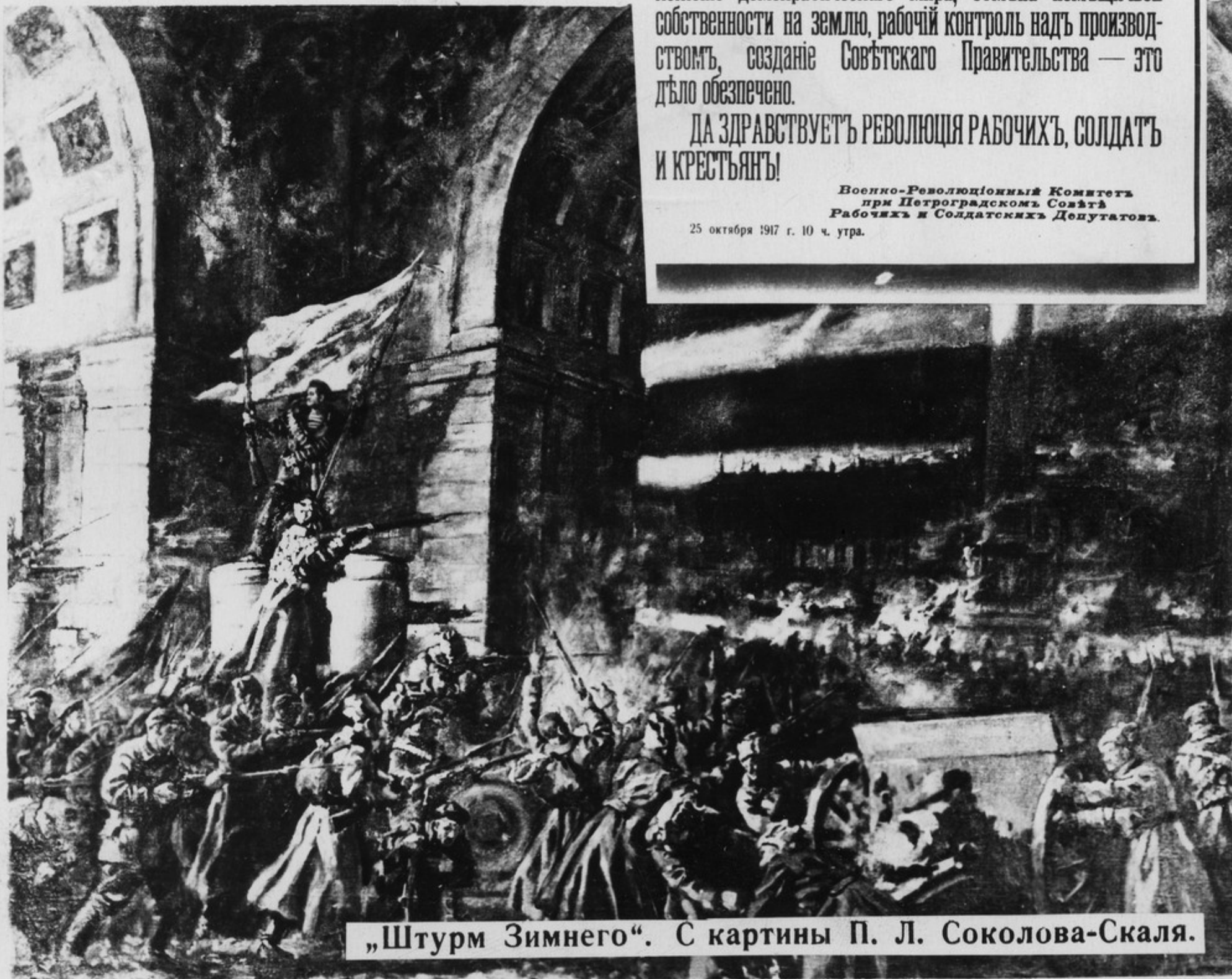
„Штурм Зимнего“. С картины П. Л. Соколова-Скаля.

Почти пятьдесят лет отделяет нас от тех дней, когда партия коммунистов во главе с Лениным подняла рабочих и крестьян России на победный штурм капитализма.