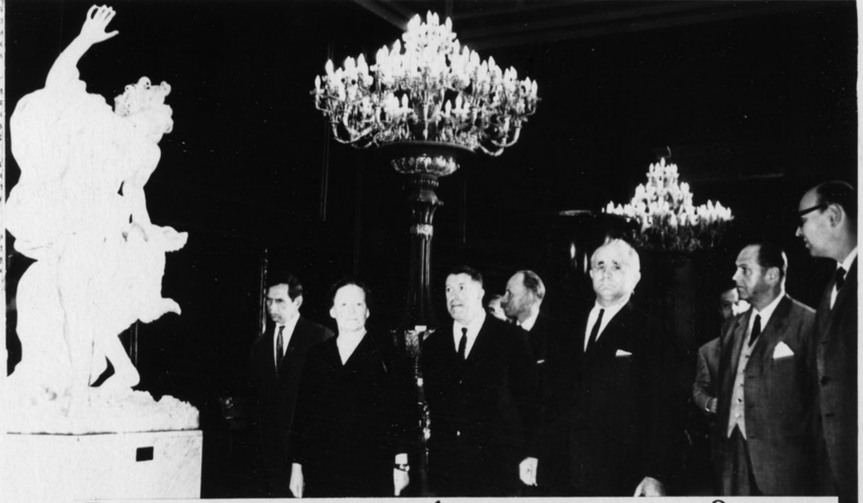
Парламентская делегация Австрии осматривает Эрмитаж.

сторона государственной деятельности и отражаетъ интересы всего народа. Въ этой пятилеткѣ мы достигли: въ области экономической обеспечить ростъ национальнаго дохода на 38-41 процентъ, увеличить объемъ промышленнаго производства примерно на 50 процентовъ, а среднегодовой доходъ на душу населения на 20-25 процентовъ.