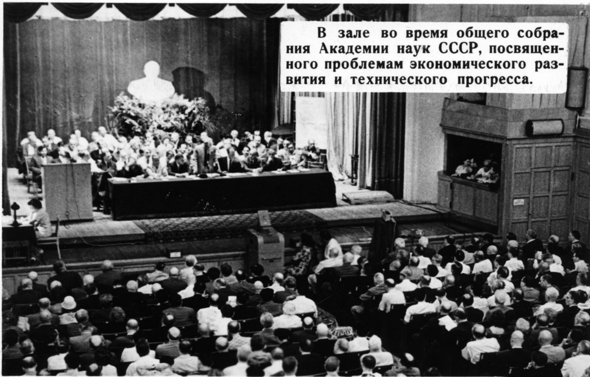
В зале во время общего собрания Академии наук СССР, посвященного проблемам экономического развития и технического прогресса.