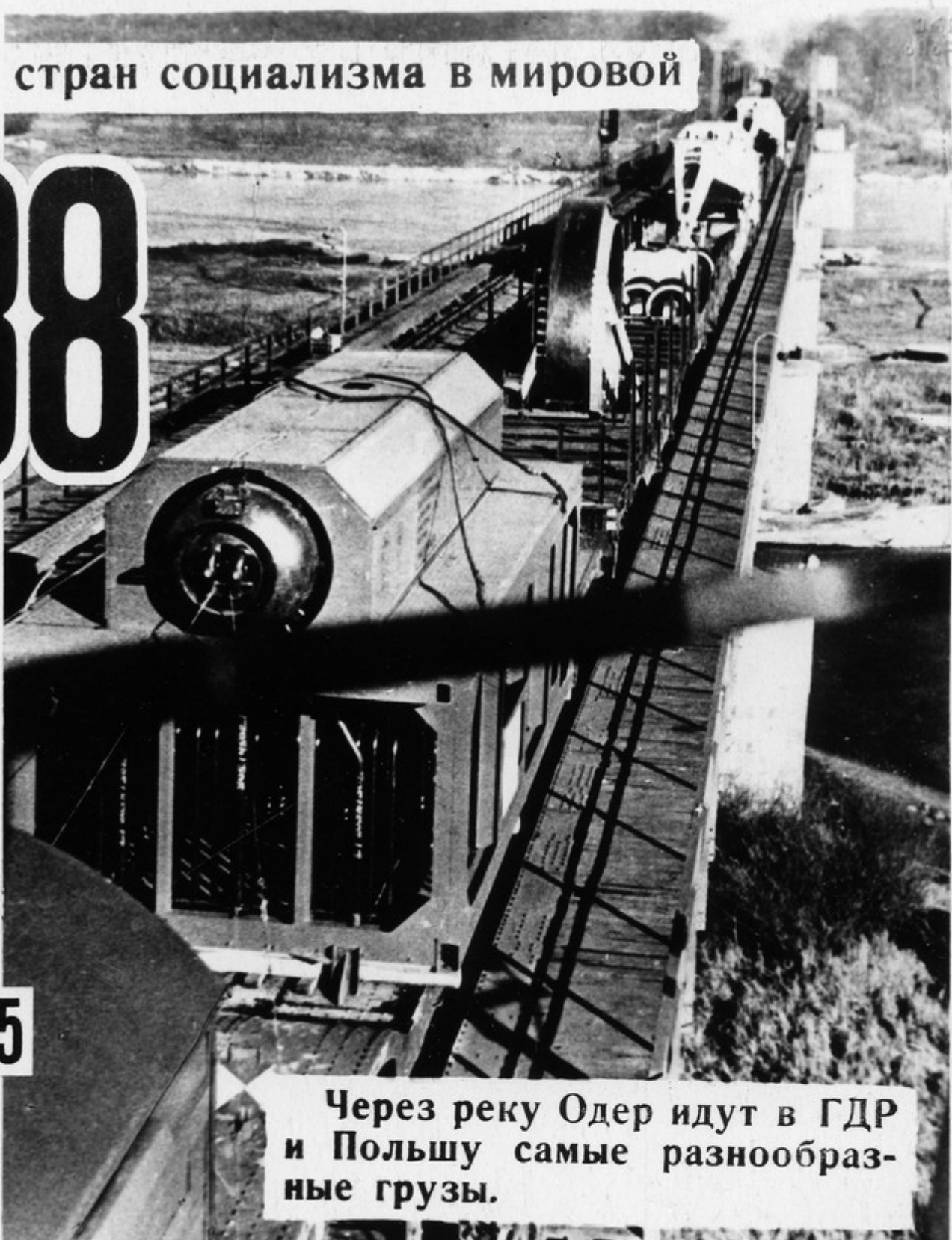
Через реку Одер идут в ГДР и Польшу самые разнообразные грузы.

СССР производит 20% мировой промышленной продукции.