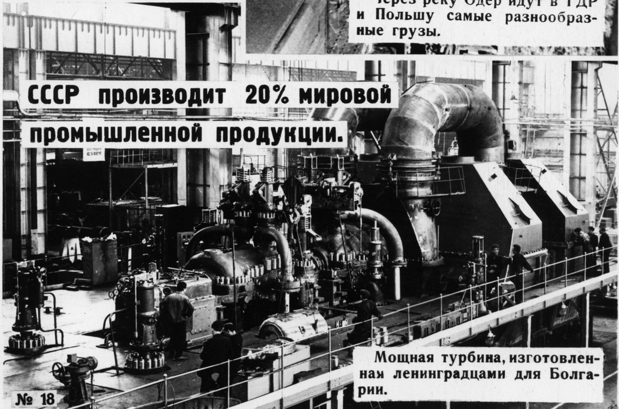
Мощная турбина, изготовленная ленинградцами для Болгарии.

СССР производит 20% мировой промышленной продукции.