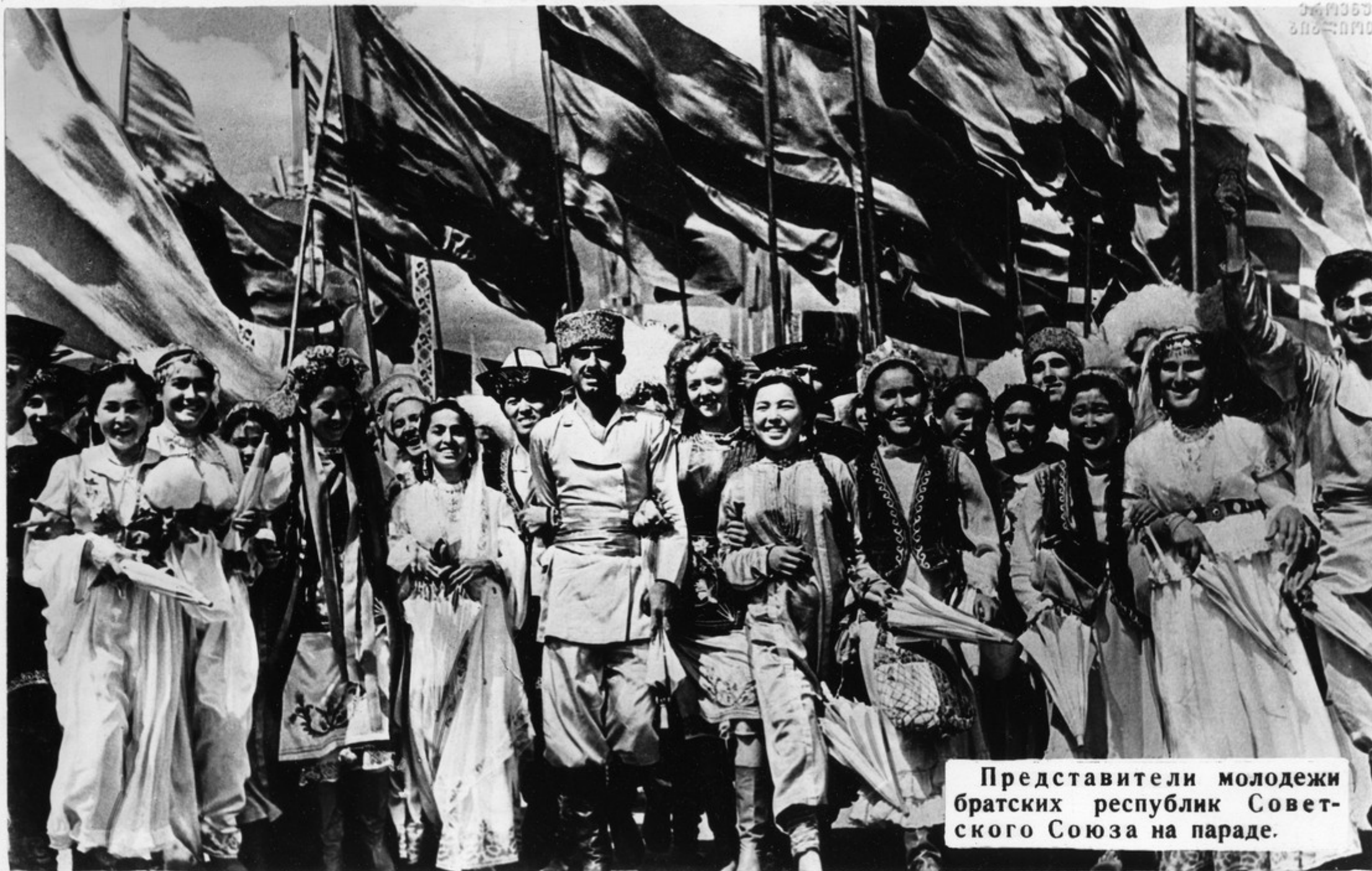
Представители молодежи братских республик Совет- ского Союза на параде.

За 50 лет развития Советского государства ярко проявилась великая жиз- ненная сила ленинской национальной политики, обеспечено политическое равенство союзных республик, успешно выравниваются уровни их экономического развития, укрепилась дружба народов.