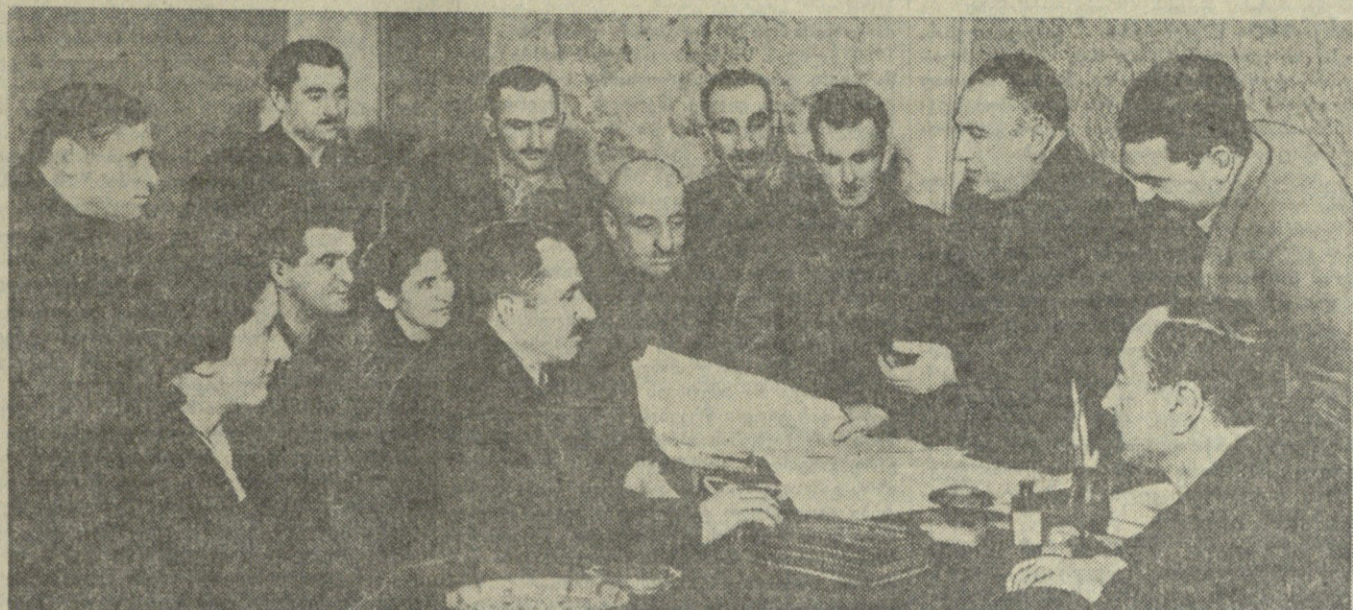
თბილისის მაულ-კამპოლის კომბინატის ხელმძღვანელებმა გულგანინთან განიხილეს...