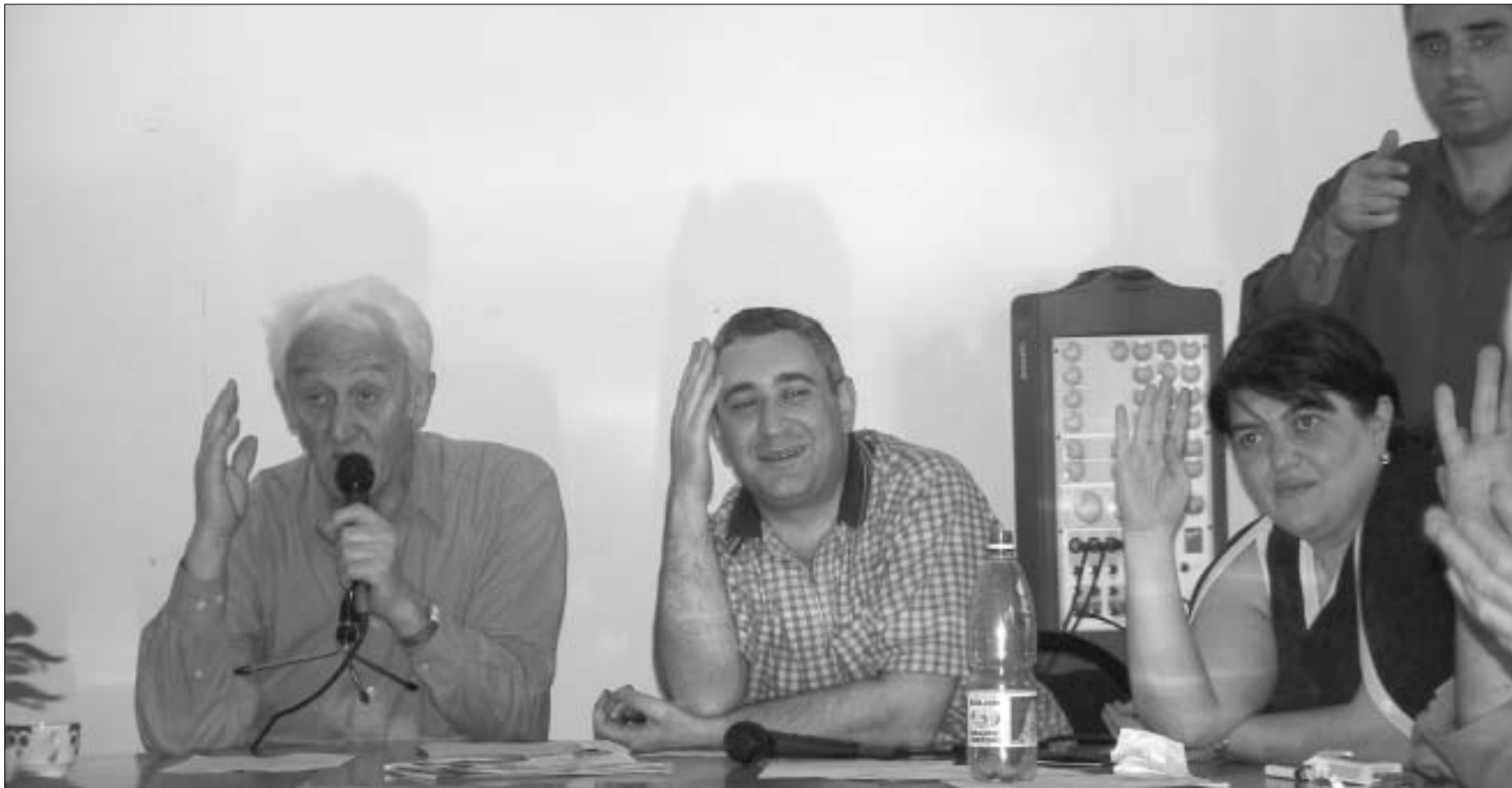
ცესკოს სხდომა.