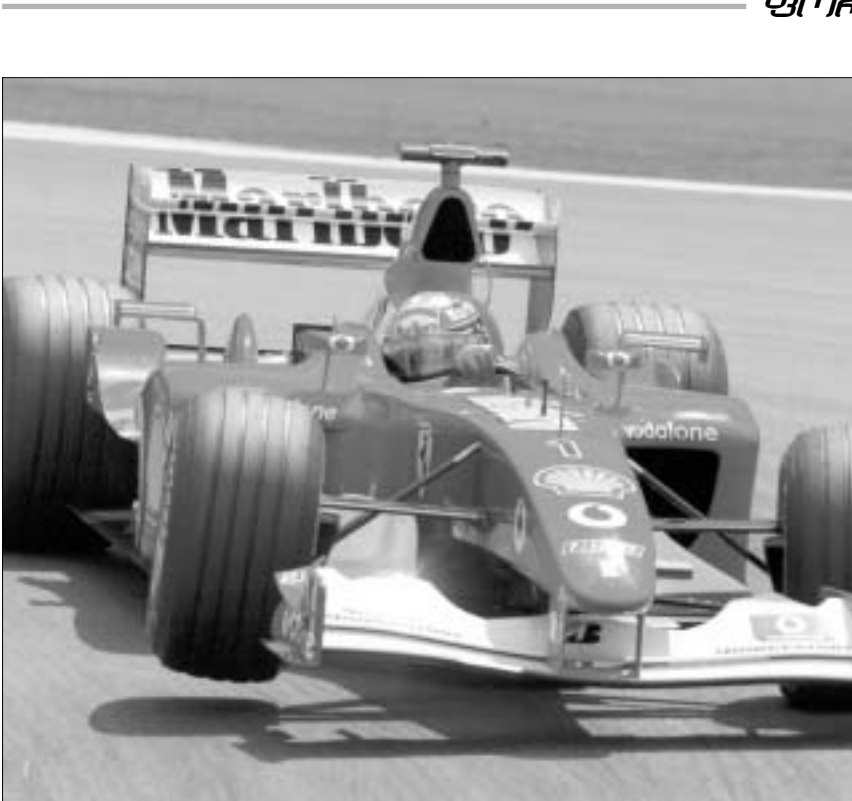
დღეს მორიგი გრან-პრი გათამაშდება

არ არის გამორიცხული, რომ ჩემპიონთა ლიგის შესარჩევ ტურნირში ჩაბმამდე რამდენიმე ახალი ფეხბურთელით გავცდილიყავით. ამის შესახებ გადაწყვეტილებას ჩვენი გუნდის ახალი მთავარი მწვრთნელი საწვრთნელი შეკრებების დასრულების შემდეგ მიიღებს.“