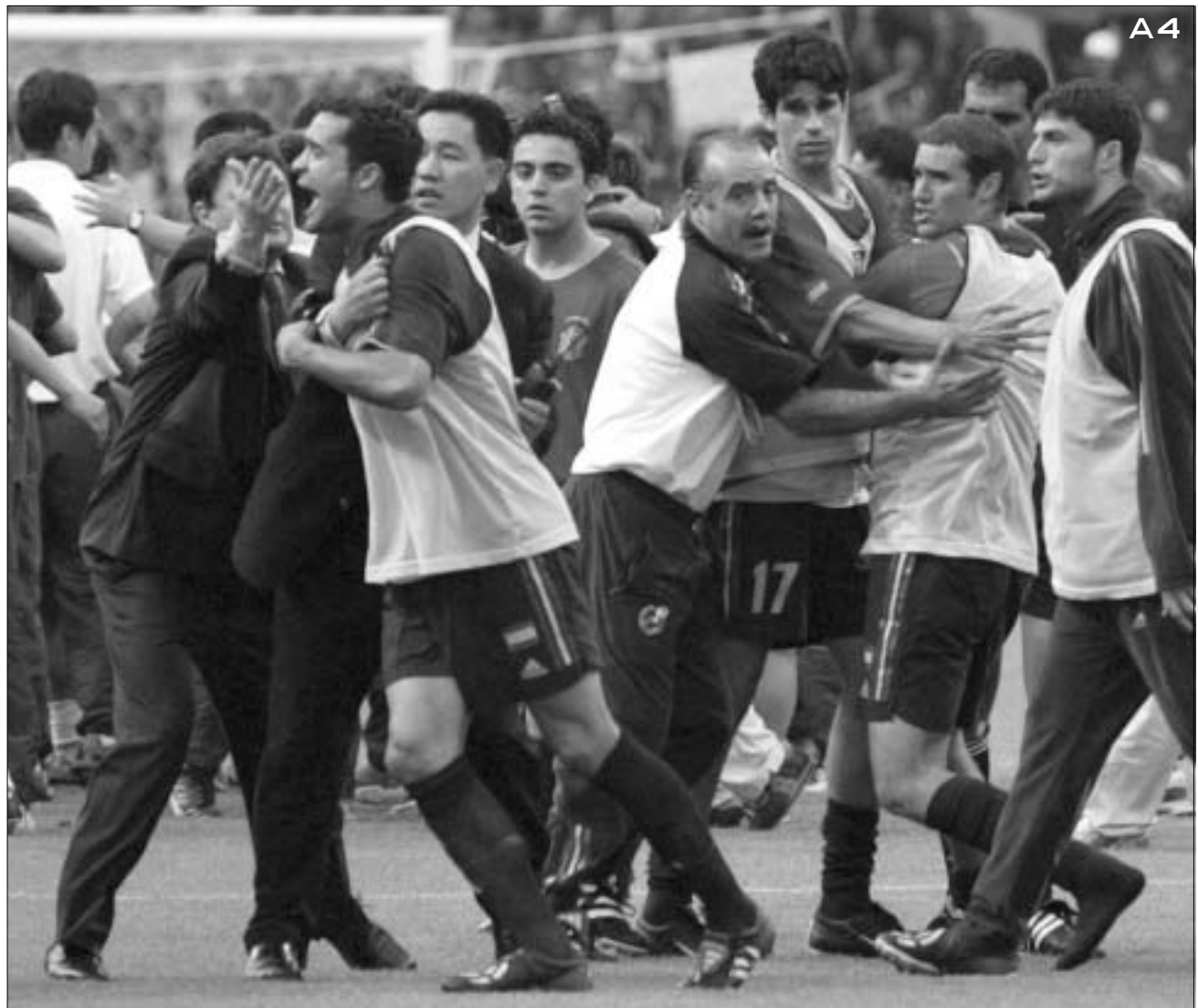
დამარცხებული ესპანელები მსაჯზე იხევნ.