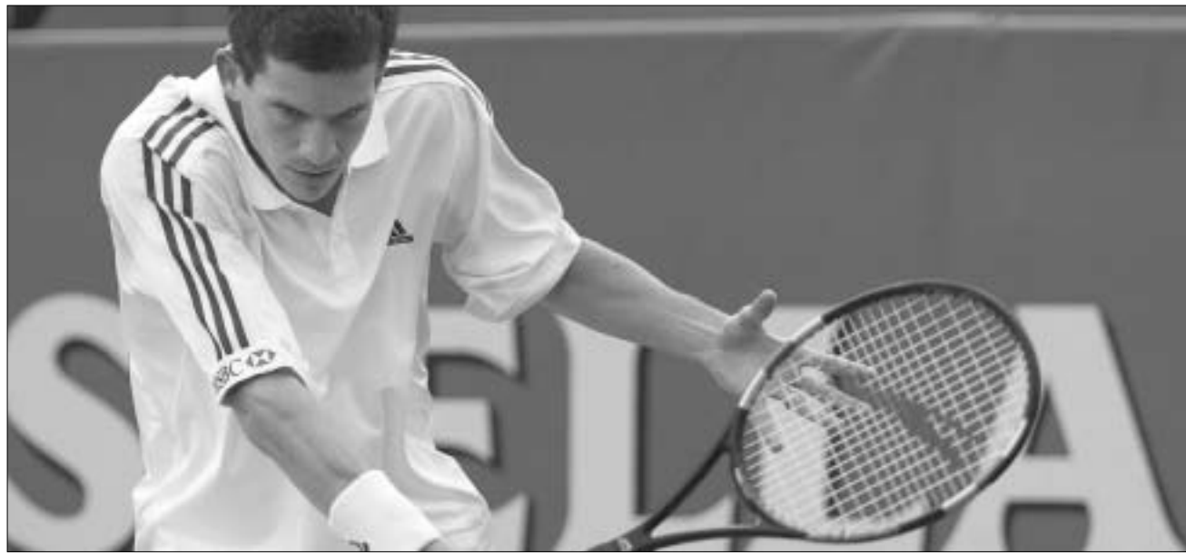
ლეიტონ ჰიუიტი გულდაწყვეტილია

....და შეიძლება მთავარი ფავორიტის, პირველ ნომრად განთესილი ავსტრალიელი ლეიტონ ჰიუიტის გარეშე დარჩეს. პოუტიტი ჰოლანდიაში მიმდინარე Ordina Open-ის ფავორიტადაც ითვლებოდა. ნახევარფინალის წინ ავსტრალიელს ნანლაუერი ინფექცია დაემართა და, იძულებული გახდა, მატჩზე უარი ეთქვა. მის ნაცვლად ნახევარფინალში ფრანგი არნო კლემანი გავიდა. პოუტიტი გულდაწყვეტილია: „უიმბლდონი ორგაბათს იწყება. მე კი ჯერ არ ვიცი, მოვასწრებ თუ არა მწყობრში ჩადგომას“.