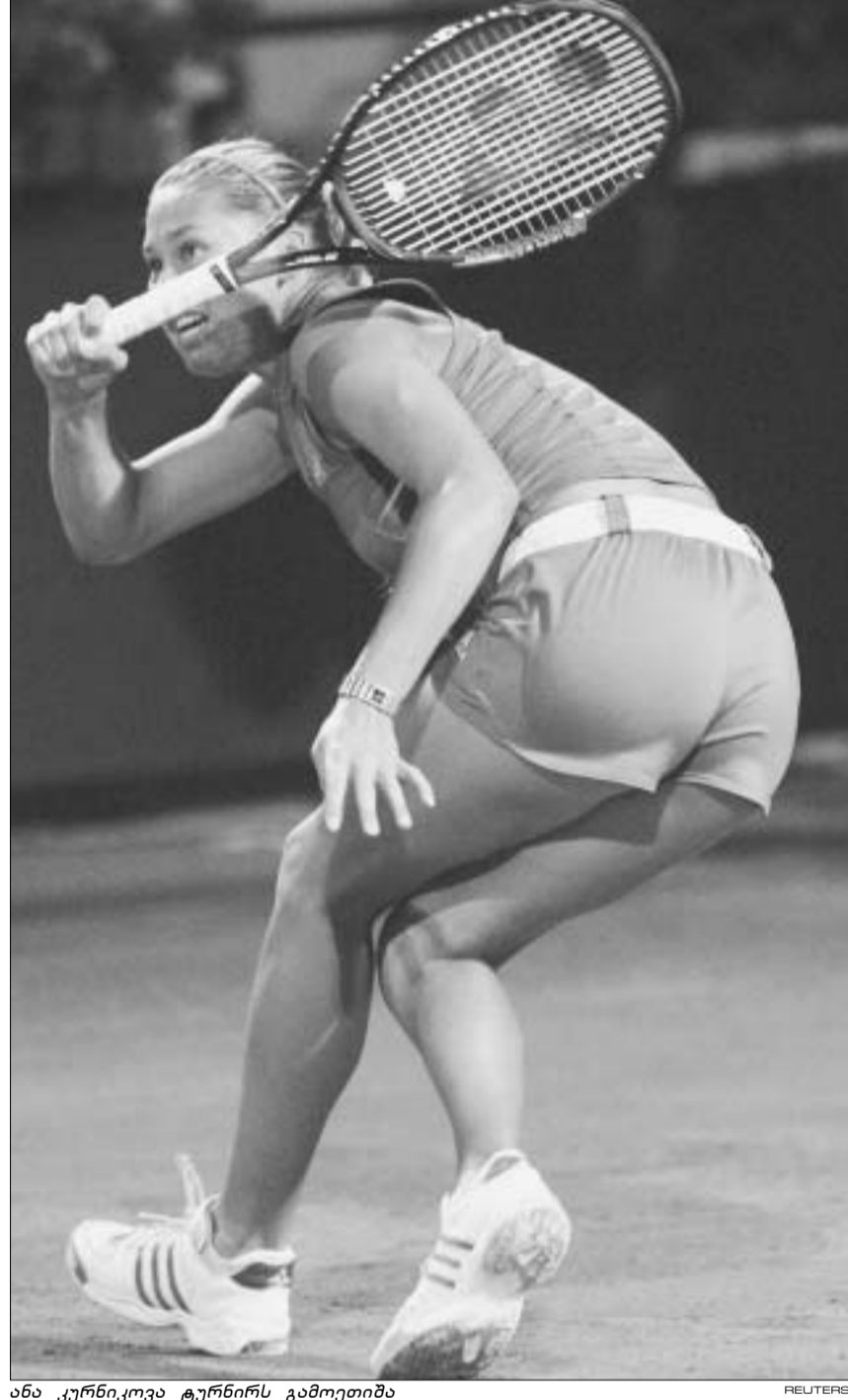
ანა კურნიკოვა ტურნირს გამოეთიშა

აღსანიშნავია, რომ გუშინ წაავთ ანა კურნიკოვამაც. ის სამ სეტში ტაქტიანა პანოვამ (21-უ ჩოვანი) დაამარცხა. ანგარიში ასეთი იყო: 6-1 4-6 6-4.