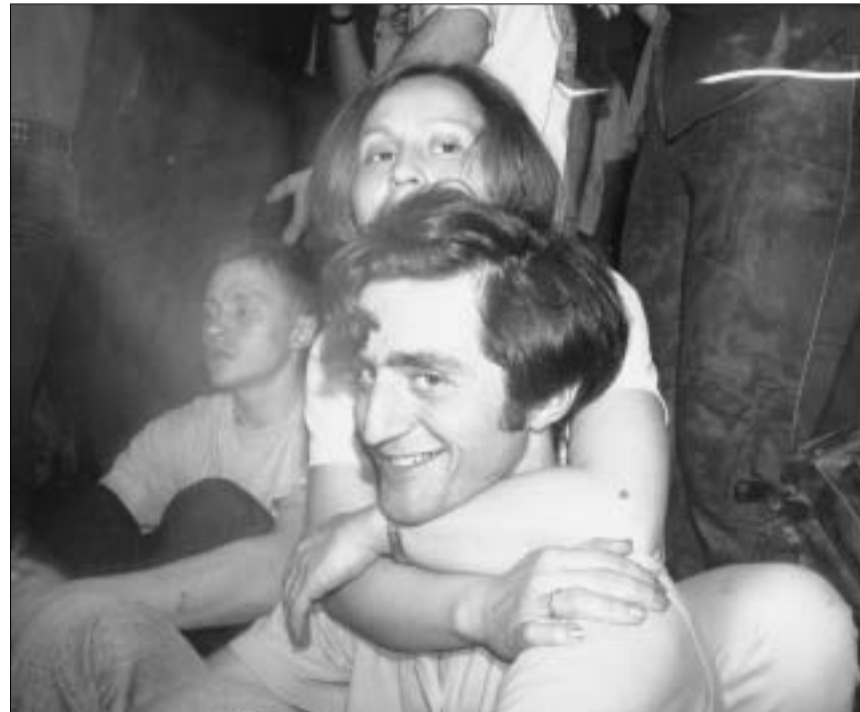
ამ ახალგაზრდებს უყვართ მიმე როკი და ერთმანეთი