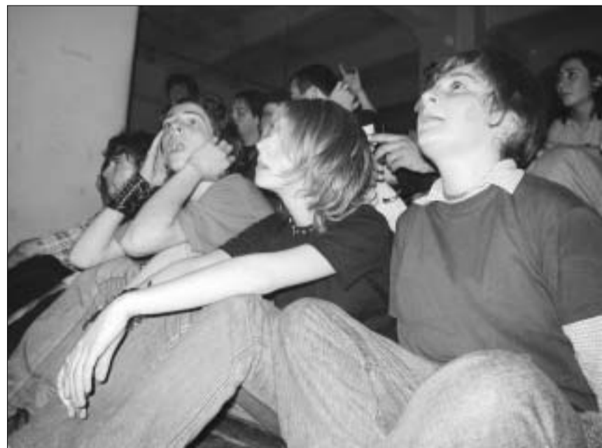
ამ ახალგაზრდებს უყვართ მიმე როკი