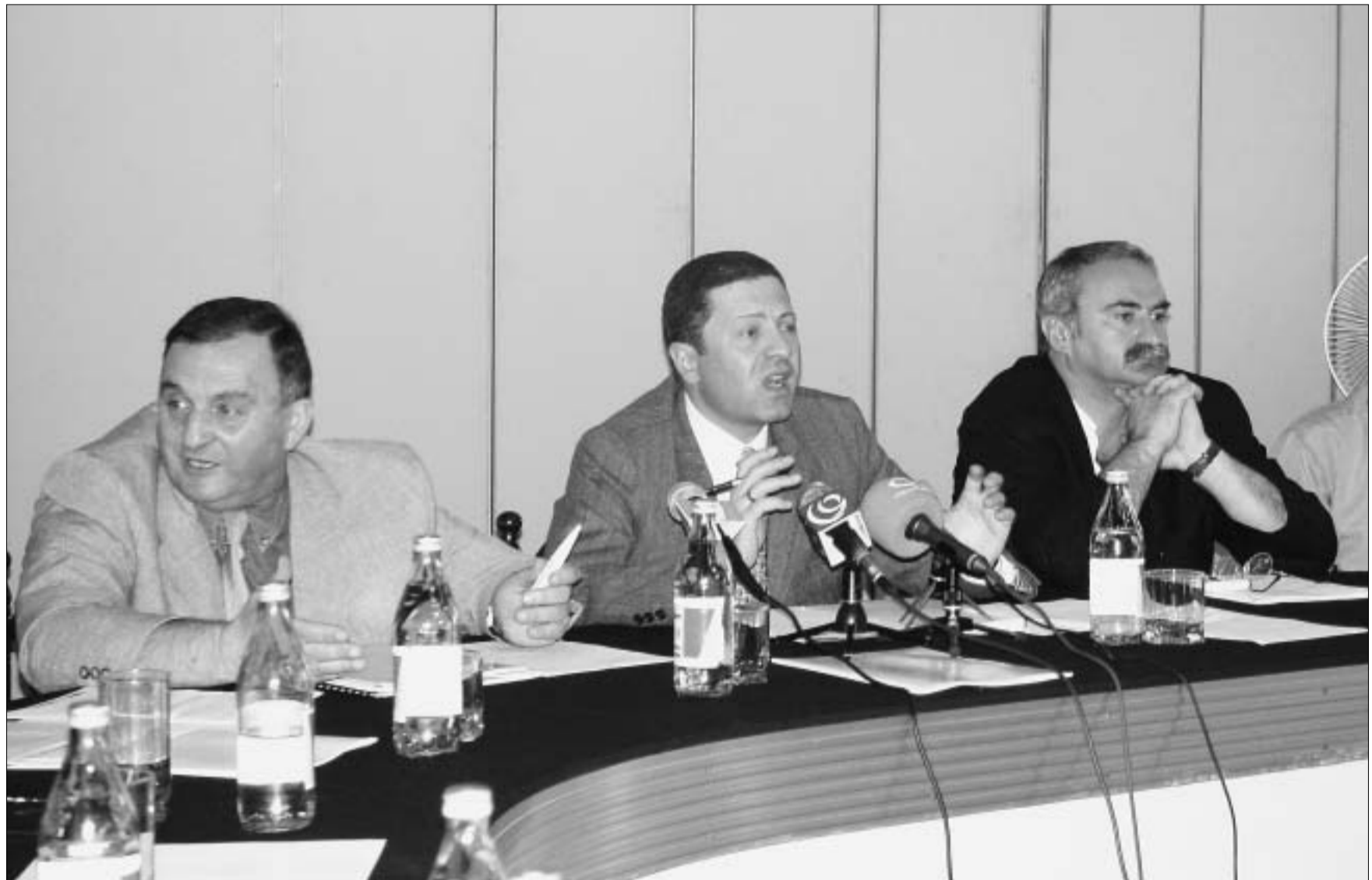
ფეხბურთის ფედერაციის სხდომა