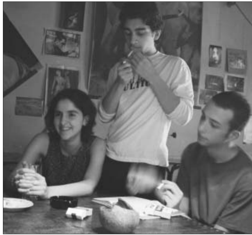
ამ ახალგაზრდებს უყვართ სიყვარული

"ჩემთვის ყველაზე დიდ ოცნებად რჩება ცხოვრება სიტყვების გარეშე! ალბათ არარეალურად შეიძლება, მაგრამ ჩემთვის ყველაზე მთავარია ხალხმა სწორად გამიგოს. მე ვამბობ გრძობებზე და ემოციებზე, რომლების გამოსახატავდაც სიტყვები არ უნდა იყოს საჭირო. კიდევ ვოცნებობ ნამდვილ მეგობრობაზე, ისეთზე კი არა, ერთი ნუთი რომ გწევიდებოდა, არამედ 1000 წელი! ბევრი ცხოვრება! ცხოვრება ხომ სულ რაღაც ერთი ნუთის გასავლელია. რაც შეეხება უფრო რეალურს, ალბათ მინდა ერთი ათი წლის მერე ვიყო ისეთი პიროვნება, რომ ყველას ვუყვარდი!"