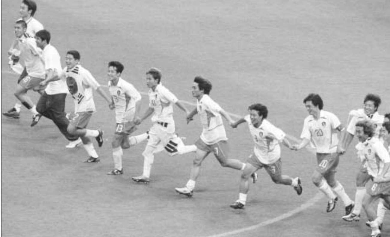
კორეის ნაკრები გუნდი

მის პოლანდელ მწვრთნელს შეხვდა და ნაყოფიერი შრომისთვის მადლობა მოახსენა. საპასუხოდ გუს ჰილენკმა აღნიშნა, რომ წარმატების მიზეზი მთავრობისა და გუნდის თანამშრომლობაა. როგორც ჩანს, კიმ დე ჯუნი მიღწეულით არ კმაყოფილებდა და დიდი იმედი აქვს, რომ მისი გუნდი ფინალში გავა. ფინალურ მატჩზე დასწრების მიზნით, კვირიდან სამ-შაბათამდე, იაპონიას ესტუმრება. იმისთვის, რომ ვიზიტი საქმიანიც აღმოჩნდეს, სამხრეთ კორეის საგარეო საქმეთა მინისტრის განცხადებით, კიმ დე ჯუნი მსოფლიო ჩემპიონატის საზეიმო დახურვის შემდეგ იაპონიის პრემიერ-მინისტრ ძიუნე-ჩირო კოიძუმის შეხვდება. მეუღლის თანხლებით კი იაპონიის იმპერატორ აკიხიტოს და იმპერატრიცა მიჩიროს შეხვდება.