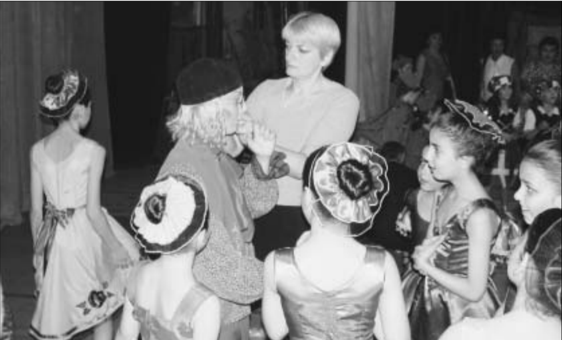
შოხუივი შვილიშვილი და მასწავლებელი ბებია