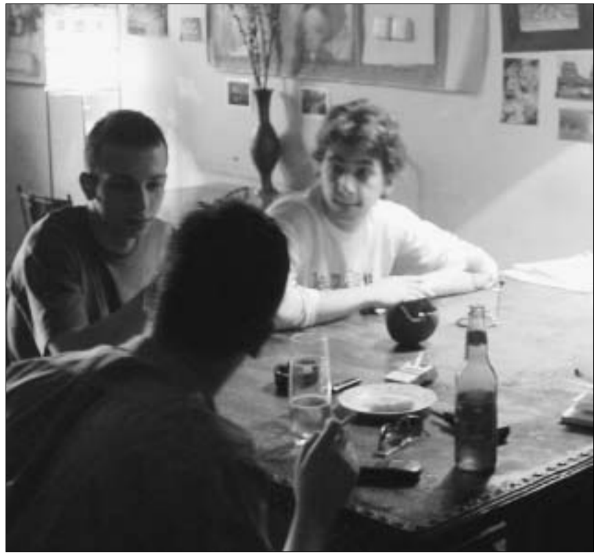
ამ ახალგაზრდებს უყვართ ...