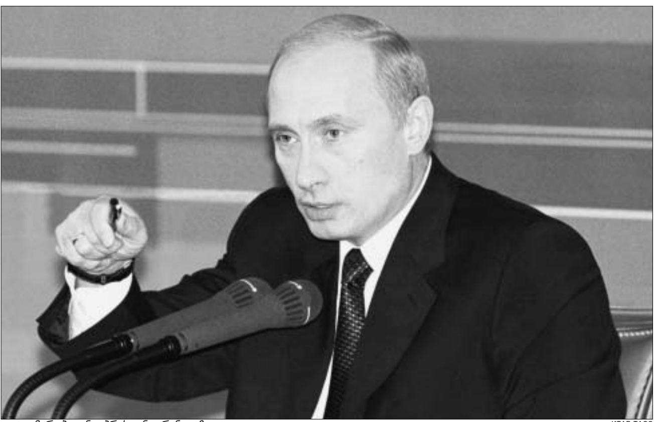
ვლადიმირ პუტინი პრესკონფერენციაზე