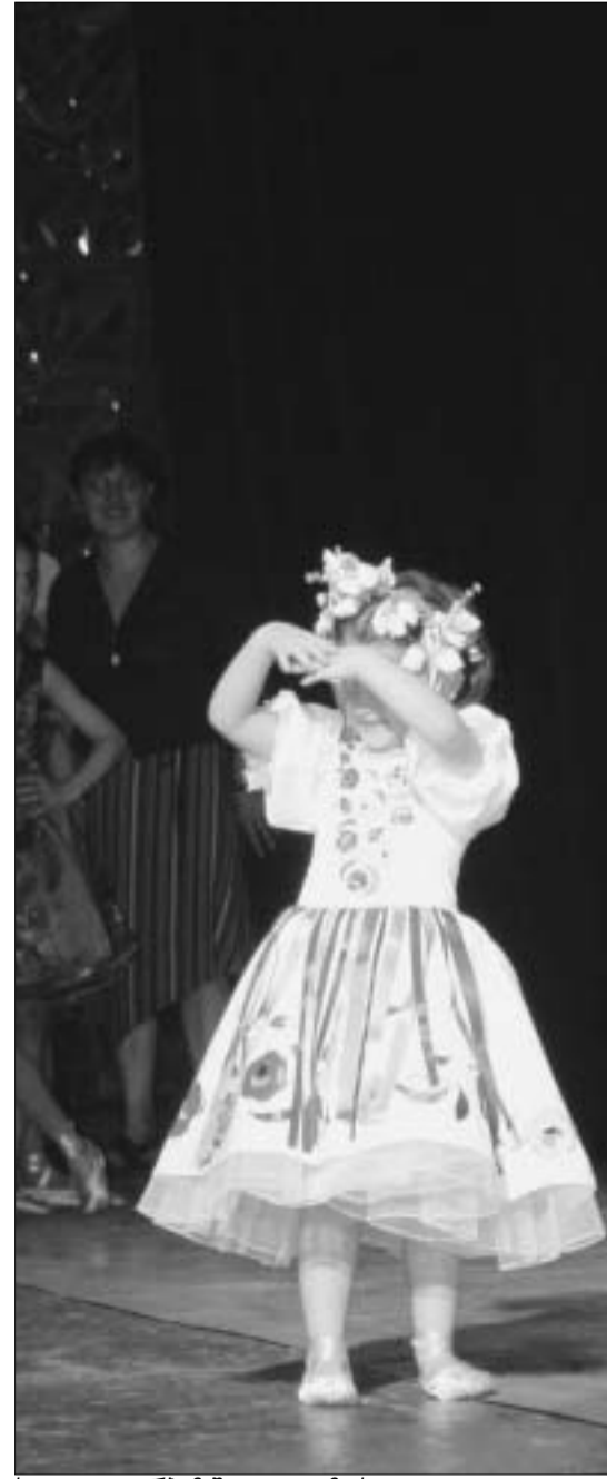
სადღაც დარბაზში დედა ზის