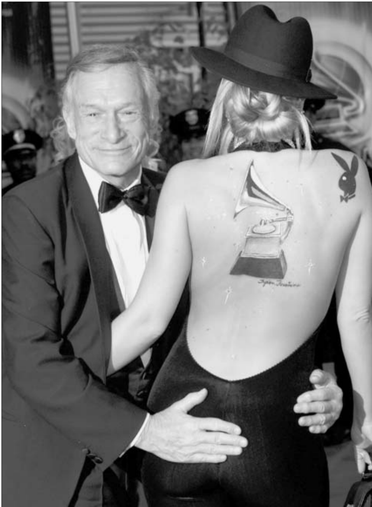
პიუ შედენერმა „ენრონის“ გოგონებს გახადა