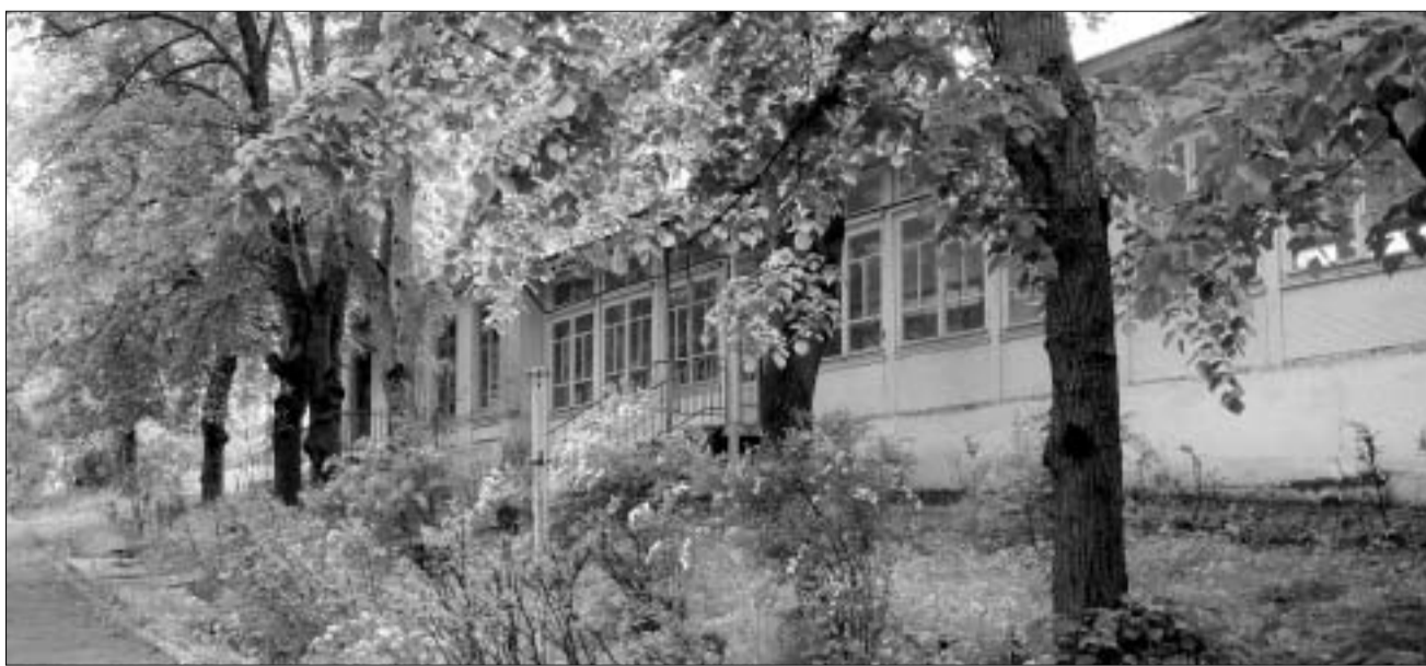
მს-ს დასასვენებელი სახლის სასაიდლო