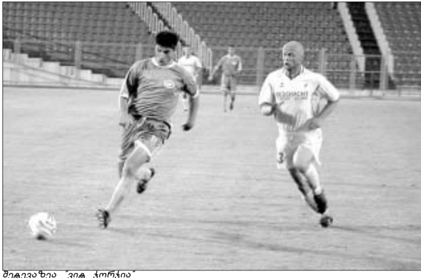
შეტევაზეა ვიტ კორეია