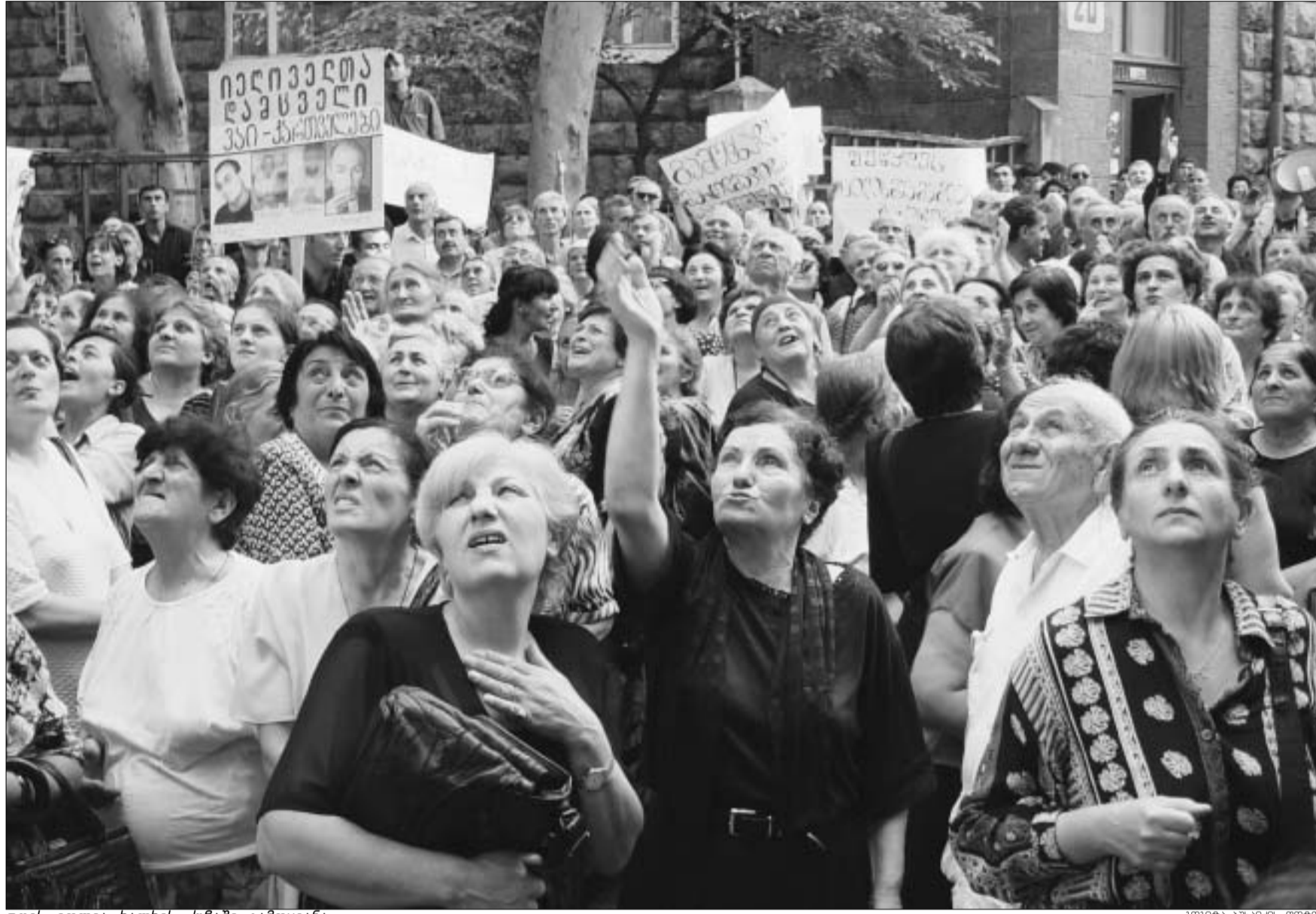
დღეს ილია ხალხის ქუჩაში გამოყვანა