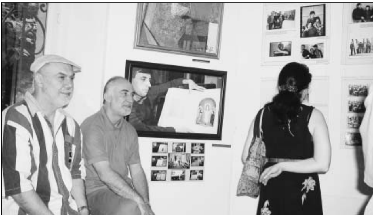
ასე ინსტრუქტორი 80-იან წლებს

გამოფენის საბოლოო მიზანი 80-იანელთა ფოტოარქივის, ძველი და ახალი ნამუშევრების კატალოგის მომზადებაა. ნიგნში შეიძლება შევიდეს მხატვრებთან ინტერვიუები და შემოქმედებითი პროცესის ამსახველი სხვა წერილობითი მასალებიც, რაც კიდევ უფრო გააცოცხლებს ამ გამოცემას. “80-იანელები მხატვართა ის ჯგუფია, რომლებმაც ამ პერიოდში დაამთავრეს სამხატვრო აკადემია და პოპულარობაც მაშინვე მოიპოვეს. შეიძლება ითქვას, მათი ნახატები ყველაზე კარგად იყიდება, მათი ბევრი ნამუშევარი ყოველგვარი აღნუსხვის გა-