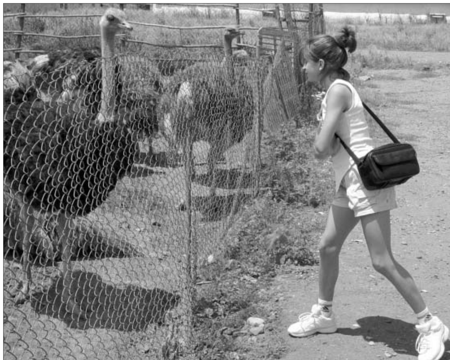
გოგონა ბაზაიის ფოტოში