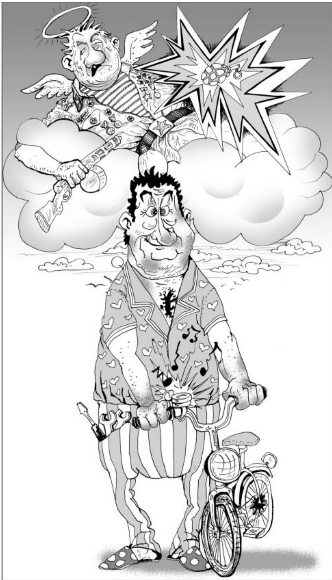
მანანა ტყეშელაშვილის ნახატი