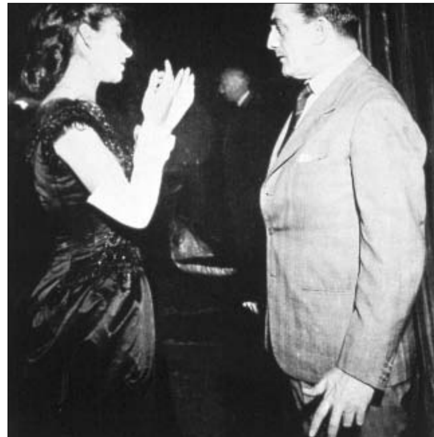
მარია კალასი და ლუკინო ვისკონტი 'ტრავიატას' პრემიერის შემდეგ, 1953წ.