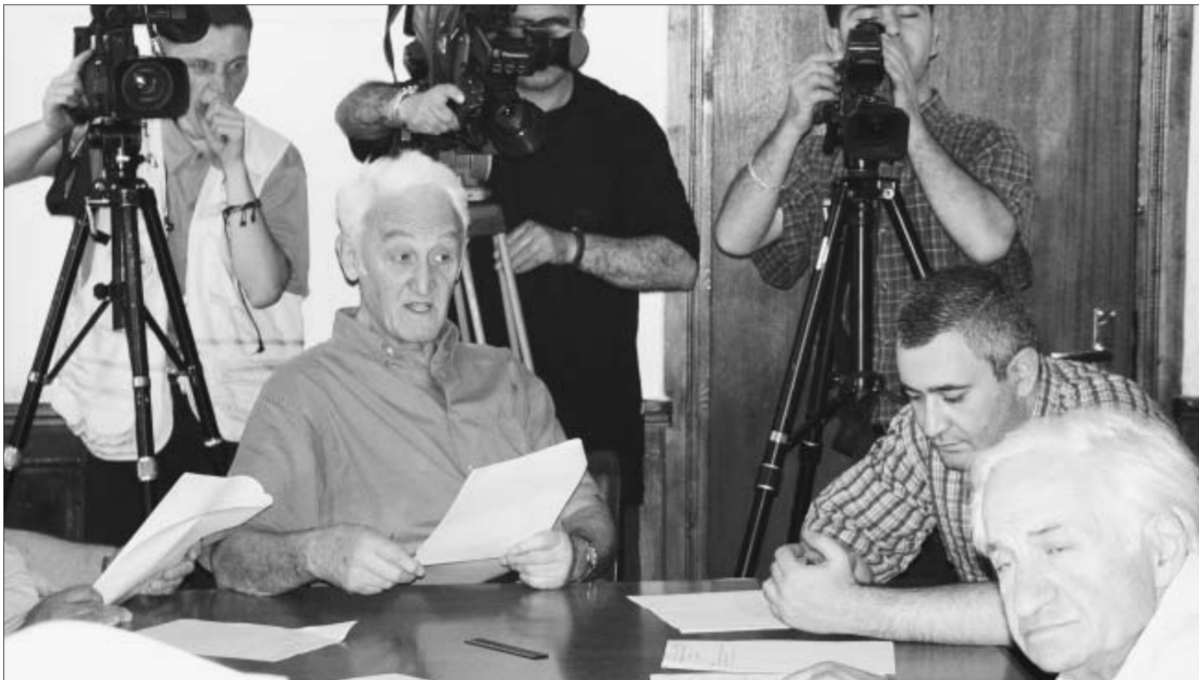
ცენტრალური საარჩევნო კომისია დროს წელავს

თბილისის საკრებულოს ბედი კვლავ გაურკვეველია