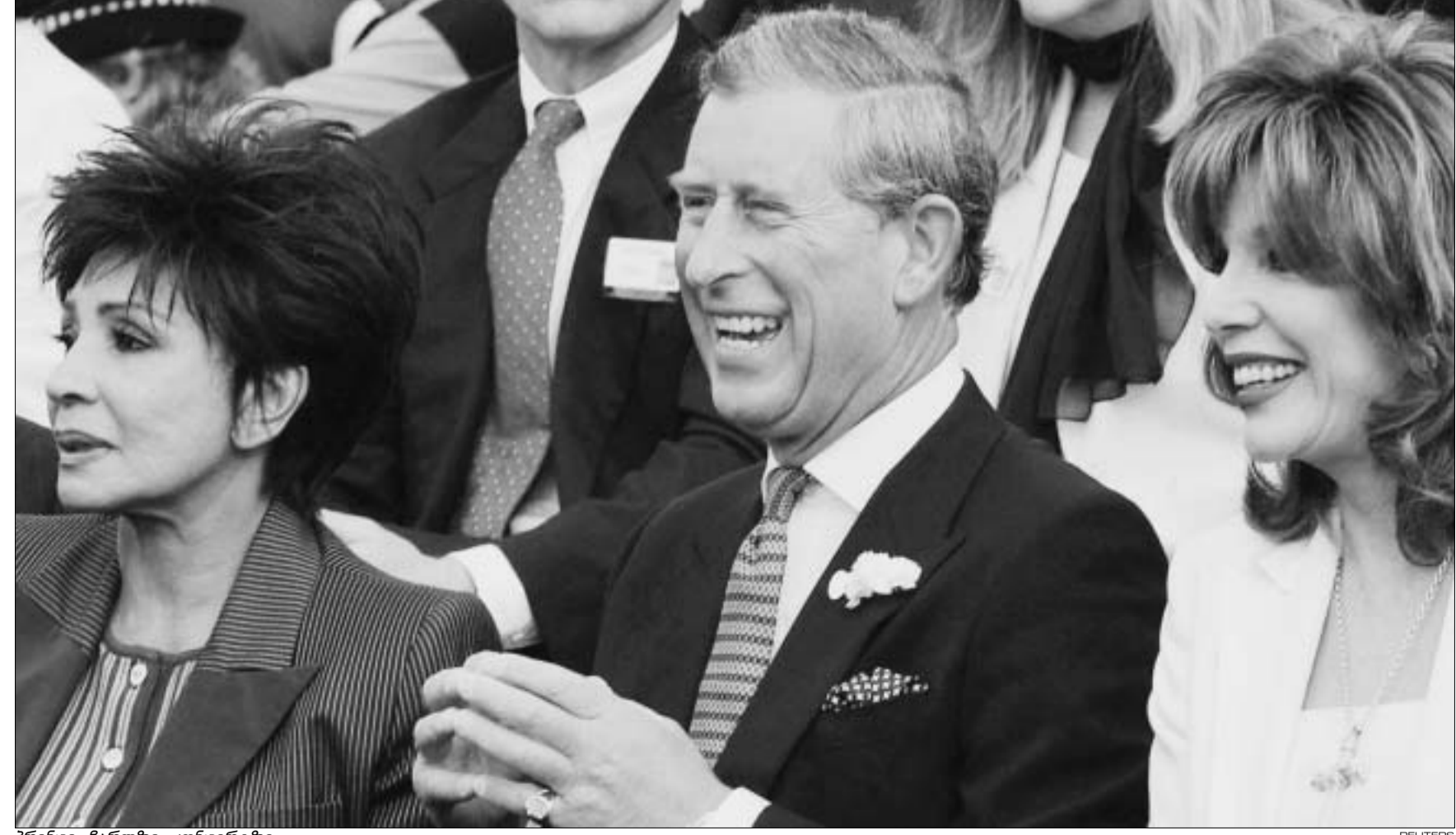
პრინცი ჩარლზი კონცერტზე

ცაა შავი, სოფი ელის-ბექსტორი და ლიბერთი იქსი - მათი პოპულარობა ხომ კომერციული წარმატების უმთავრესი წინაპირობაა. კონცერტის მოგება - 1 მილიონი ფუნტი სტერლინგი პრინცი ფონდის გადაირიცხება. ფონდი ახალგაზრდა და ნიჭიერი ადამიანების დახმარებაზეა გათვლილი.