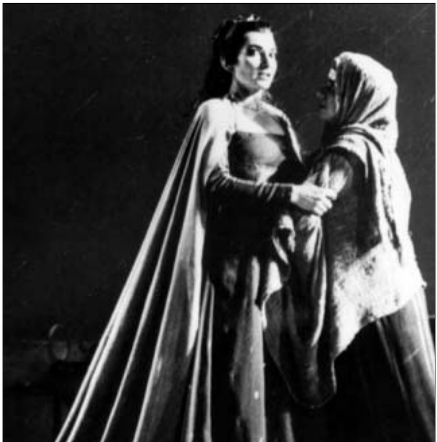
მარია კალასი სცენაზე

და. მარია ცუდ გუნებაზე შემხვდა, საავადმყოფოში იჯდა და თითქმის არ ლაპარაკობდა. მითხრა, რომ ძალიან ბედნიერია შემთავაზებით, მაგრამ აღარასოდეს იმღერებდა. როდესაც ვუთხარი, რომ ცოტა მსუბუქი და პატარა პარტიები ემღერა, გავემტყულება კატეგორიული ტონით მიმასუხა: „ჩემი ხმა ისეთად დარჩება, როგორც იყო...“ ფანი არდანი ძეფირელის ახალ ფილმში 26 კოსტიუმს იცვლის, რომელიც კალასის სტილში შეკერა. მანელი ხომ კალასის საყვარელი მოდელიორი იყო. მიუხედავად სანაქებო პრობლემებისა (ეს ეფექტურად ჩანს ფრანსუა ონისის „რეა ქალშიც“, სადაც მსახიობი ერთ-ერთ მთავარ როლს ასრულებს), არდანს მაინც მოუწია ნონაში დაკლება, რათა კალასის სახელგანთქმული ყვრიმალეები და მაღალი ყელი გამოეჩინა. ნავარუდეგია, რომ ფილმი „ყველა დროის კალასი“ ეკრანზე სექტემბერში გამოვა. პრემიერას კი ვენეციის საერთაშორისო კინოფესტივალზე ელოდებიან, რომელიც ყოველწლიურად, სწორედ, სექტემბრის დასაწყისში იმართება.