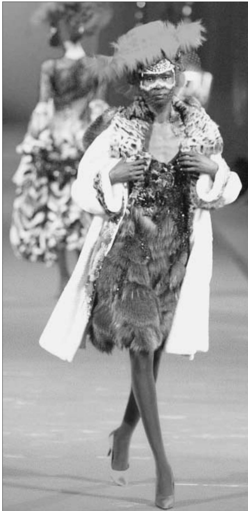
თავის მოდელები ლათინური ამერიკის ქუჩის ფსტივლებით შთაგონებულმა