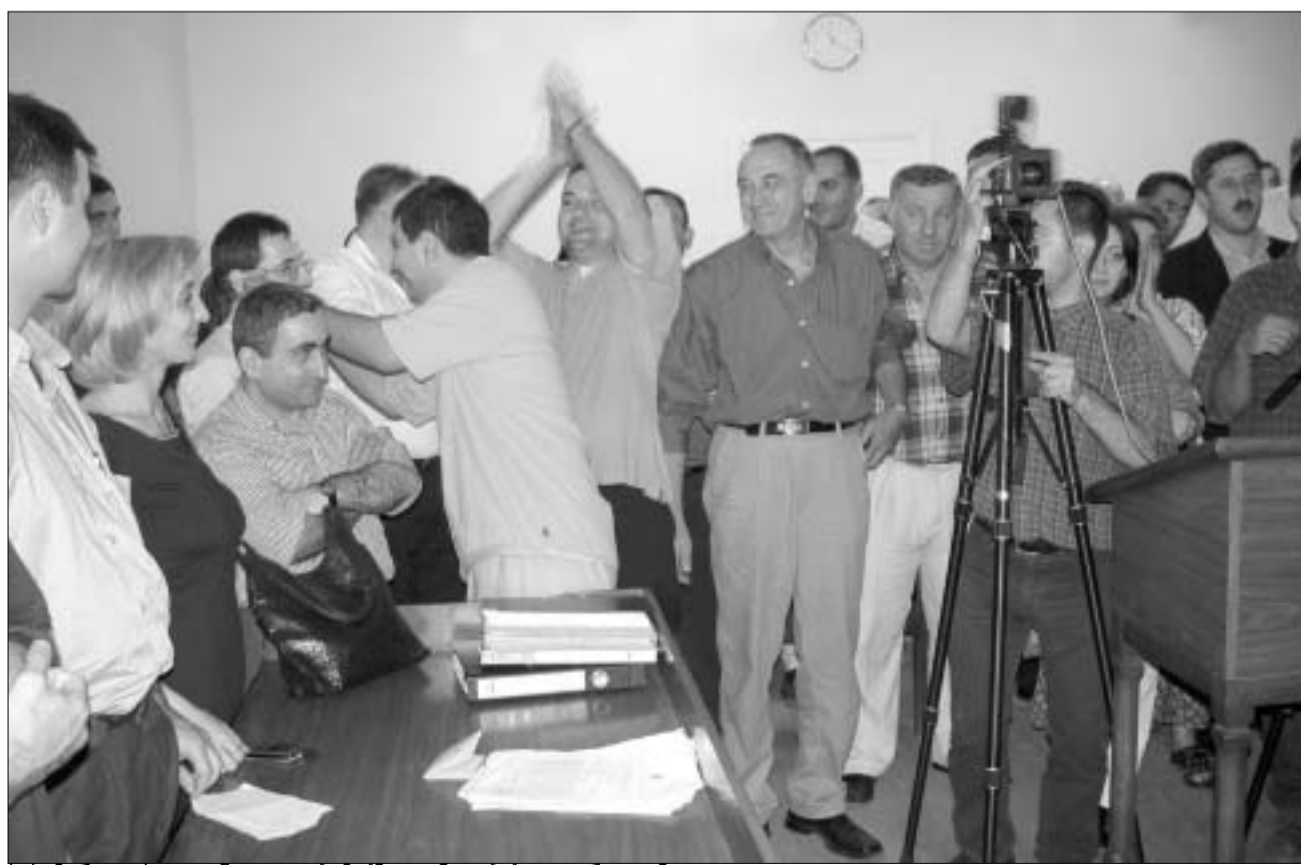
სასამართლოს გადაწყვეტილებამ „ნაციონალები“ ადამრთოვანა