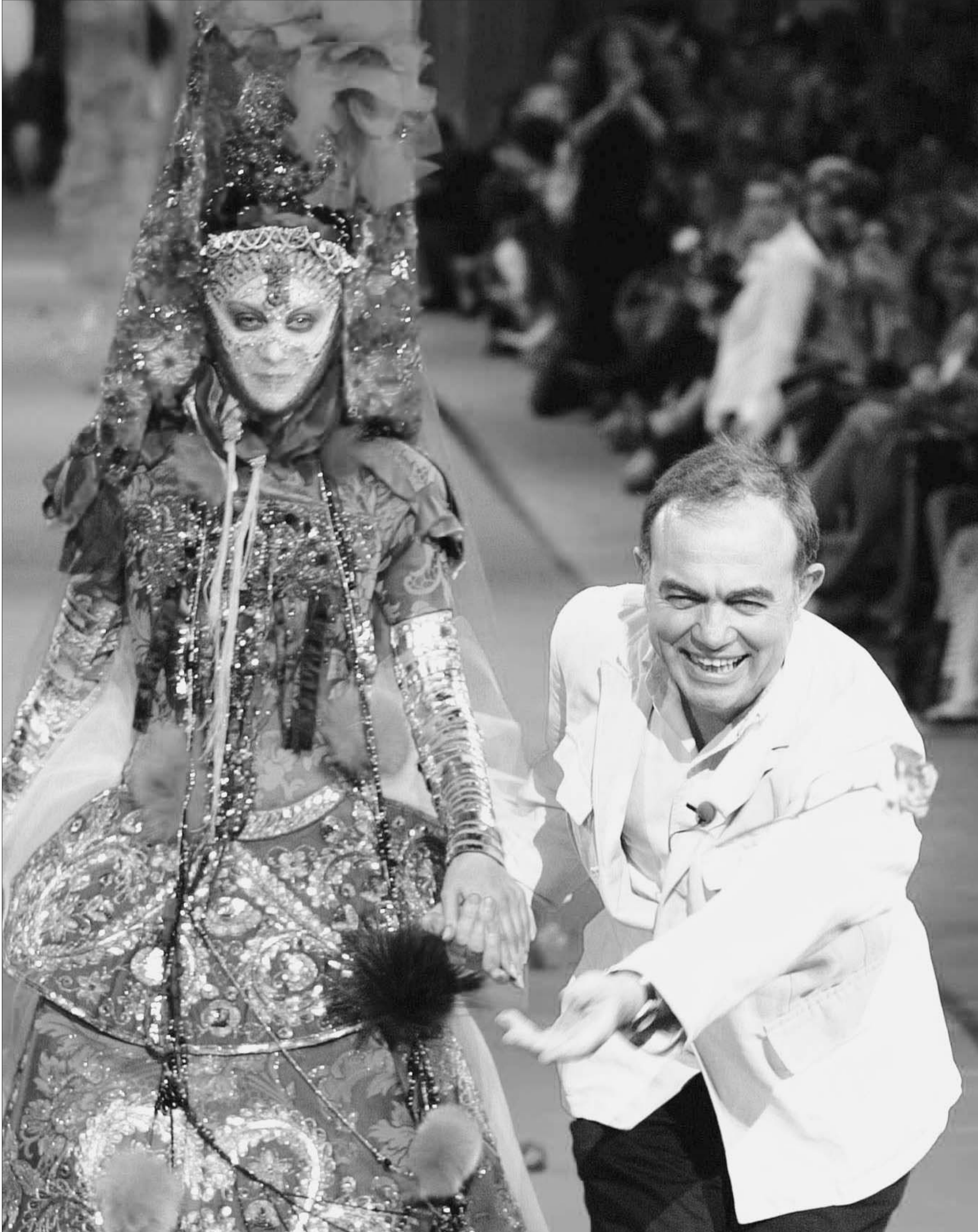
კრისტინ ლაკრუა თავის მოდელებთან