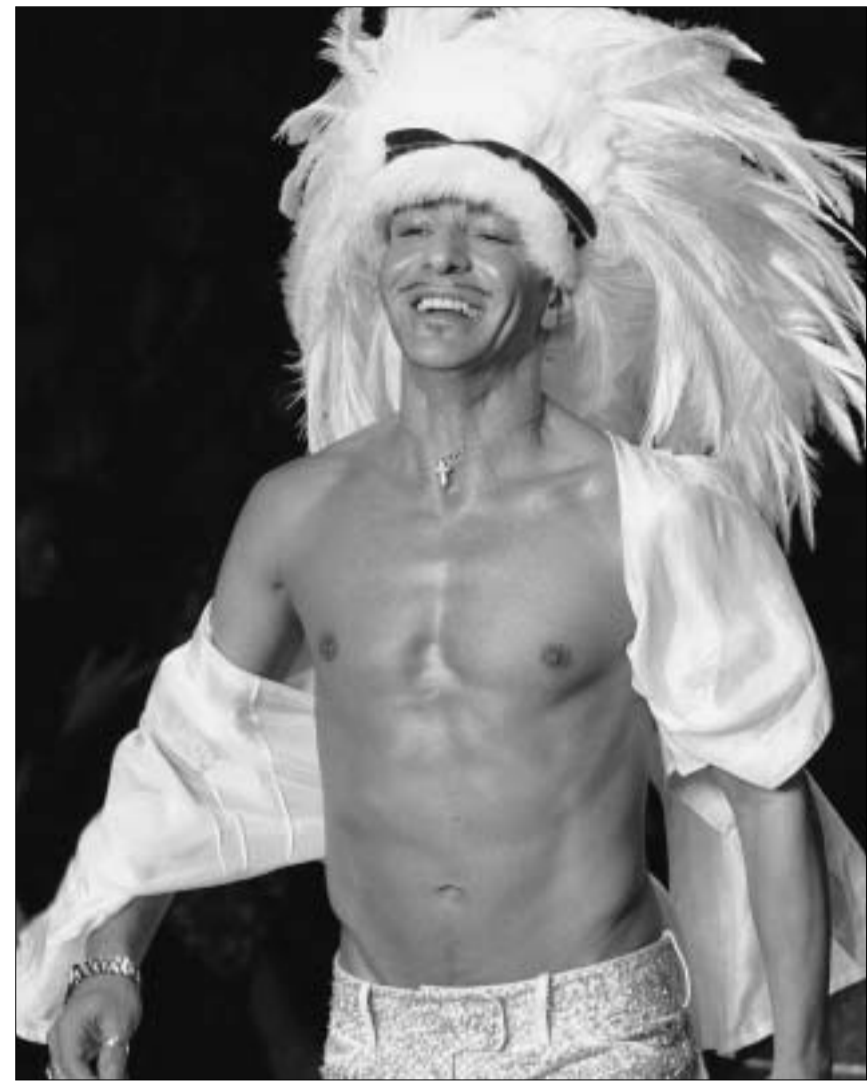
გალიანო შოუს დასასრულს