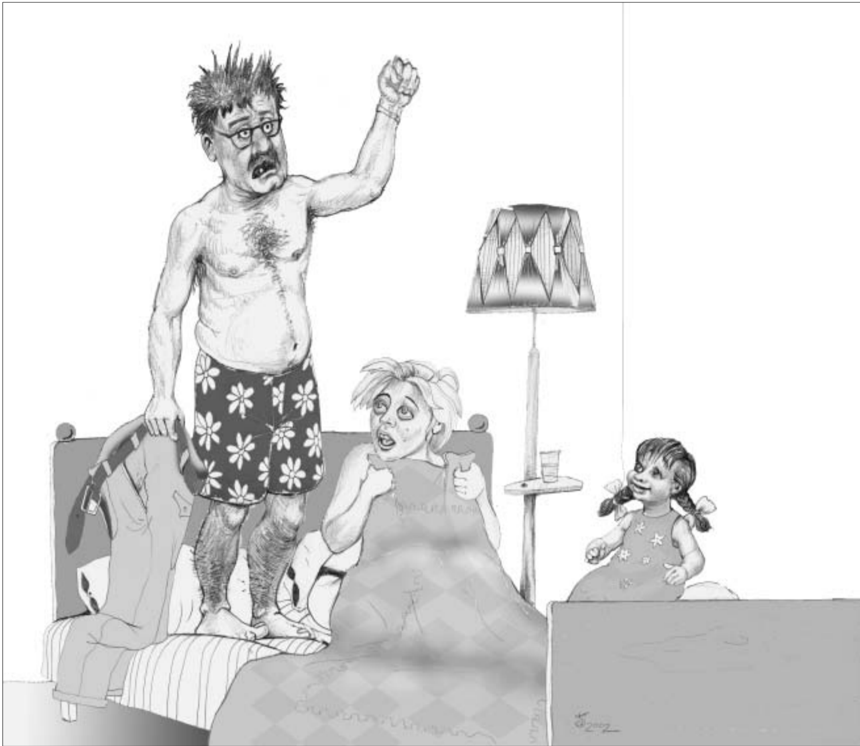
ლაშა ბუალავის ნახატი