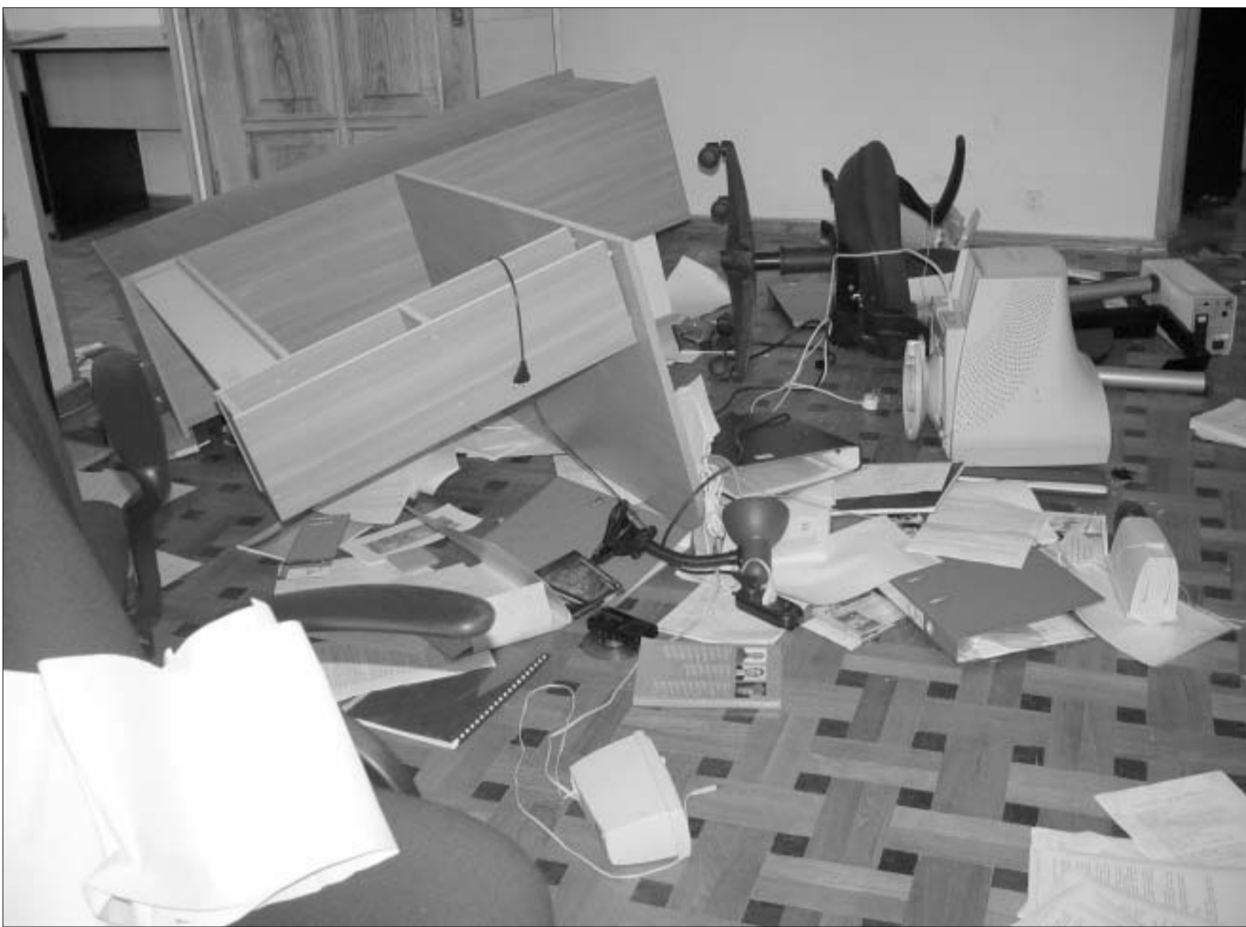
“თავისუფლების ინსტიტუტის” დარბეული ოფისი

“რაც შეიძლება, მალე უნდა მოვიფინო ნათელი ამ ფაქტს. ჩვენ ვითვითობთ, შევაჯამებ ყველა ოპერატიული ინფორმაცია, რომელიც