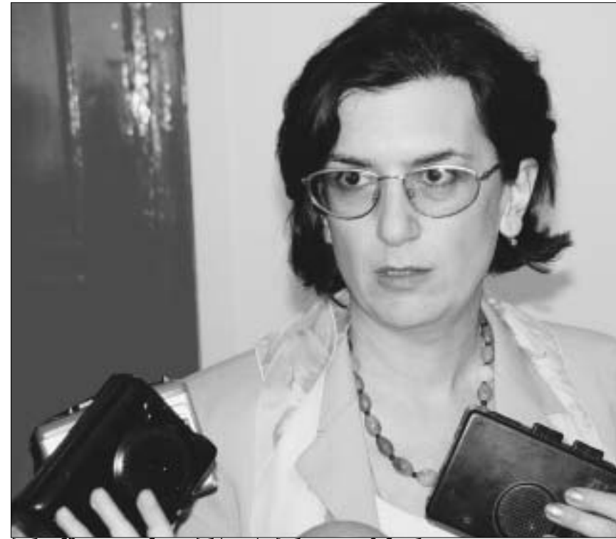
ბერლინში გადატანილი ბრძოლის პირველი კომენტარი