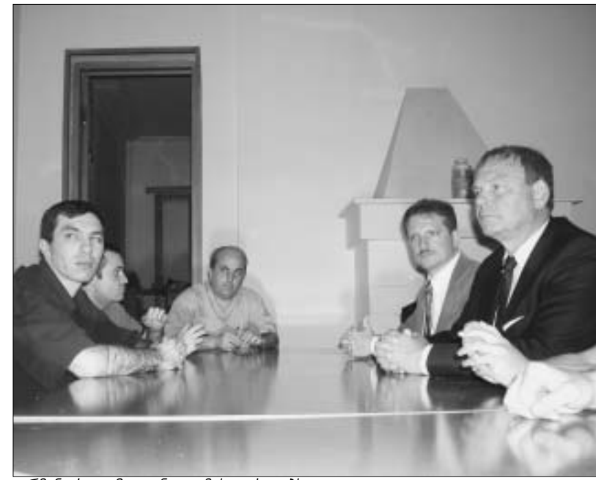
გერმანიის ელჩი თანადგომას უცხადებს თავისუფლების ინსტიტუტს

ბულ თავდასხმებს. “ჩვენ ყოველთვის ვგმობდით ძალადობის ასეთი ფორმების გამოყენებას, მით უფროც, პოლიტიკაში. ჩვენ აქ მოვედით, რათა დავგმოთ ეს მოვლენები. აუცილებელია, რომ შესაბამისმა ორგანიზაციებმა გამოიძიონ ეს საქმე და პასუხისმგებელნი დაამსჯებენ. რაც შეეხება პოლიტიკურ მოტივებს, ამაზე ლაპარაკი მოგვიანებით, გამოძიების შემდეგ უნდა გამართოს,” - ამბობს ელჩი.