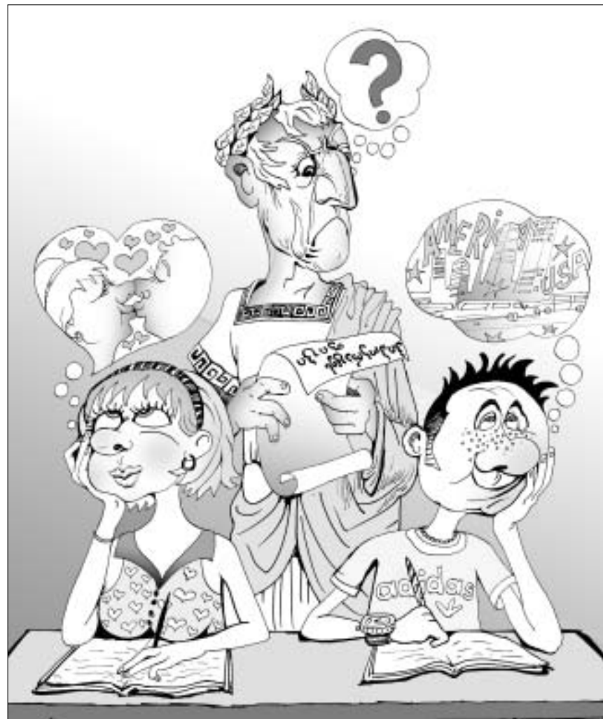
მამია ჯანაშიას მიხედვით

“ფანასკერტელის” მესვეურებს საკუთარი სტუდენტებისთვის ჰიპოკრატეს ფიცი ორივე საართულზე ავეთ გამოკრული, პირველზე - კოლეგისთვის და მეორეზე - უნივერსიტეტისთვის.