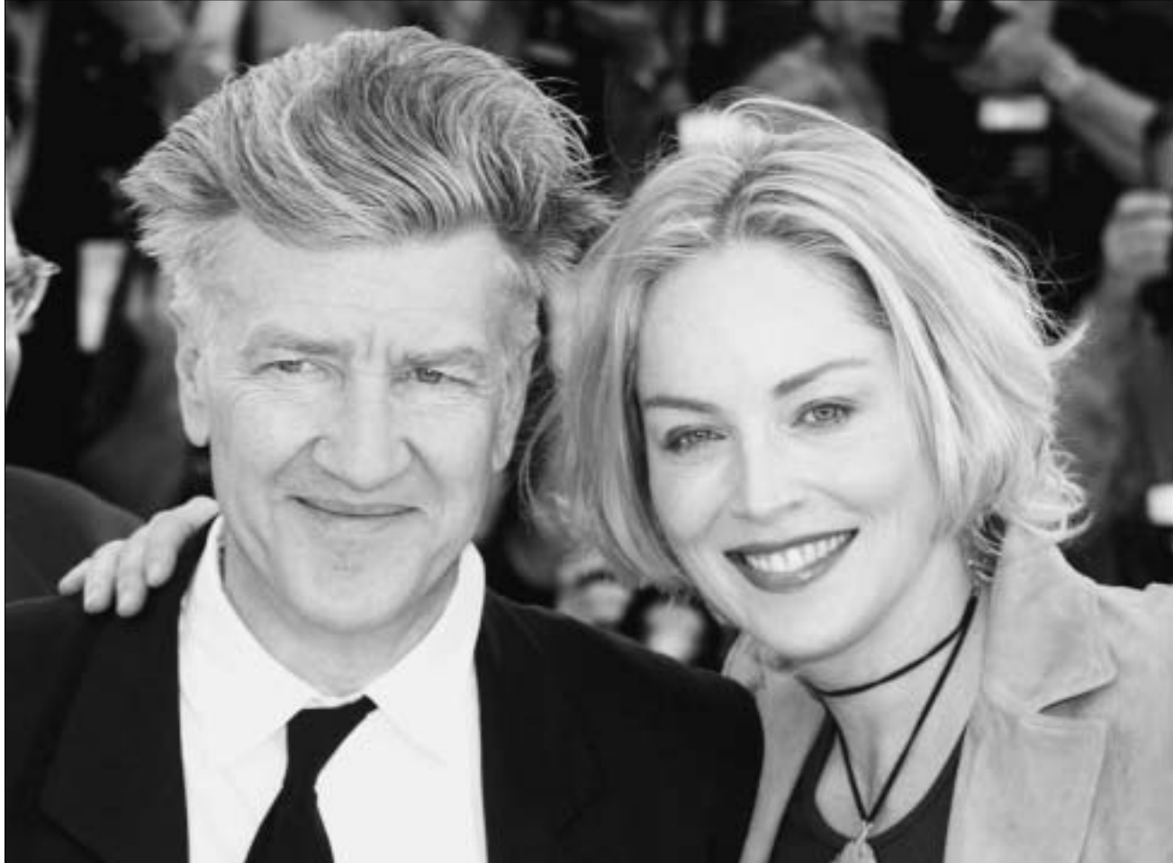
შერონ სტონი და რეჟისორი დევიდ ლინჩი

შერონ სტონი გადასალბე მოედანს უბრუნდება. ის ერთდროულად ორი ფილმის სცენარს განიხილავს. "სხვაგვარი ერთგულება" დრამაა და მასში სტონის პარტნიორი მოყვარულები ლიზინგის წესით დაქირავებული იპოდრომის შესყიდვას მოახერხებენ. რომ არა სპილბერგის ხელგამ-