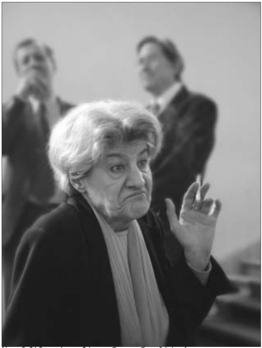
მადლიან მძიმე კითხვა დამისვით. არ ვიცი, რა გიპასუხობთ.

ე-თ: არა, ეს მაშინ ხდება, როდესაც დაზარალებული მოგვმართავს. - კი მაგრამ, რა იცის დაზარალებულმა, რომელი პატიმრის შეწყა-