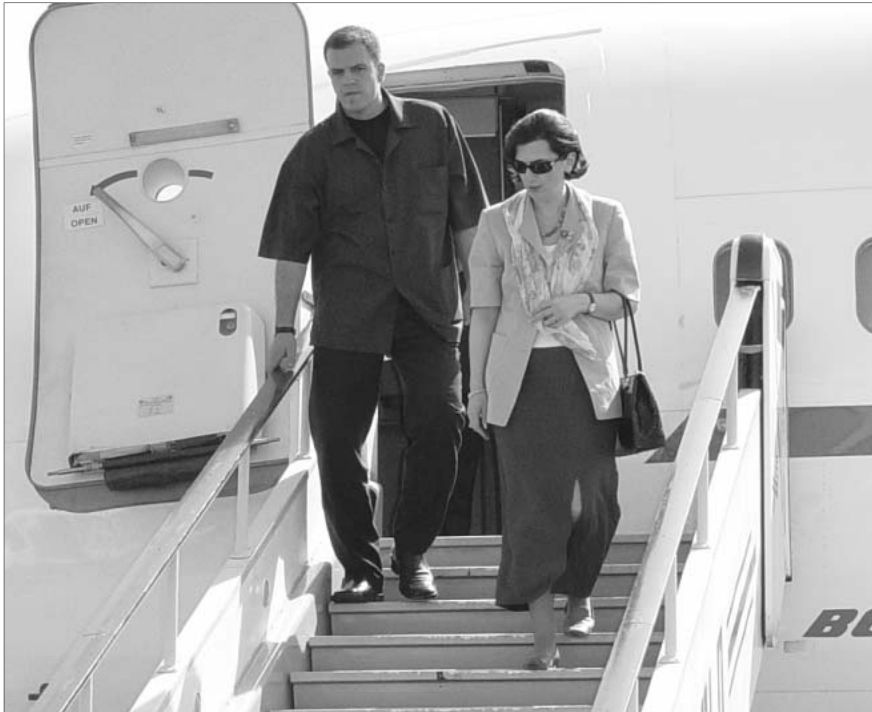
ბერლინში დანებებული დისკუსია სამი დღის შემდეგ პეტერბურგში გაგრძელდება