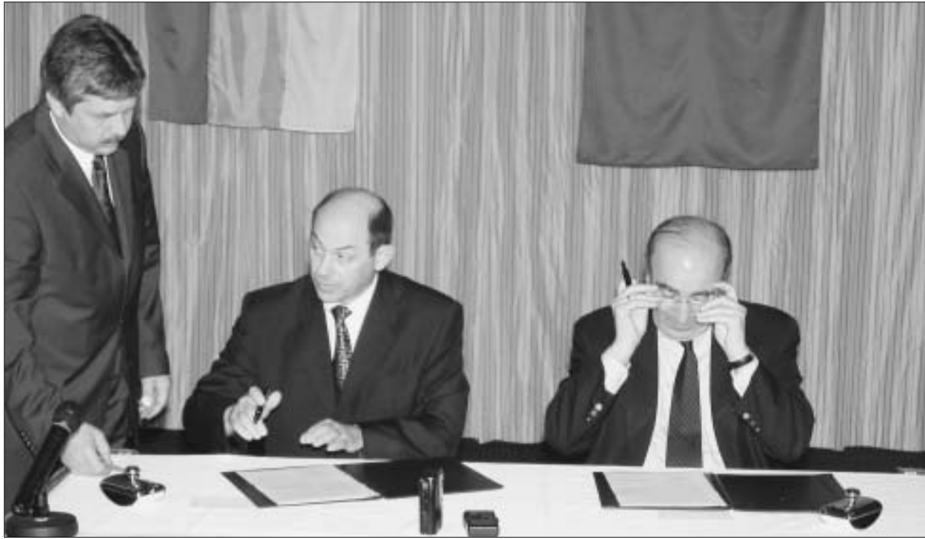
„ურთიერთგაგებისკარდისდერი ატმოსფერო“ მალე დაიწყო

გუშინდელ ერთობლივ პრესკონფერენციაზე, რუსეთის მიერ აფხა-