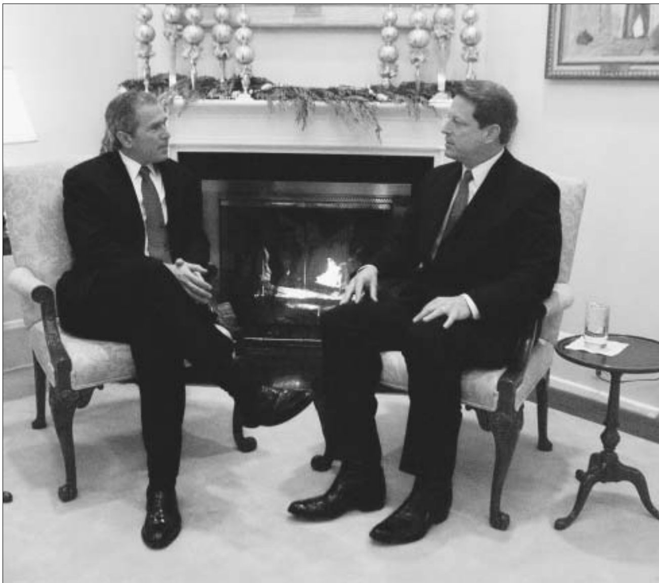
ვაშინგტონი. ვიკე-პრეზიდენტის რეზიდენცია

აშშ-ს ისტორიაში ერთ-ერთი ყველაზე სკანდალური არჩევნები, ფლორიდა, გაურკვეველობა, საბოლოო შედეგების დიდხანს არცოდნა - ყველაფერმა ამან ამერიკელები ორიოდ წლის წინ ძალიან დაღალა. თუმცა, რეჟისორისთვის ფლორიდაზე გათამაშებული პოლიტიკური პიესა მთავარენების წყარო აღმოჩნდა - ჯონ სელის ახალი ფილმის გადაღებაში სწორედ აშშ-ს 2000 წლის არჩევნები დაეხმარა. "არჩევნებმა საშუალება მომცა, ჩავღმრმავებოდი იმ იდეებს, რომლებიც დი-