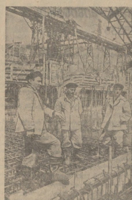
გაზეთის მდიარეობის მუშაკები მუშაობაში მონაწილეობენ...