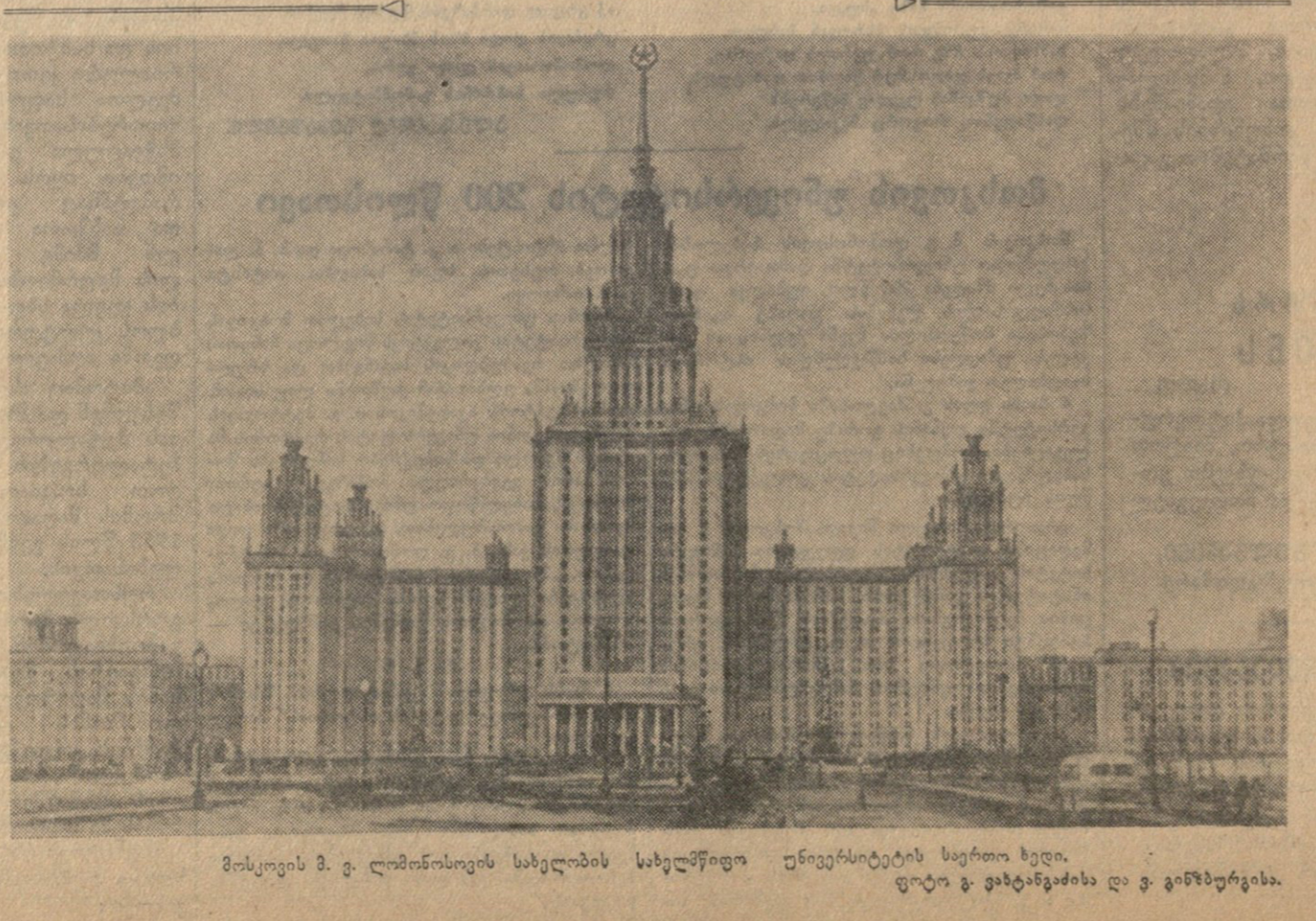
მოსკოვის მ. ვ. ლომონოსოვის სახელობის სახელმწიფო უნივერსიტეტის საერთო ხედი.