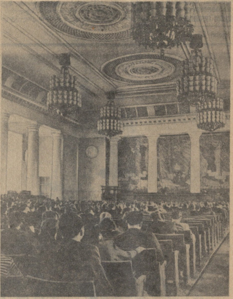
მოსკოვის უნივერსიტეტის საქო დარბაზის ხედი.