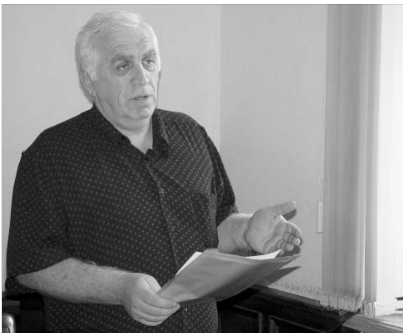
საოლქოს თავმჯდომარე ცესკოში ბოლო ინსტრუქტაჟს იღებს