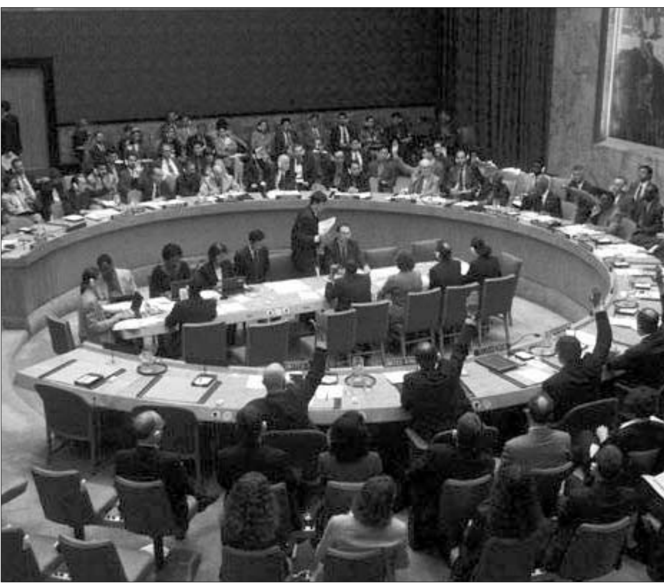
უშიშროების საბჭოს სხდომა

უშიშროების საბჭოს გადაწყვეტილებამ არაერთგვაროვანი რეაქცია გამოიწვია. ქვეყნების უმეტესობამ რეზოლუციის მიღება გონივრულ გამოსავლად ჩათვალა, მაგრამ როგორც კანადის ელჩმა განაცხადა, უშიშროების საბჭოს მიერ საერთაშორისო ხელშეკრულების ინტერპრტირების უფლების მინიჭება სახიფათო პრეცედენტს ქმნის.