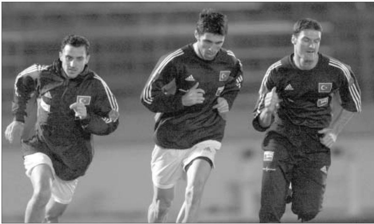
ქართველთა მომავალი მეტოქეები

საქართველოს ფეხბურთელთა ნაკრები 2004 წლის ევროპის ჩემპიონატის შესარჩევი ტურნირისათვის ემზადება. ეროვნული ნაკრების ხელმძღვანელობასა და საქართველოს ფეხბურთის ფედერაციას სწორად სპარინგ-პარტნიორების არასწორ შერჩევაში აღნაშაულებდნენ და, ალბათ, სამართლიანადაც. 21 აგვისტოს საქართველოს ნაკრების მორიგი მეტოქე უნდა ყოფილიყო ესტონეთის გუნდი. მიუხედავად იმისა, რომ ესტონელებმა მსოფლიო ჩემპიონატის დაწყების წინ რუსეთის გუნდს მოუგეს, ქართველთა გულშემატკივარი ბალტიისპირელთა სპარინგ-პარტნიორობას საკმაოდ სკეპტიკურად შეხვდა. გუშინ საღამოს კი გაირკვა, რომ, ესტონელთა ნაცვლად, ჩვენი გუნდის მეტოქე დასრულებული მსოფლიო ჩემპიონატის მესამე პრიზორი თურქეთის ნაკრები იქნება. ეს კი ნამდვილად სერიოზული მიღწევაა. ეროვნული ნაკრები შეხვედრას, 21 აგვისტოს, ტრაბზონში გამართავს. წინა დღეს ქალაქ რიზეში ერთმანეთს შეხვდებიან თურქეთისა და საქართველოს ახალგაზრდული გუნდები. საქართველოს ნაკრების ფეხბურთელები მოედანზე ახალი სათამაშო ფორმით გაველენ. ფედერაციამ ფირმა "ლოტოს" მიერ გამოგზავნილი სრული ეკიპირება მი-