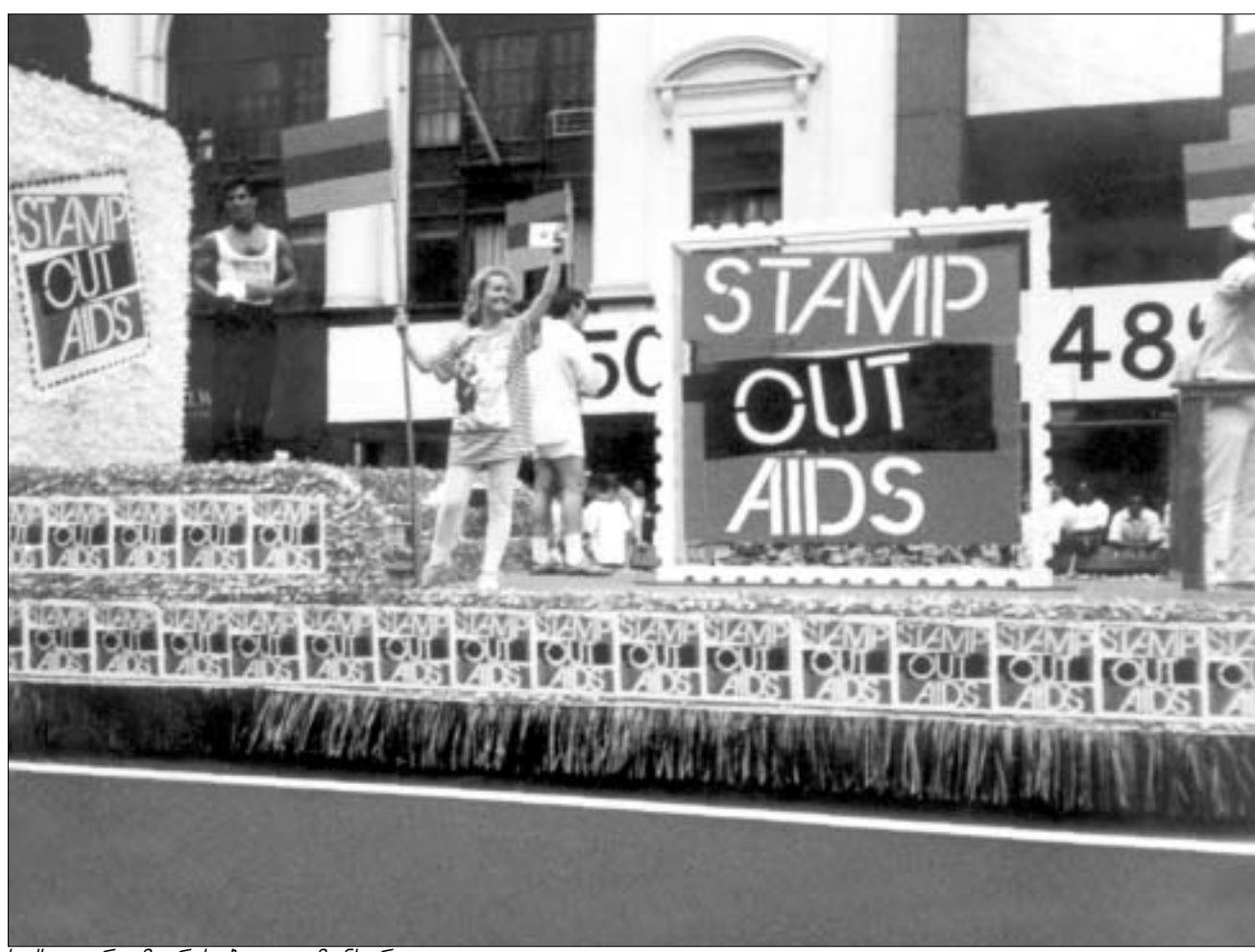
სექსუალურ უმცირესობათა დემონსტრაცია

სხვა ქვეყნებზე. თუმცა, როგორც აღმოჩნდა, ლატაკი ქვეყნებისთვის ასეთი შეღავათებიც არ არის გამოსავალი - მათ მთავრობებს თითოეულ ავადმყოფზე 500 დოლარის დახარჯვაც არ შეუძლიათ. არც საქართველო უკეთეს მდგომარეობაში - როგორც ცნობილია, ჯანდაცვისათვის გამოყოფილია სულ 9 დოლარი 1 სულ მოსახლეზე. მაგრამ, უნდა აღინიშნოს, რომ ამჟამად მოქმედებს ე.წ. "უსაფრთხო სისხლის, შიდსის და სქესობრივი გზით გადადებული დაავადებების პროფილაქტიკის სახელმწიფო პროგრამა", რომლისთვისაც გამოყოფილია 1,6 მილიონი ლარი. ამასთანავე, შექმნილია სამთავრობო კომისიები: ერთი - შიდსის, ხოლო მეორე - ნარკომანიის პრობლემასთან დაკავშირებით.