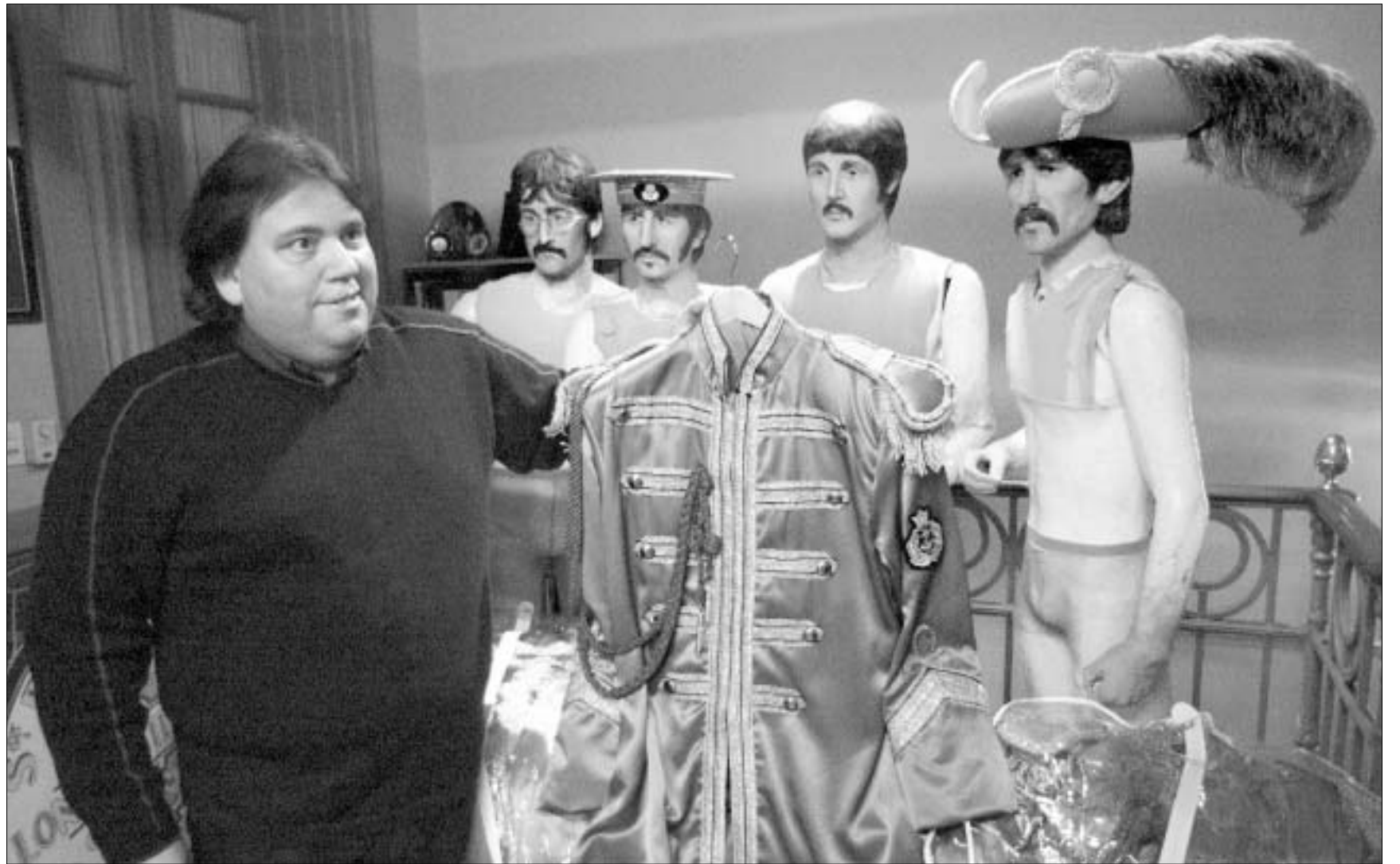
არგენტინელი კოლექციონერი წარმოგიდგინს "სერჟანტის" კიტლებს

ზის" გვერდით გამოჩნდნენ ახალი სუბერჯგუფები: "ჯიმი ჰენდრიქს იქსპერიენსი" და "კრიმი". შერ-ტებულ შტატებში ბობ დილანი უშვებს თავის საუკეთესო ალბომს Blonde on Blonde, შემოქმედების მწვერვალს აღწევს "ბი ბოიზი" (ალბომი Pet Sounds). კალიფორნიაში კი ადგილობრივი ბევრი ფიქრობდა, რომ დადგაროკ-ოლიმპზე "ბითლზის" შექმნის დასასრულია დრო. 1966 წლის დეკემბერში "ბითლზი" ახალ ალბომზე იწყებს მუშაობას. ჯგუფის წევრები ფაქტობრივად გადასახლდნენ ები როუდის სტუდიაში. პროექტის სრულფასოვანი განხორციელება, როგორც ჯგუფის წევრების, ასევე ტექნიკური პერსონალის უდიდესი შრომისა და ძალისხმევის ფასად ხერხდება. ჯორჯ ჰარისონი: "ინტენსიური საკონცერტო ტურნეების გამო სტუდიაში ხანგრძლივ მუშაობას ვერ ვახერხებდით. სტუდიაში უკვე გამზადებული კომპოზიციები მოგვქონდა. ამჟამად მთელი მუშაობა სტუდიაში მიმდინარეობს, ყველაფერს წელიდან ვიწყებთ, ვირჩევთ ყველაზე რთულ გზას". პოლ მაკარტნი: "თავიდანვე, როდესაც ალბომზე მუშაობა დაიწყო, მე შევთავაზე დაგვევიწყებინა ყველაფერი, რაც მანამდე გვექონდა შექმნილი, ნავსულიყავით მაქსიმალურად ექსპერიმენტული გზით. ჩავთვალთ, რომ ეს იყო დროის გამოყენება და ჩვენც არ შეგვეძლო, იგი არ მიგვეღო".