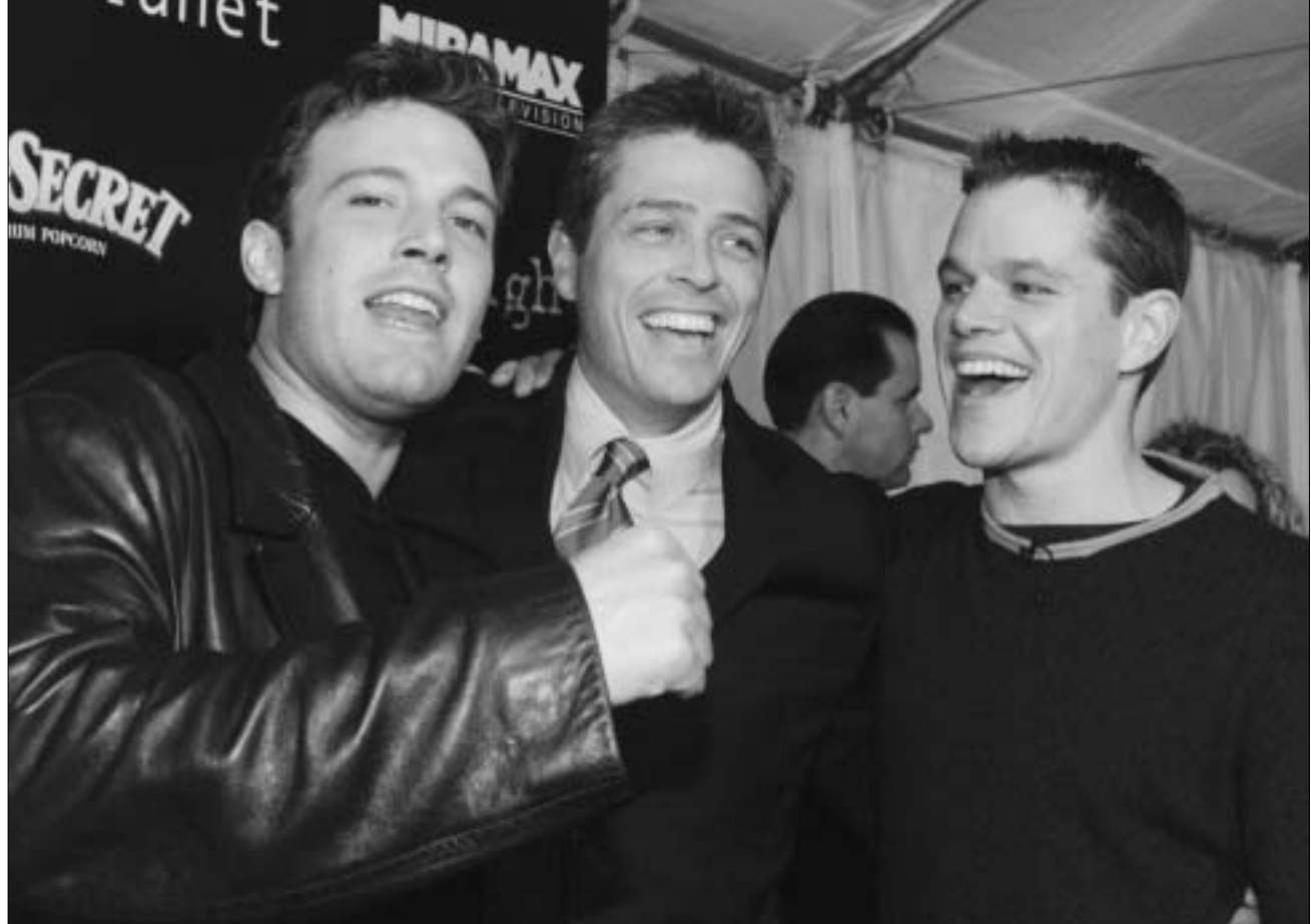
მეტ დეივონი და ბენ აფლეკი თავიანთ აგენტთან ერთად

პირველი წარმატების შემდეგ, რომელიც "ოსკარი" დასრულდა, მეტ დეივონი და ბენ აფლეკი ერთმანეთს აღარ დაშორებინ. წყვილმა დამწყები რეჟისორების დახმარებაც გადანიჭა და საკუთარი კომპანიის Liveplanet Productions-ის ფარგლებში ყოველწლიურ კონკურსს Project Greenlight-ს (პროექტი მხვანე შუქი) ჩაუყარა საფუძველი. კონკურსის გამარჯვებულ სცენარისტს ისინი ფილმის გადაღებისათვის საჭირო ფინანსებით უზრუნველყოფენ.