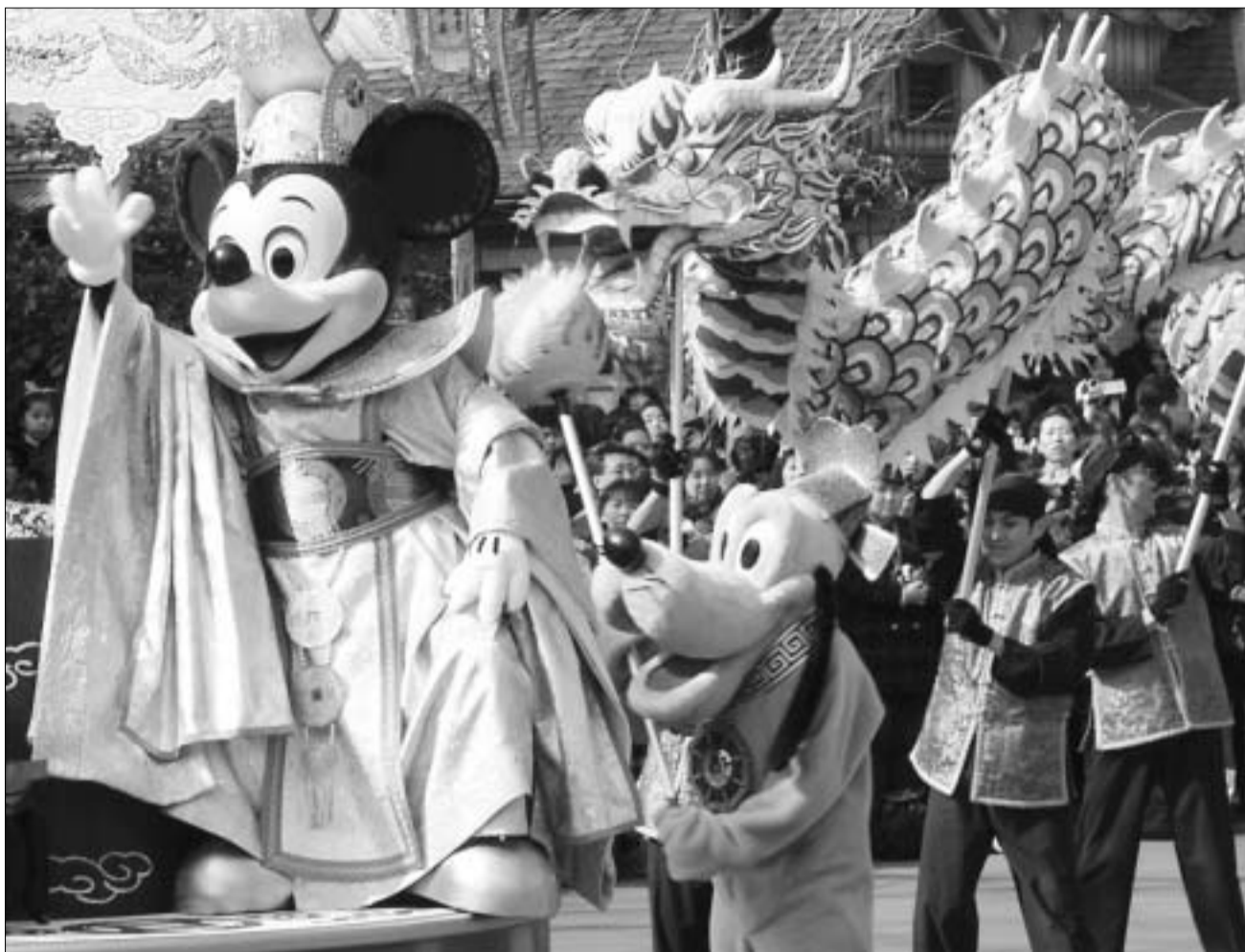
იაპონელი მიკი მაუსი ტოკიოელ ბავშვებს ართობს