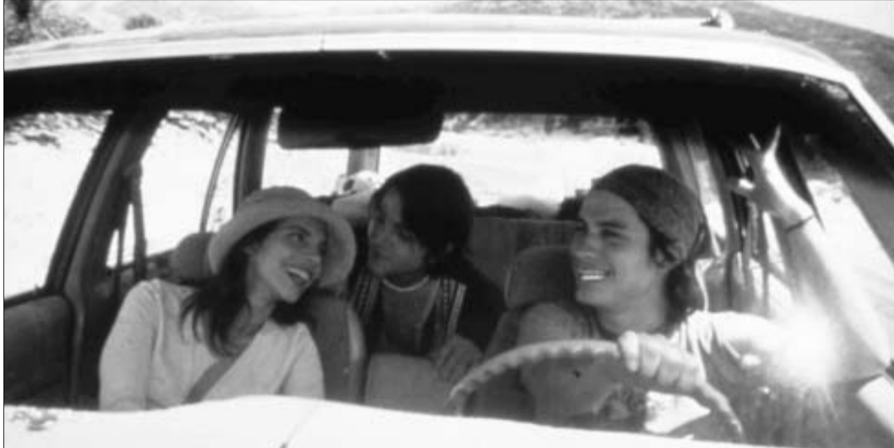
კადრი ფილმიდან 'Y Tu Mama Tambien'