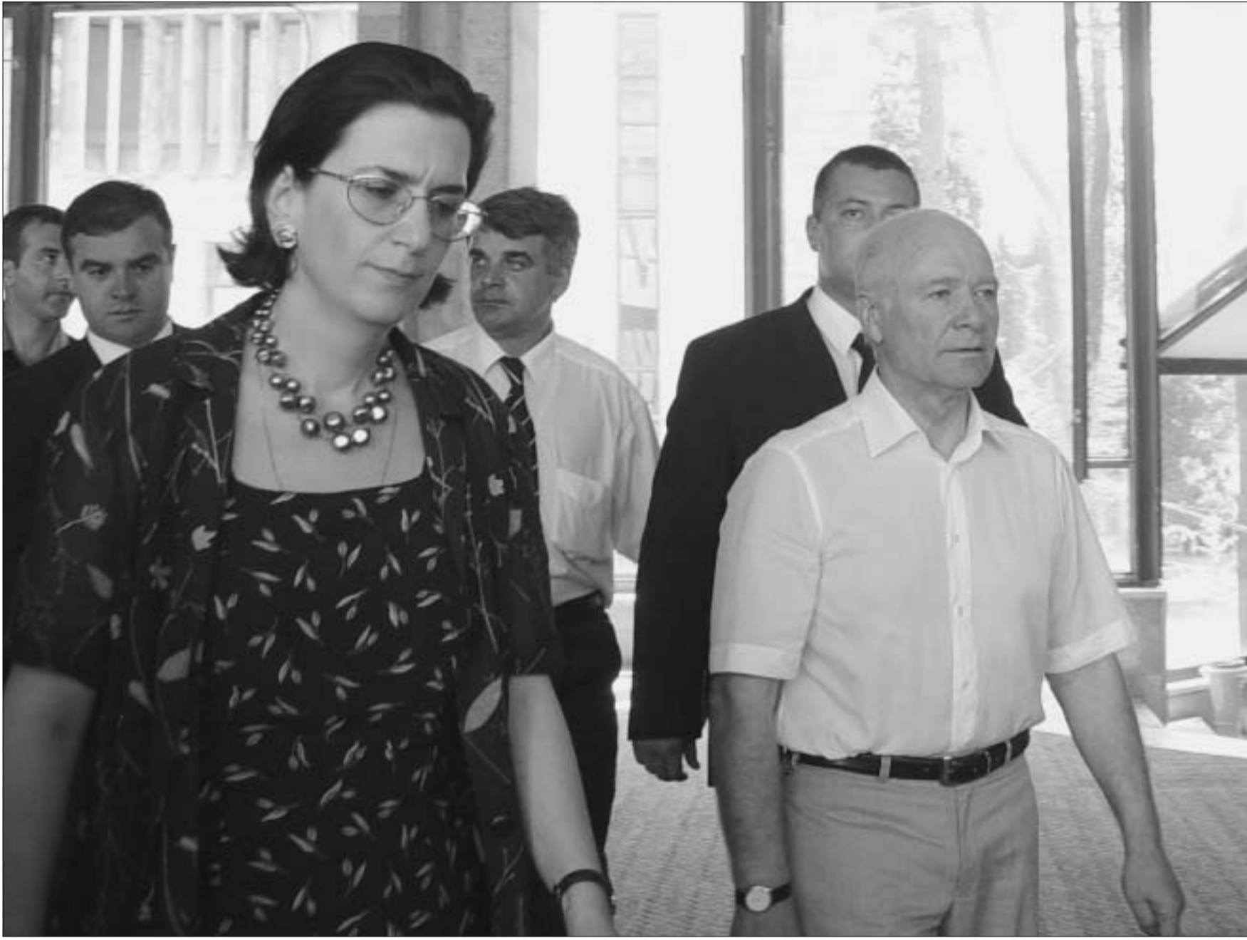
ასლან აბაშიძის სტუმრობაზე "ქობულეთური ბიურო" პრეზიდენტის და საზოგადოების ყურადღების ცენტრში უცბათ მოაქცია

ქობულეთში სამუშაო განწყობაზე დადგომა ძალზე ძნელი გახლავთ. მით უმეტეს, როცა მზე ძალიან წვეს, ზღვა კი ისე თბილია და წყნარი, ყველაზე პატიოსანი პარლამენტარსაც რომ თამამად შეაცდენს. ამიტომ ქობულეთური ბიურო, განსახილველი თემების სერიოზულობის მიუხედავად, მაინც დასასვენებლად "განწირულ" თავმოყობად მოგვეჩვენებოდათ. როგორ ისვენებდნენ ბიუროს წევრები ქობულეთში, ცალკე თემაა და ამის ჩვენს უახლოეს ნომერში კიდევ დავუბრუნდებით. მანამდე კი ორიოდე სიტყვა იმაზე, თუ დახუთულ და სიცხით სავსე დარბაზში როგორ შეიქმნა ატმოსფერო, რომელსაც სკანდალები უკვე მოჰყვა და, სავარაუდოდ, კიდევ მოჰყვება.