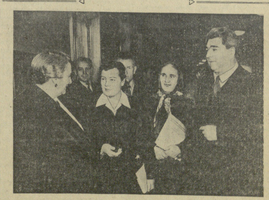
მოსკოვი. კრემლის დიდ სასახლეში, საბჭოთა კავშირის კომუნისტური პარტიის XX ყრილობის 22-ე სესიის 22-ე დღის სხდომა. სსრკ-ის კომუნისტური პარტიის ცენტრალური კომიტეტის წევრები შეხვედრის დროს.