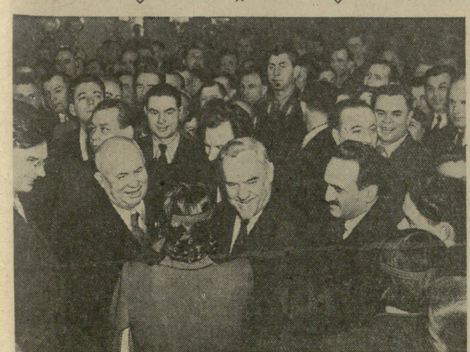
მოსკოვი. საბჭოთა კავშირის კომუნისტური პარტიის XX ყრილობის 22-ე სესიის 22-ე დღის სხდომა. სსრკ-ის კომუნისტური პარტიის ცენტრალური კომიტეტის წევრები შეხვედრის დროს.

საბჭოთა კავშირის კომუნისტური პარტიის XX ყრილობის 22-ე სესიის 22-ე დღის სხდომა