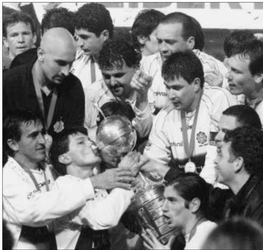
"ოლიმპიას" ფეხბურთელები ლიბერტადორის თასით

ბრაზილიელებს თითქოს უკვე განადგობილი ჰქონდათ ლიბერტადორის თასი, თუმცა "ოლიმპიამ" მატ-