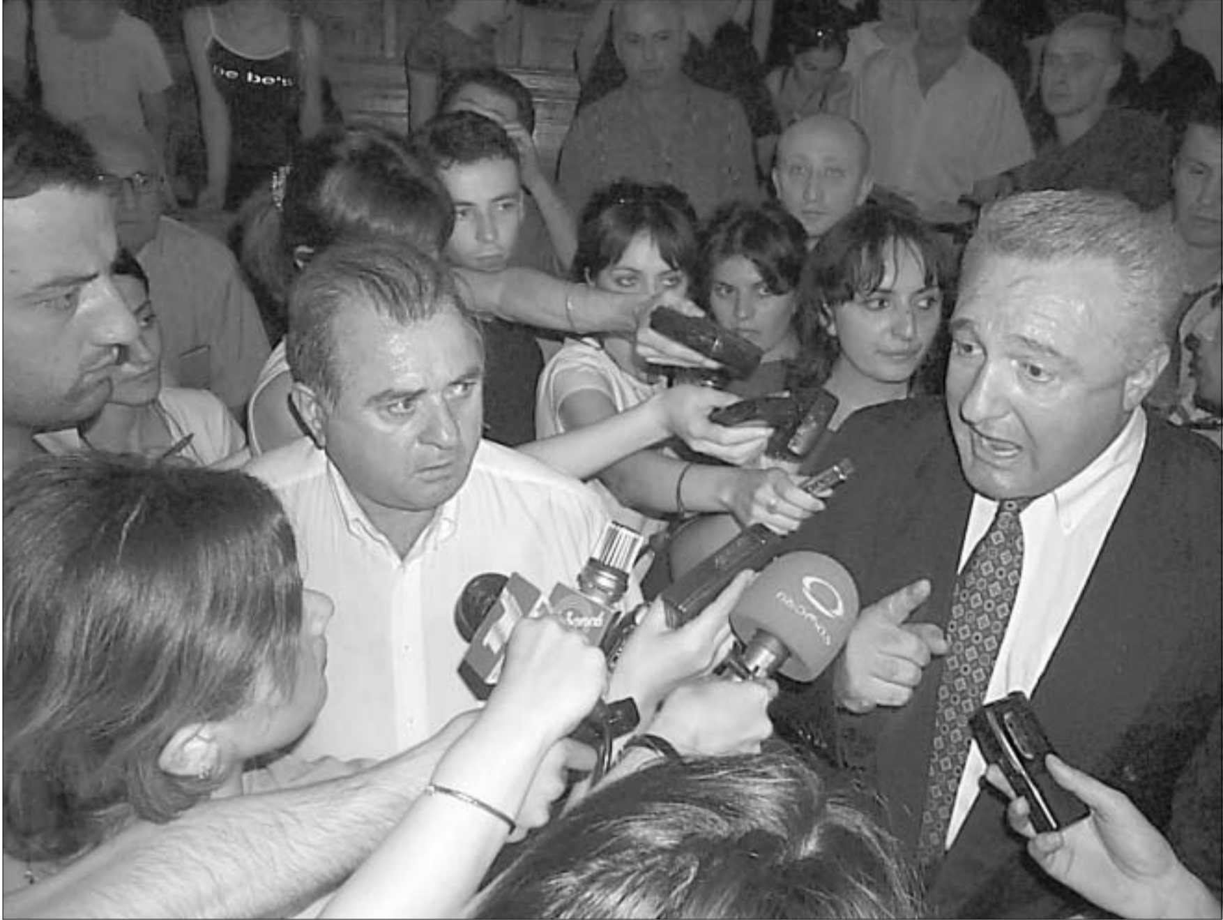
შამიაშვილი დევნილებს შიმშილობებისა და აქციების ჩატარებისკენ მოუწოდებს

თამაზ ნადარბივნილი და ნანაპირები შეასრულა და აფხაზეთის დაბრუნების პროცესში 1 აგვისტომდე ჩაურევლობის მორატორიუმი აფხაზეთის უზუნაესი საბჭოს სხდომაზე საზეიმოდ მოხსნა. სხდომა ნაკლებად საზეიმოდ განვიტარდა დეპუტატ ჯემალ გამახარიაშვილის, თუმცა, ამის შესახებ მოგვიანებით. საგანგებო სესიამდე საკონსტიტუციო სასამართლოს შენობის წინ დევნილთა სამიათასიანი აქცია დაიწყო. ნადარბივნილი დღეიდან აფხაზეთის საკითხებს საკუთარი გეგმის მიხედვით მოაგვარებს. გუშინდელ საგანგებო სესიაზე მან აფხაზეთის ლეგიტიმური აღმასრულებელი ხელი-სუფულება მთლიანად დაითხოვა. გააყენებულია ყველა მინისტრი, რეგორმა არ შეეხი მხოლოდ სასამართლო ხელისუფლებას. ახალი მთავრობა ათ დღეში დაკომპლექტდება და ნადარბივნილის კურსის მონინალმდეგებს იქ ადგილი აღარ ექნება. “დღეიდან აფხაზეთის მთელ ტერიტორიაზე მინა 24 საათის განმავლობაში უნდა იწვიოდეს, დამსვენებლები იქიდან შიშით უნდა გაბრუნდნენ”, - აცხადებს თამაზ ნადარბივნილი და მორატორიუმისგან ათავისუფლებს პარტიზანებს. მთავარ მოკავშირედ მას იმერეთის რწმუნებული თემურ შამიაშვილი ეგულება, რომელიც ასევე ესწრებოდა გუშინდელ სხდომას და რომელიც ლეგიტიმურ ხელისუფლებას მორალურ და ბატერიალურ მხარდაჭერას აღუთქვამს. შამიაშვილი დევნილებს, შემოდგომიდან, მთელი საქართველოს მასშტაბით, შიმშილობებისა და აქციების ჩატარებისკენ მოუწოდებს და შპირდება, მეც თქვენთან ერთად ვიმშობილებო.