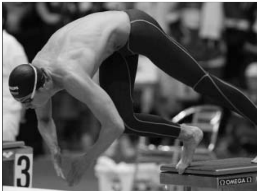
პეტერ ვან დენ შოგენბანდი

ყოველივე მსოფლიო რეკორდს ეყოფოდა, - ასპარეზობის შემდეგ განაცხადა კამერლინგმა.