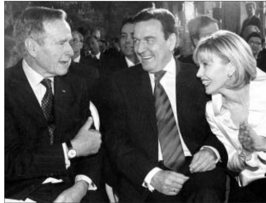
უფროსი ჯორჯ ბუში და გერჰარდ შროდერი მეუღლესთან ერთად.