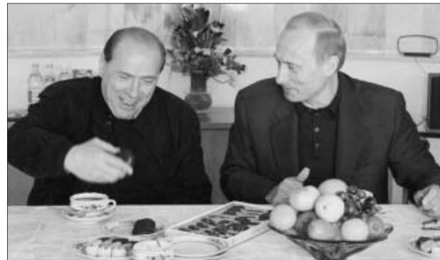
სილვიო ბერლუსკონის 'რუსული არდადეგები'.

ანუ, შეიძლება ითქვას, რომ მოსაზრებამ – "პრეზიდენტიც ადამიანია", ამ მიყრუებულ სოფელშიც შეაღწია და ამიტომ საინტერესოა, ელრსებათ კი ბლერებს ნანატრი სიმშვიდე? თუმცა, ალბათ, მათთვის პატარა სოფლის მცხოვრებლების მოკრძალებული აღფრთოვანება გაცილებით უფრო იოლი ასატანი იქნება, ვიდრე გათავებებული პაპარაცების დევნა.