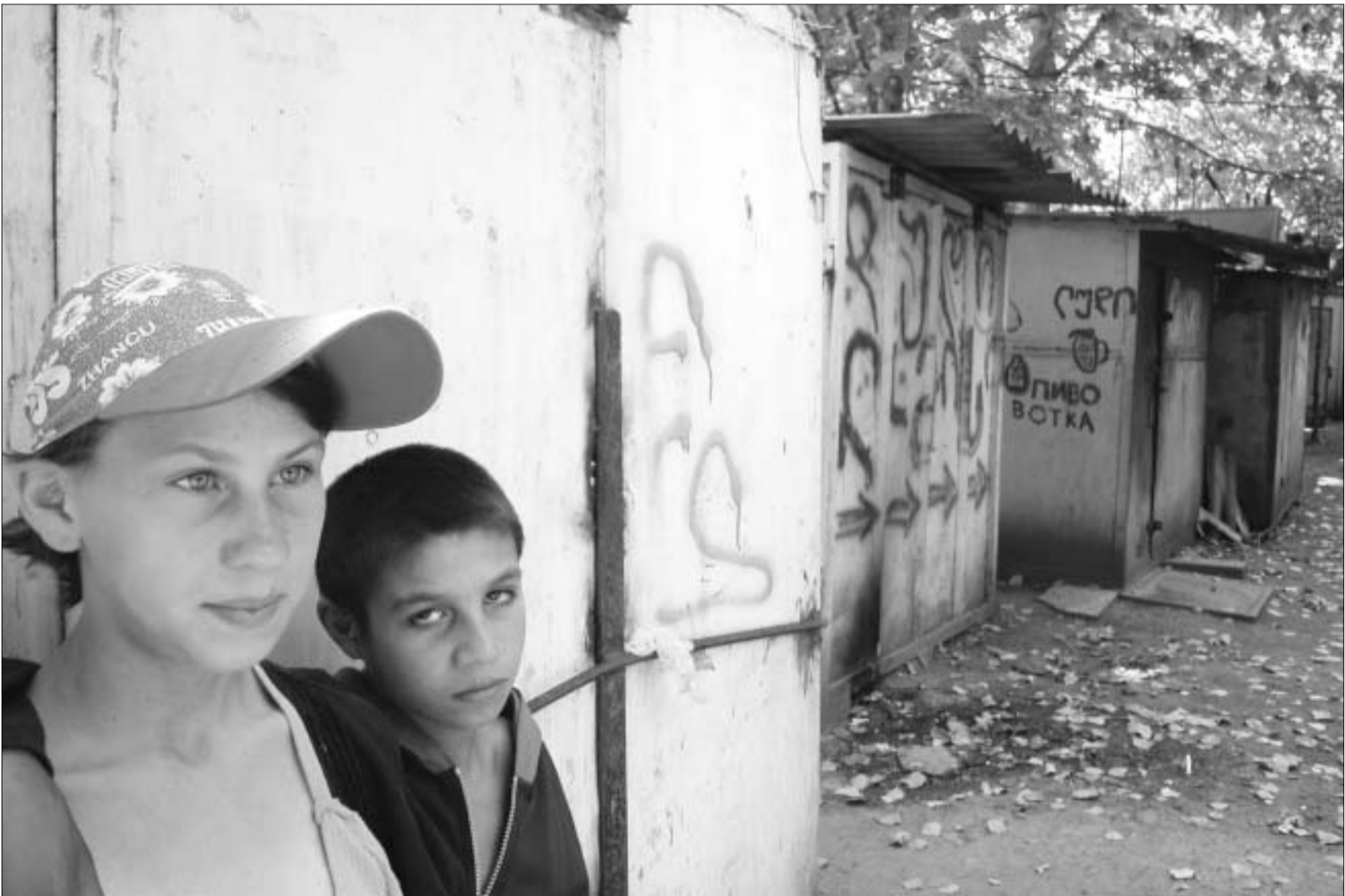
"ბავშვი და გარემოს" კონტინგენტი