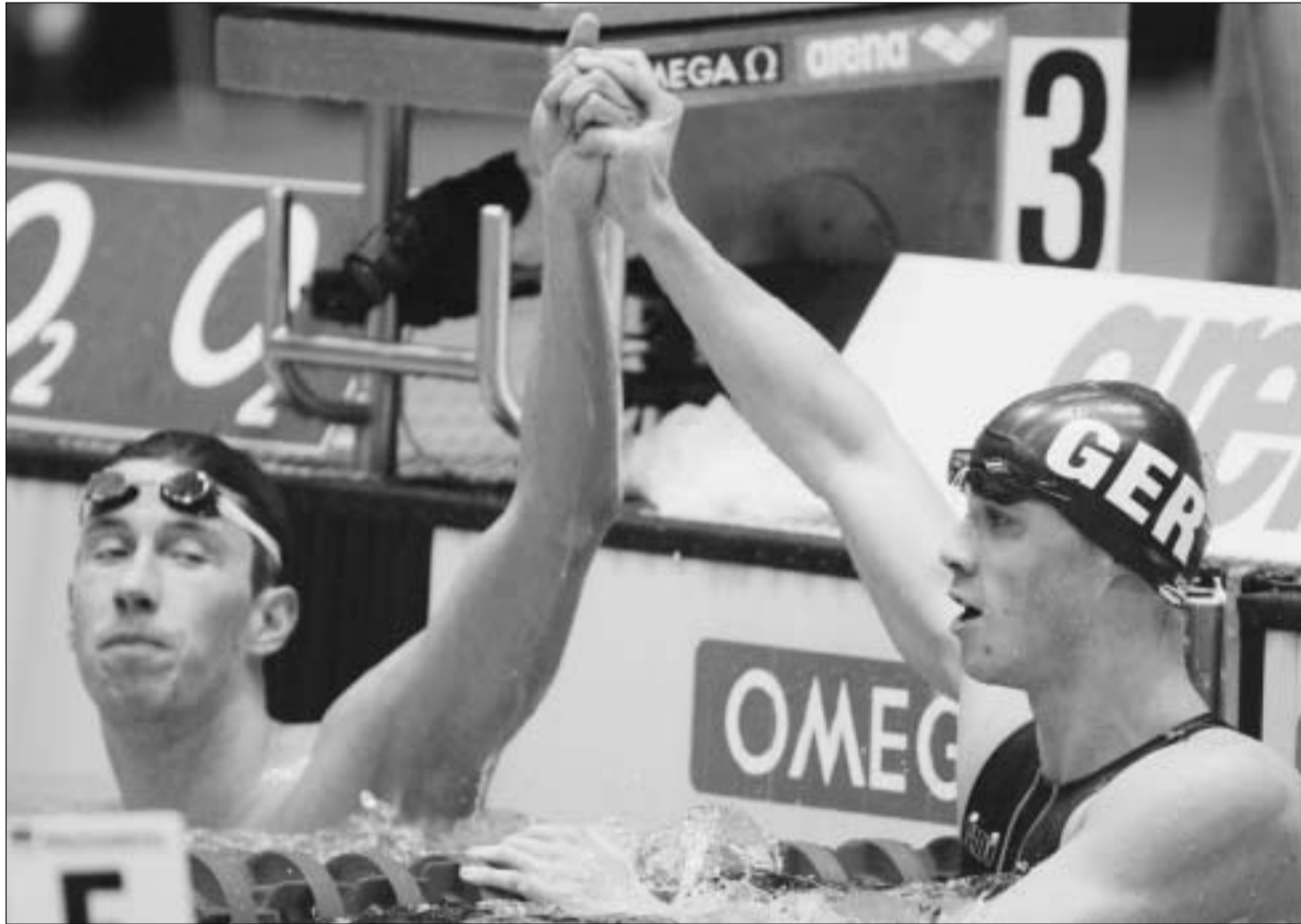
ტილოკი და რუპრატი

დაახლოებით ათი წლის წინათ აღმოსავლეთ და დასავლეთ გერმანია ერთმანეთს სამკედრო-სასიცოცხლოდ წაიკედებოდნენ. მათ შორის დაპირისპირება ყველაზე მეტად სპორტში აისახებოდა. წარმოვიდგინოთ, რომ ბერლინის კედელი ისევე თავის ადგილზე და მიმდინარეობს სანყოსნო სახეობათა ევროპის ჩემპიონატი. უდავოა, სტივ ტლოკსა და ტომას რუპრატს შორის დაპირისპირება გაცილებით უფრო მძაფრი იქნებოდა, ვიდრე, უბრალოდ, ასპარეზობა. თითოეული მათგანი საკუთარი ხელისუფლების წინაშე ქვეშ მოხედებოდა. რუპრატს დემოკრატიული დასავლეთის ფასეულობებისა და, შესაძლოა, თავისუფალი სამყაროს უპირატესობის ტვირთი უნდა ეზიდა, ხოლო ტლოკს კომუნისტური გერმანიის (ისევე როგორც საბჭოეთის) მზერა იქნებოდა მიყრობილი და იგი ყველანაირად ეცდებოდა საკუთარი უპირატესობის დამტკიცებას. საბედნიეროდ, ბერლინის კედელი აღარ არსებობს. არსებობს მხოლოდ სპორტული ჟინი, რომელიც ბერლინის საცურაო აუზს არ სცილდება.