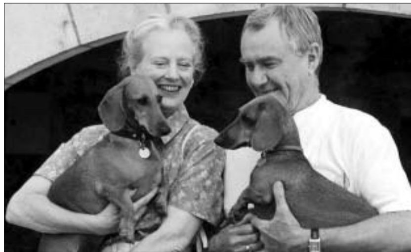
დანის მეფე-დედაფალი საზაფხულო რეზიდენციაში.