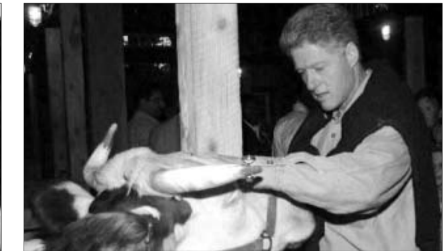
ბილ კლინტონი ფერმაში.