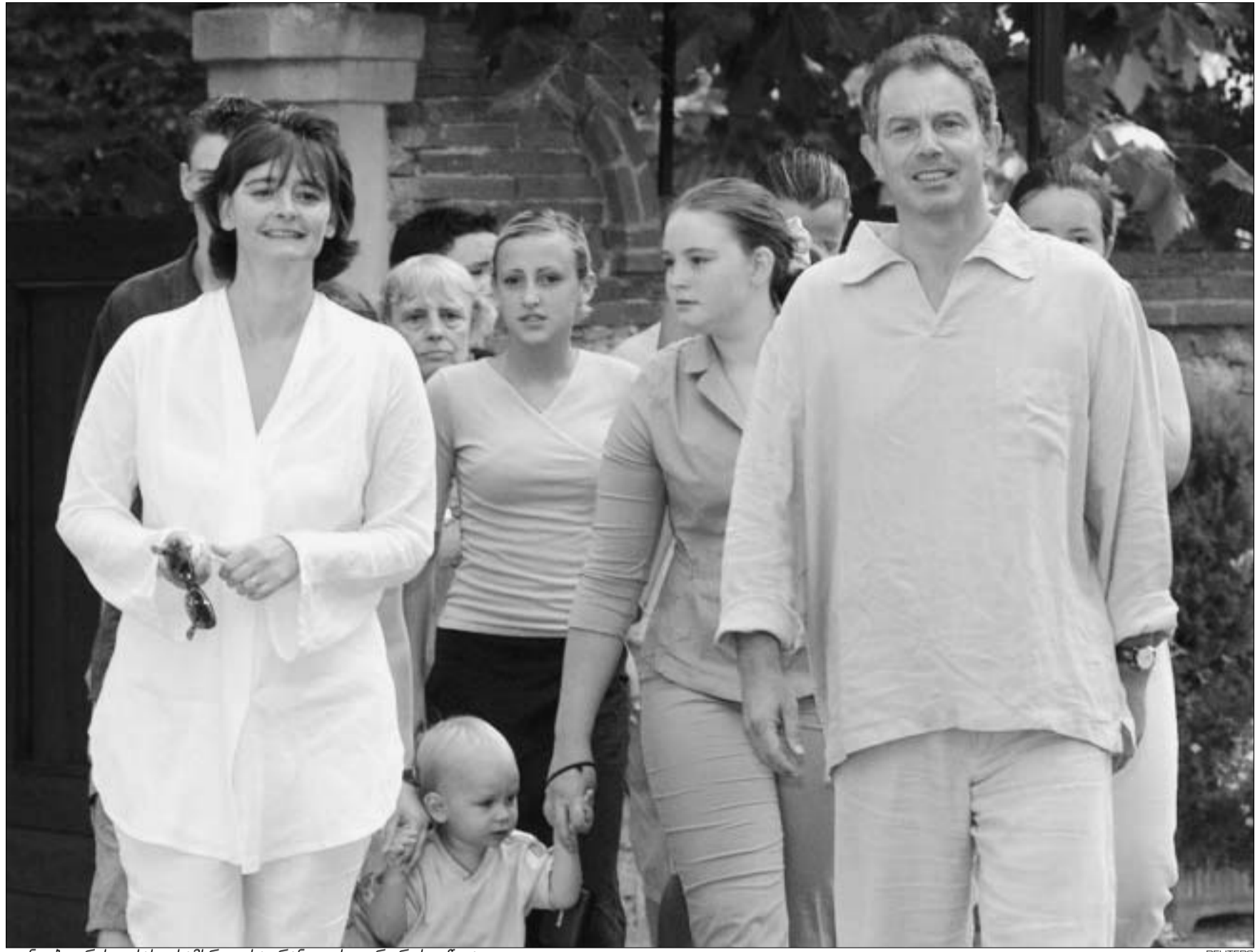
ტონი ბლერის ოჯახი სამხრეთ საფრანგეთის კურორტს უწვია.