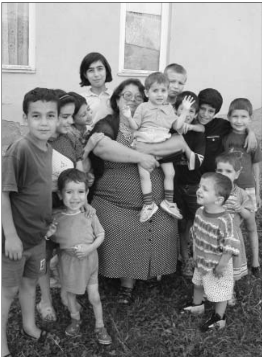
მასწავლებელი აღსაზრდებლებთან ერთად