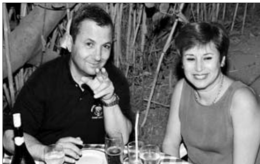
ეუდ ბარაკი მეუღლესთან ერთად სამხრეთ ისრაელის კურორტზე.