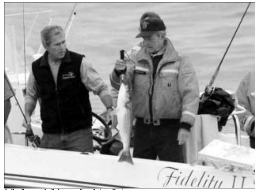
მამა-შვილი ბუშები თეზაბონის დროს.