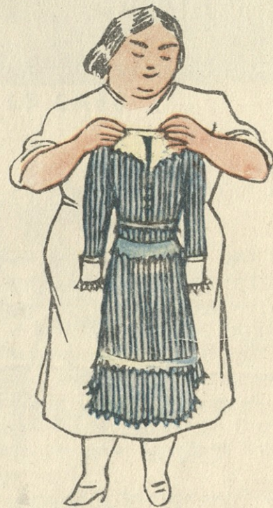
ეს ბანოვანი ტანწერწეტაც რომ ყოფილიყო, ასეთ კაბას მაინც ტანზე ვერ მოირგებდა.