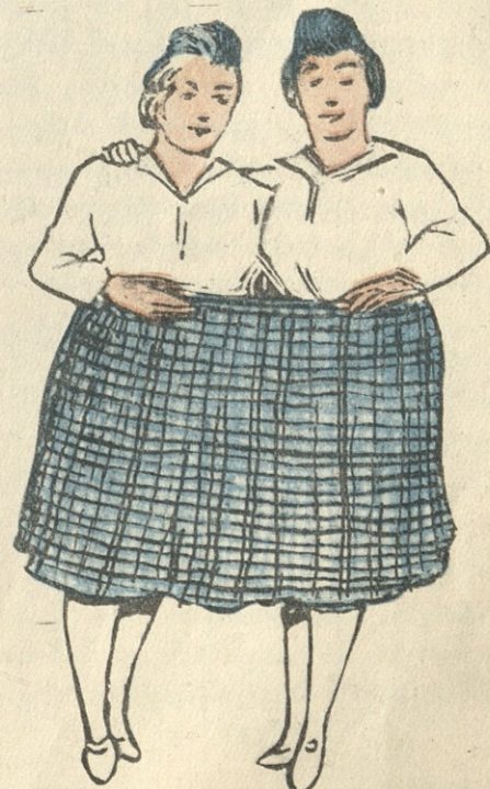
ასეთ კაბას კი ორი ქალის ცქრიალა ტანის გატარავენ.