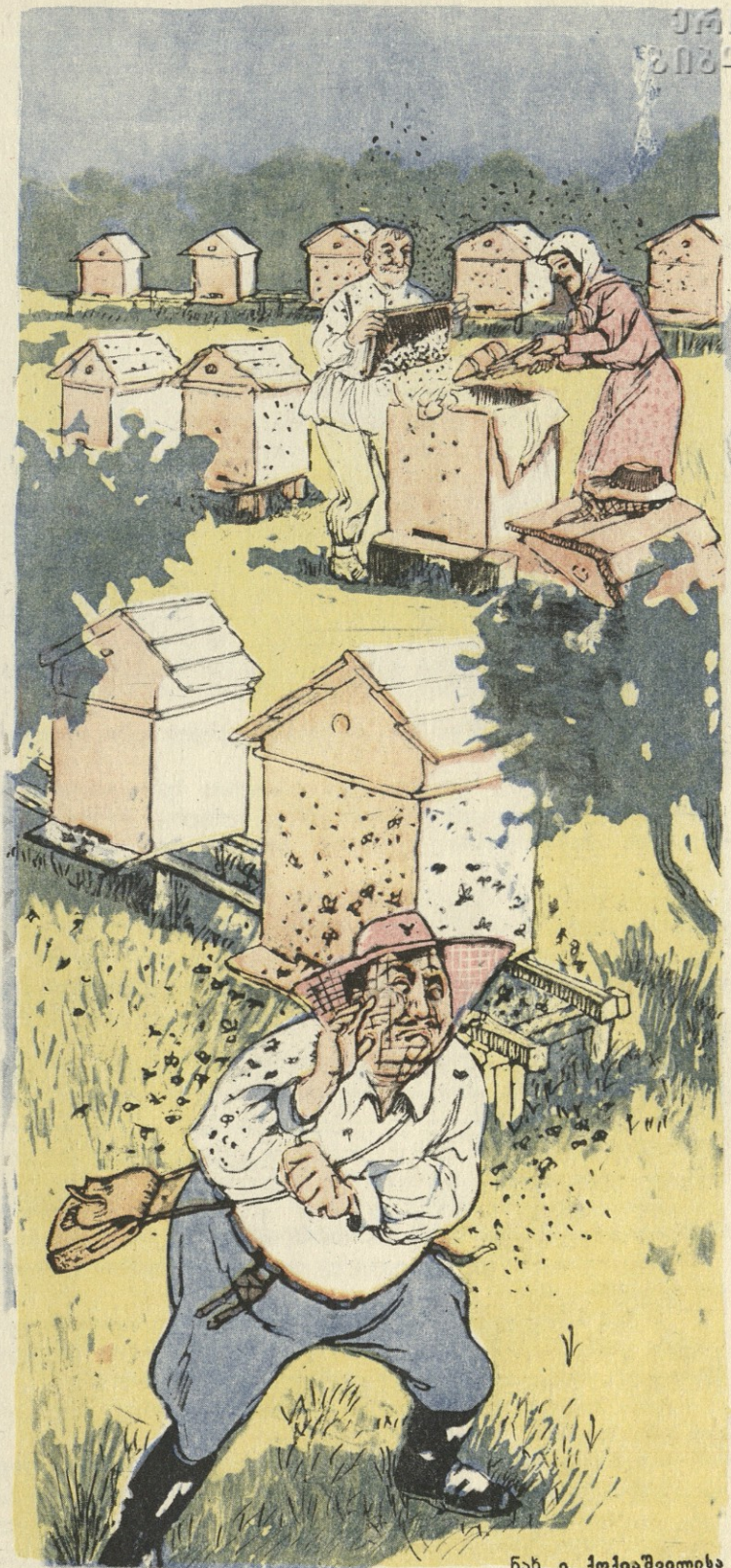
ნან. ი. ქიქიაშვილისა

სახ. მოსამართლემ ან. რეხვიაშვილმა ბრალდებულებს მიკირტუმოვსა და შადურს ს. ს. კ. 58 — 17 მუხ. „გ“ პუნქტის 1 ნაწილის მიხედვით მიუსაჯა თავისუფლების აღკვეთა თვითუფლებს 18 თვით. მაგრამ ქართულ ენას რომელი კანონის რომელი მუხლის რომელი პუნქტით ამახინჯებს, ეს ჩვენთვის გაურკვეველია.