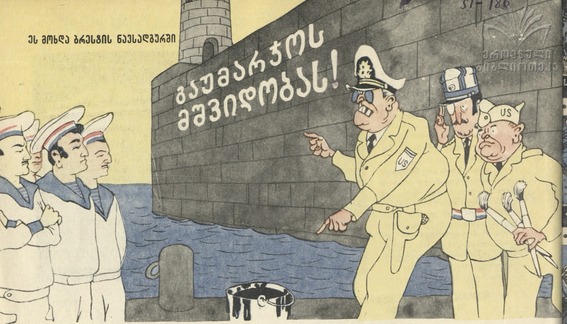
ფრანგ მეზღვაურებს უბრძანეს წარწერა კუპრით დაეფარათ...