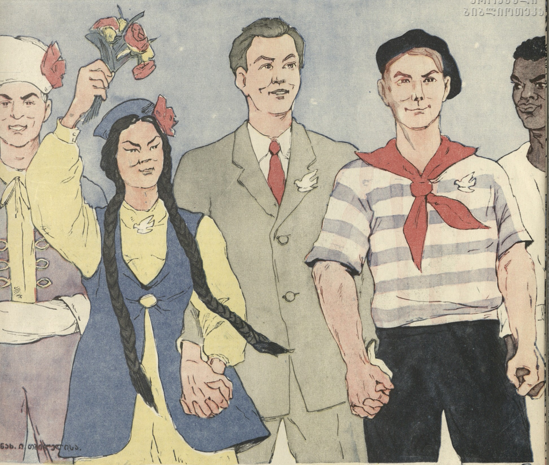
ნახ. ი. თბილისა.