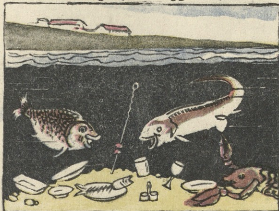
მტკვარში თევზსაც უხარია.