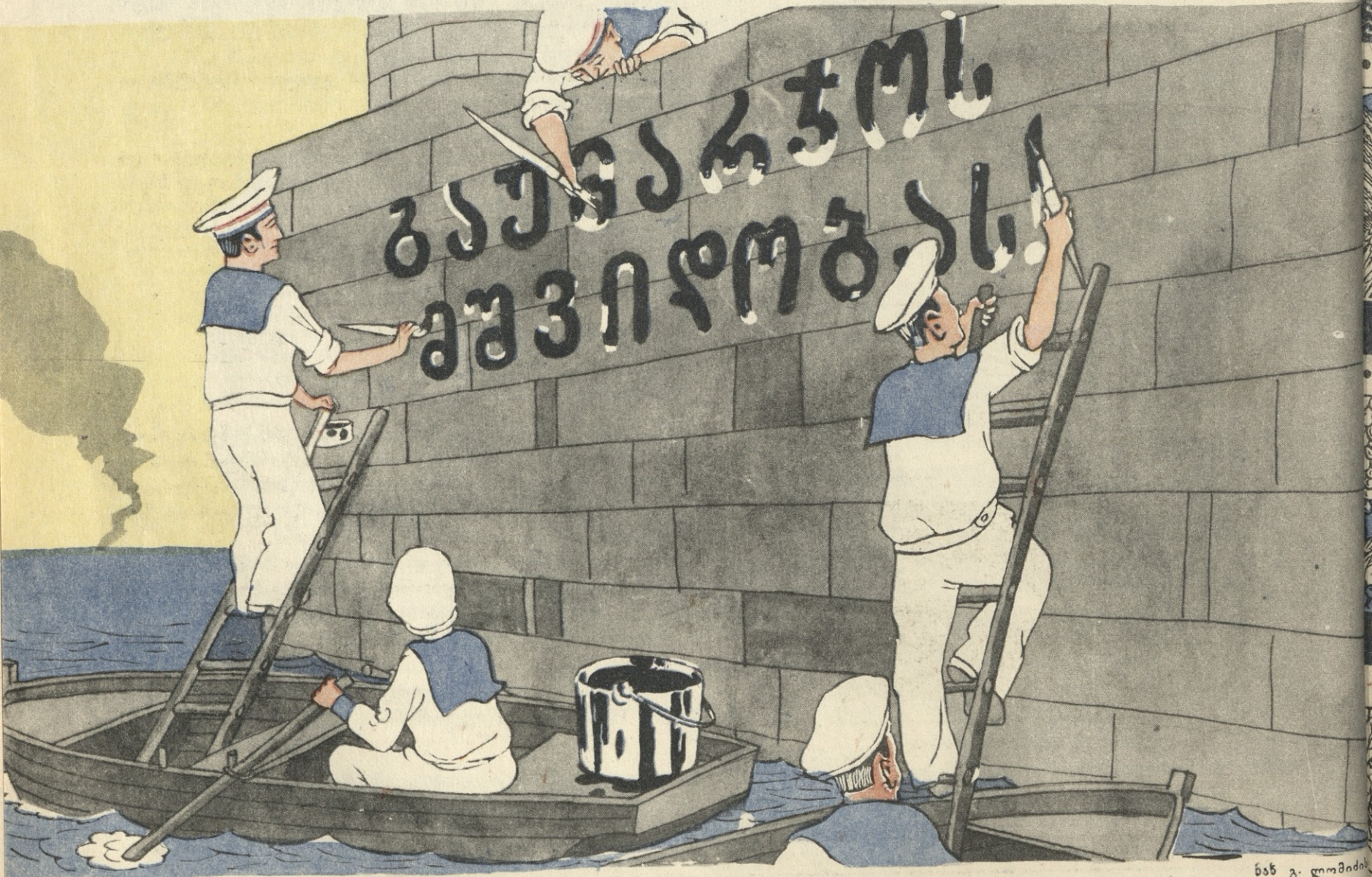
და მეზღვაურებმა გულმოდგინედ შეასრულეს ბრძანება...