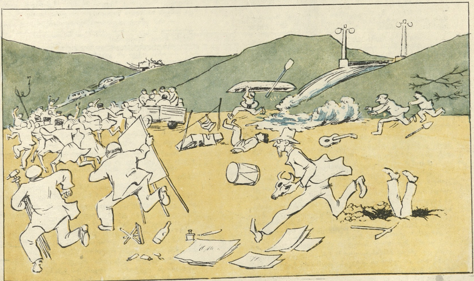
ზღვა უკვე თავზე წამოადგათ მღელვარე ტალღებით...