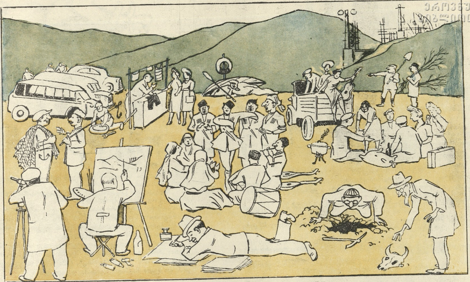
ხანამ ესენი ზღვის ფსკერზე იხსდნენ და ოცნებობდნენ, თუ როგორ შეხვედროდნენ თბილისის ზღვას...