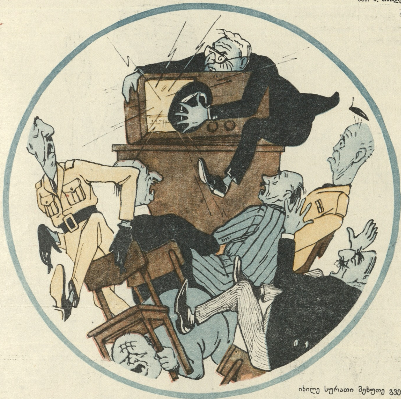
იხილე სურათი მეხუთე გვერდზე.