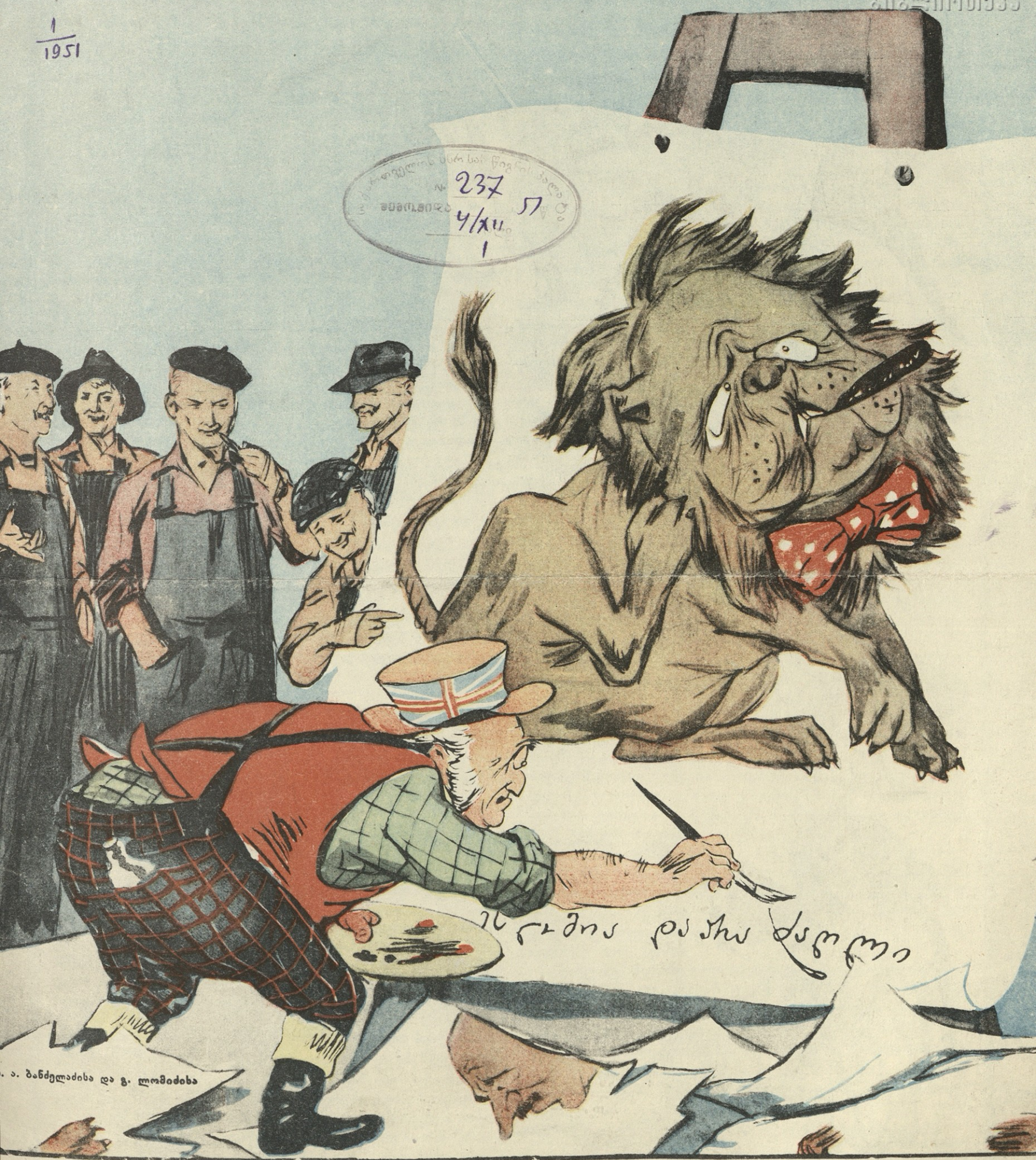
ა. ბანძელაძისა და გ. ლომიძისა

გამომცემლობის მისამართი: თბილისი, ვაჟა-ფშაველას გამზ. 237 № 237 4/11 1