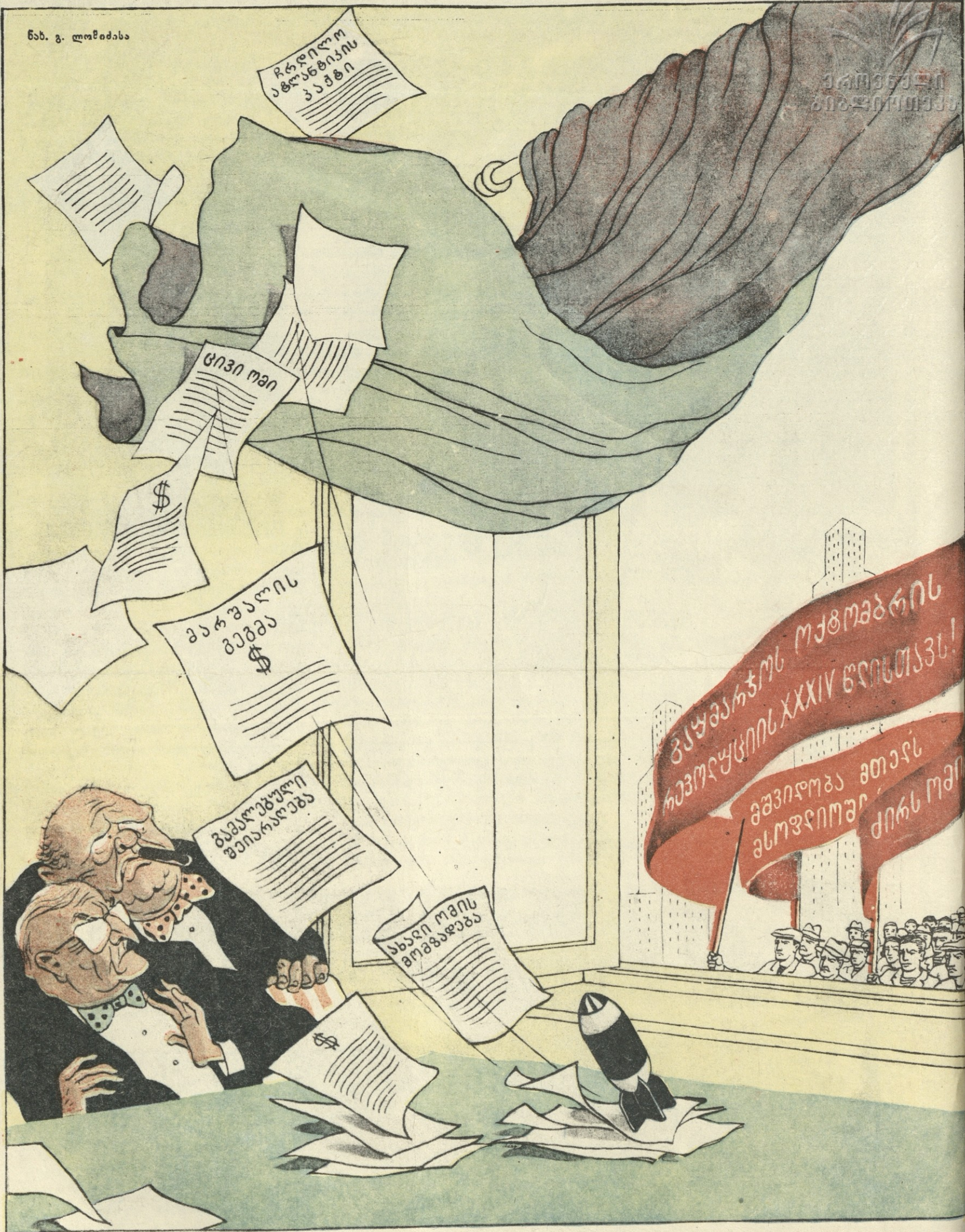
ტრუმენი და ჩეჩილი ერთხმად: — ეს ხომ ოქტომბრის ქარიშხალია, — ჩვენი დაწყობილი საქმეები ლამის დედამიწის პირიდან აღვავოს!.. მაგათ კი რომ ჰკითხო, ეს მხოლოდ დიდი ოქტომბრის საზეიმო დილაა და მათი დროშები სამშვიდობოდ ფრიალებენ!