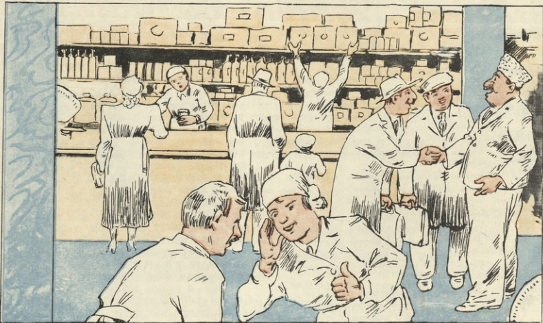
—კარგ გუნებაზეა დღეს ჩვენი დირექტორი! რევიზორიც კმაყოფილი დარჩა თურმე... —უთუოდ დეფტარ დანაკლისი ჩვენმა დირექტორმა. —არა, დანაკლისი რევიზორმა დაფარა.