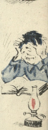
ნახ. ი. ქოქიაშვილისა