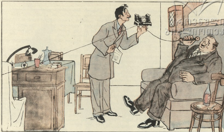
—ტელეფონი რეკავს, ბატონო, მაგრამ თქვენ ნუ შეწუხდებით, მე აქ არა ვარ... მე მოგარომეც უყრამოს. —რაიო, ძუტუ ვარო! (მღივნელზე) ვინაა, ბიჭო, ძუტუ? რა საქმე აქვს ჩვენს ტრესტთან? —ჩემი ცოლისმა ვახლავთ, ბატონო, თბ. ამას წინათ ახი ათახი რომ შეთვხარბა... და თქვენ უბატონო... —ბოი!