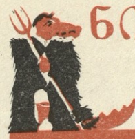
ნახ. გ. ფირცხალავაძე